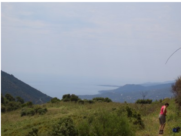
L'autre mer, but de notre périple, la méditerranée n'est plus loin.