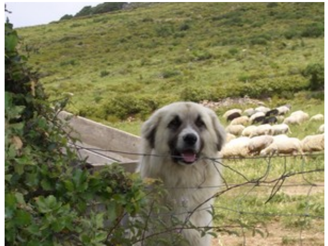
Troupeau de moutons et son sympathique gardien