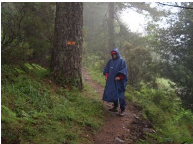
Malgré une météo désastreuse nous continuons notre périple sur des sentiers rendus glissants.