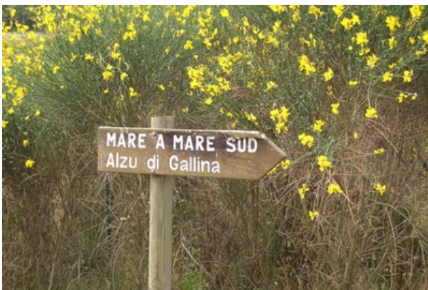
Circuit Mare a Mare Sud