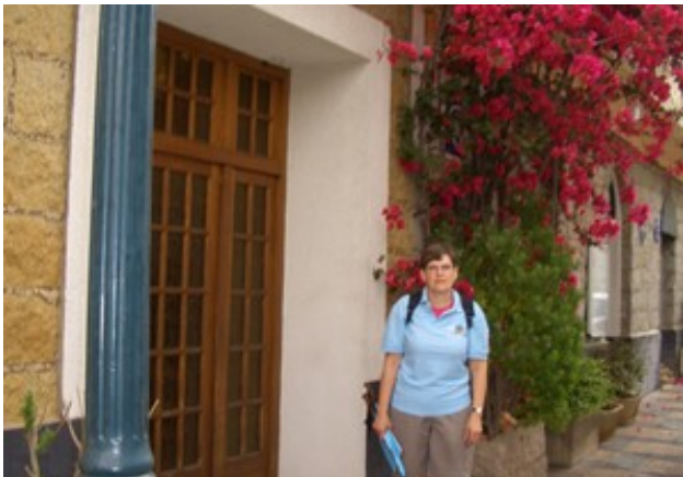
Sitôt arrivé, sac au dos, godasses aux pieds, cartes, boussole, en avant marche.