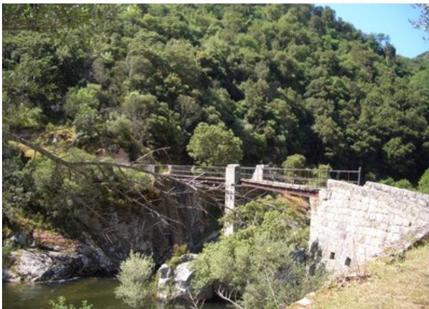
Petite émotion en passant sur le vieux pont... d'après Mimi il bouge !