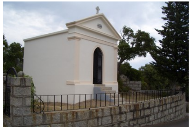
Caveau (tombe) bien caractéristique aux cimetières corses situés aux bords des routes