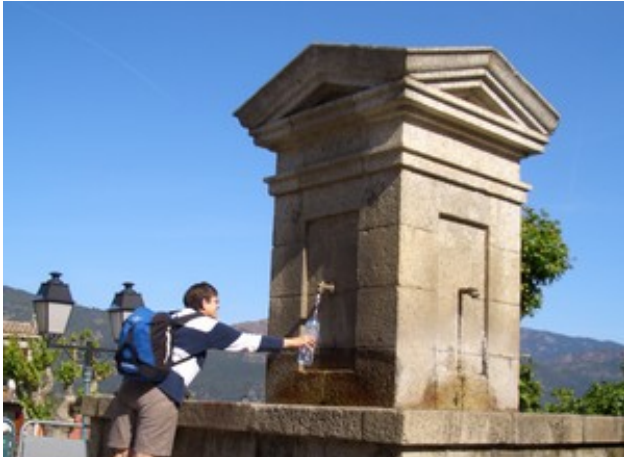
Provision pour la journée et dernière étape de notre séjour. Le soleil est enfin de retour