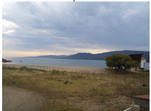
La randonnée pédestre est terminée et nous logeons à Propriano pour notre dernière étape