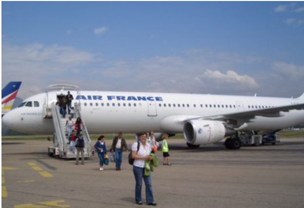
Débarquement sur l'île de Beauté. Corse nous voilà

1 ère étape: Porto Vecchio à Cartalavonu 14 km dénivelé 1000 m