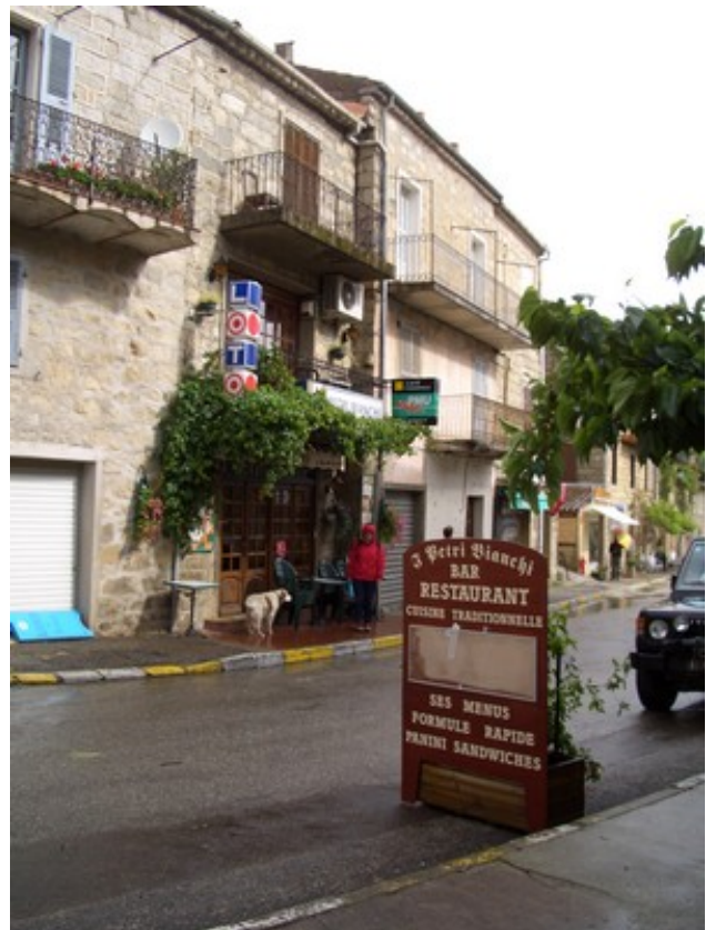
A peine entré à l'intérieur du gîte, une mini tornade s'abat sur la région et tout en étant obligé de tenir la porte de l'intérieur, les chaises que vous voyez s'envolent à une vitesse éclair, heureusement sans faire de dégât.