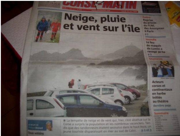
A voir les titre dans la presse locale les conditions atmosphériques sont épouvantables