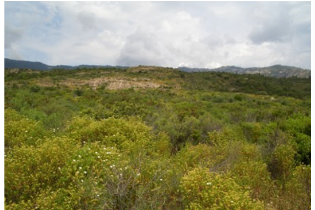
Vue sur le maquis