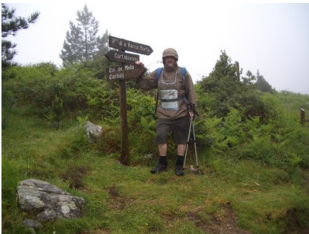
La question se pose: continuer ou pas ?