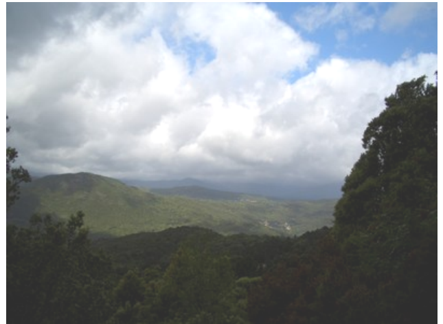
Au loin, nous devinons les toits de notre village, fin de notre étape.