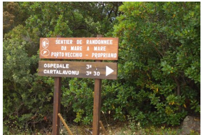
Panneaux directionnels sur les sentiers de grandes randonnées.