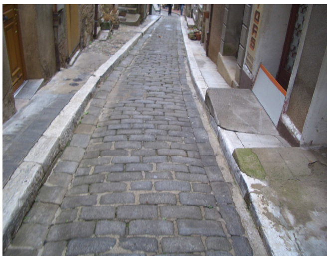
3 -Mais ce ne fut pas simple pour y arriver Ce fut au travers de ruelle montante parfumée