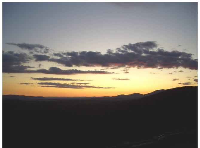
10 -Il se fait tard et c'est humant toutes ces senteurs que nous regagnons notre gargote