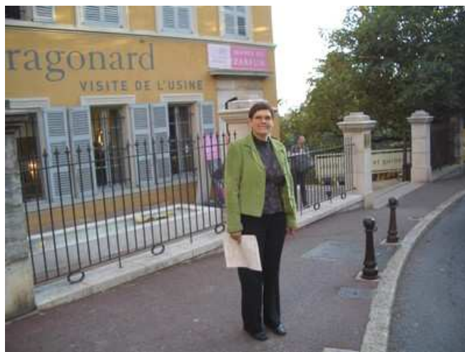
2 -Parfum bien sûr, c'est liste en main que Mimi va envahir la maison Fragonard