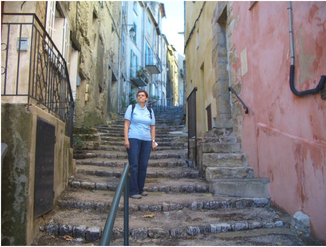
5 - Et encore et toujours cette odeur qui arpente ces ruelles