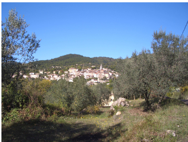
1-Grasse et ses environs et qui dit Grasse dit...

L'itinéraire nous fera découvrir un patrimoine naturel et culturel très riche ; il nous mènera au milieu des vignes, des oliviers plantés en terrasses et des plantes aromatiques, vers les sentinelles de pierres sèches aux façades ocre illuminées par le soleil, anciennes places fortes aux ruelles escarpées, que sont ces villages blottis entre mer et montagne.