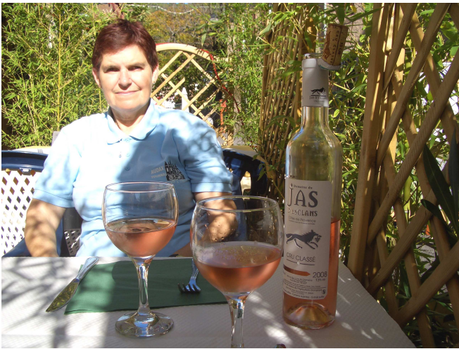
7 -Après tout ces efforts un petit rosé parfumé au parfum de Provence s'impose