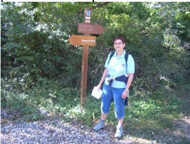
9 - Cependant la route est encore longue avant de regagner l'hôtel.