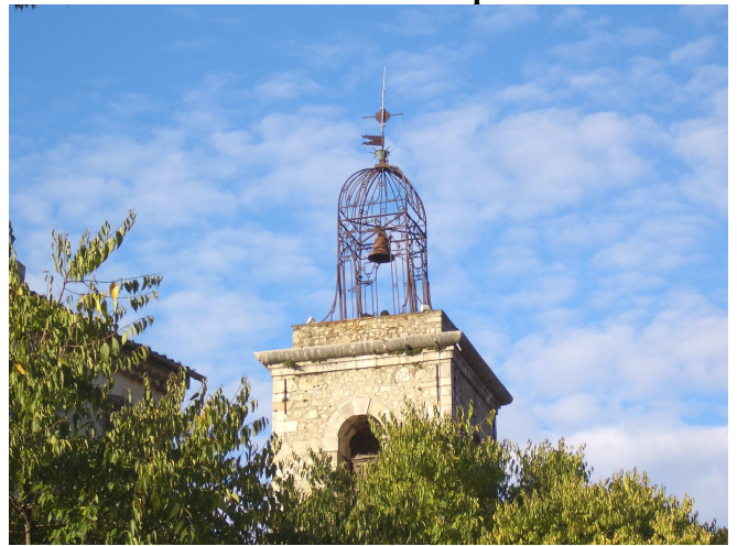
8 -La cloche sonne, il est temps de repartir