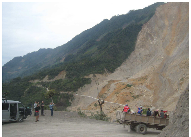
10) Pays marqué par les séismes et les éboulements.