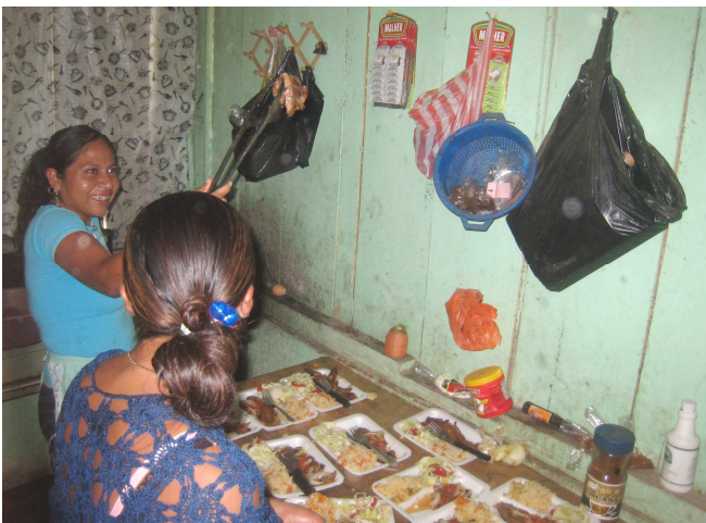
15) La cuisine locale ne paie pas de mine mais le groupe des cyclotouristes s'en réglera sans problème.