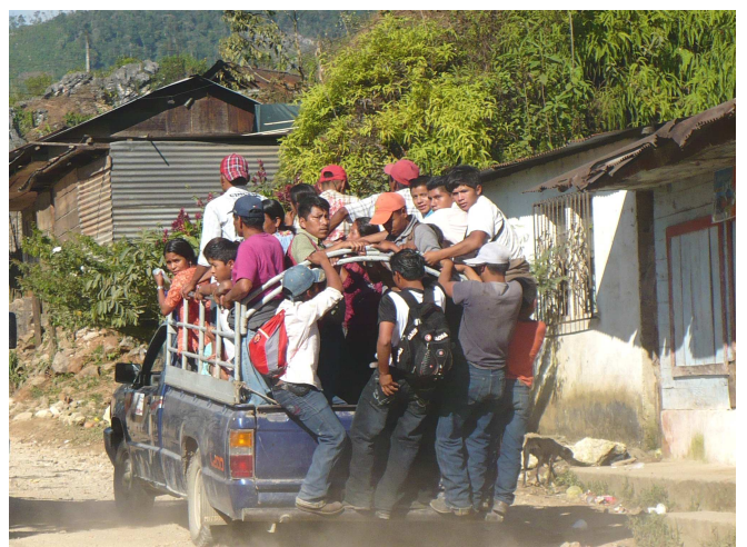
06) Y compris l'Amérique des transports en commun.