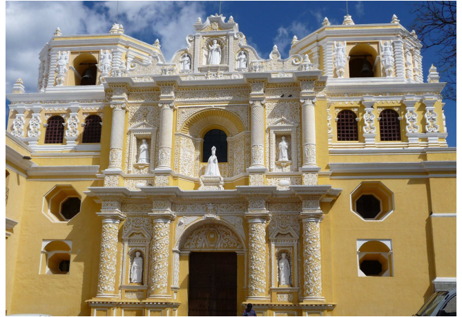
08) Dans un pays marqué par l'architecture baroque au service d'un christianisme très affirmé en diverses églises