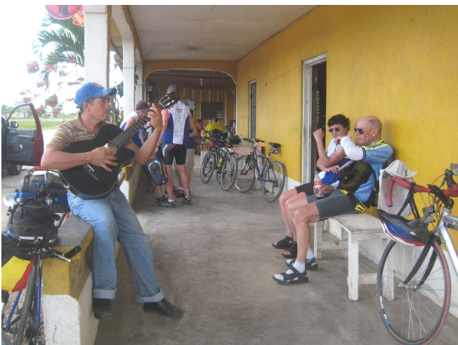
05) Cent fois la chanson de l'Eldorado de l'Amérique.