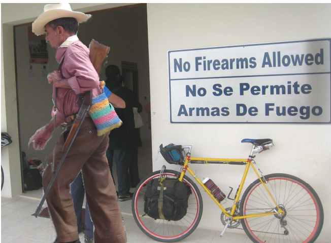
09) Pays de violence où l'on doit interdire les armes à feu.