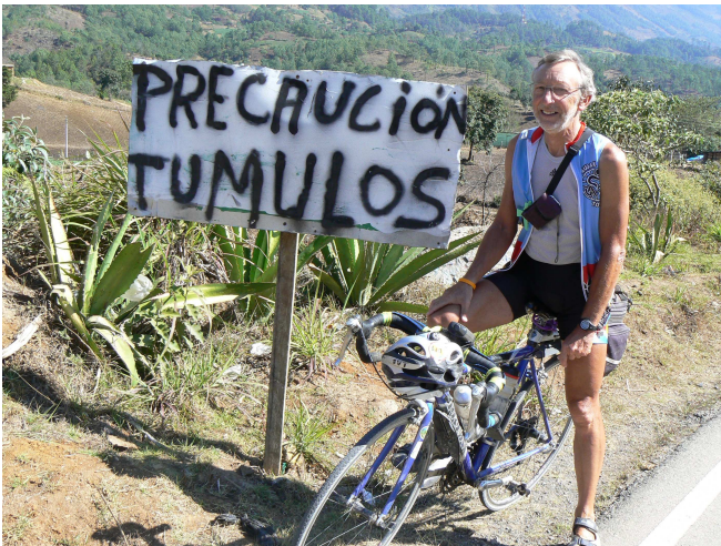
17) Là-bas un « tumulos » c'est un gendarme couché d'ici. Mais beaucoup plus gros et donc « precaucion » !