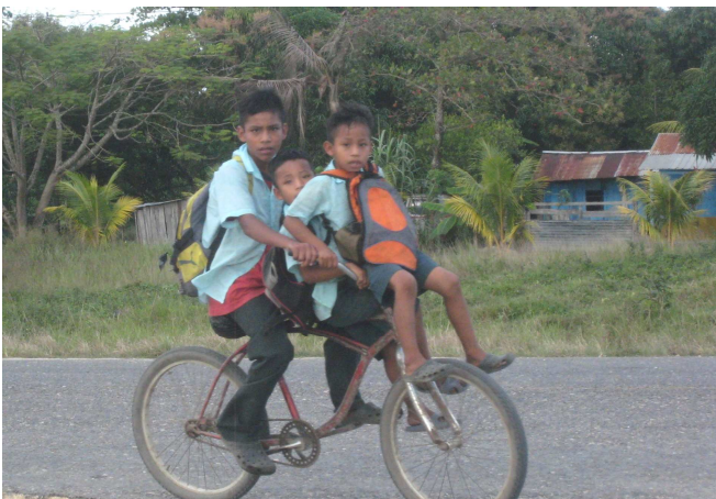
11) Le vélo y est conçu comme transport en commun.