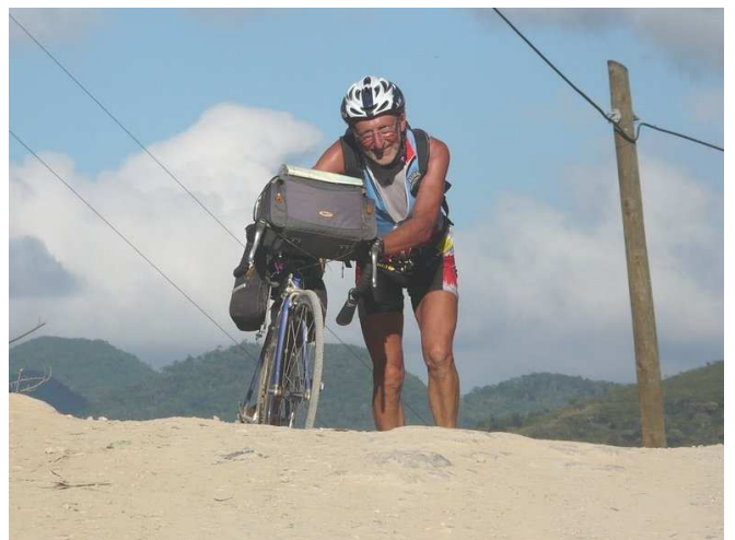
04) Pour surmonter les sommets à la force du mollet