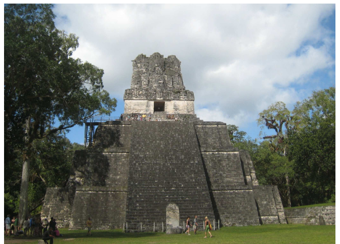
16) Parmi les merveilles du voyage, Tika, solide vestige de l'ancienne civilisation des Mayas.