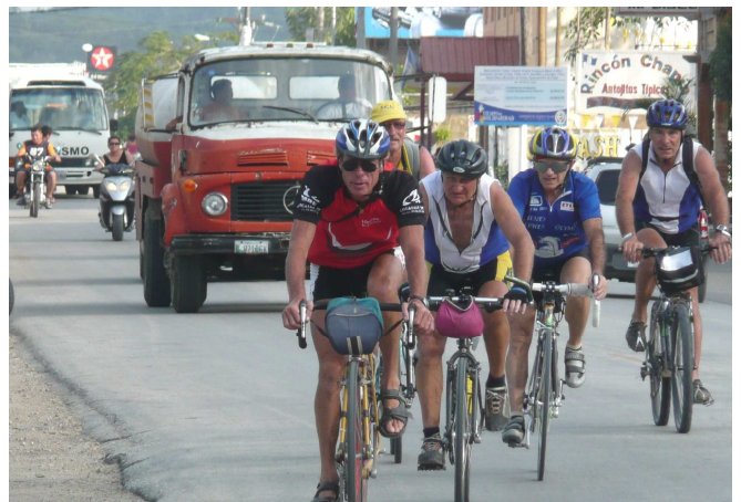
12) Pas facile de cycliser en ville au milieu des camions.