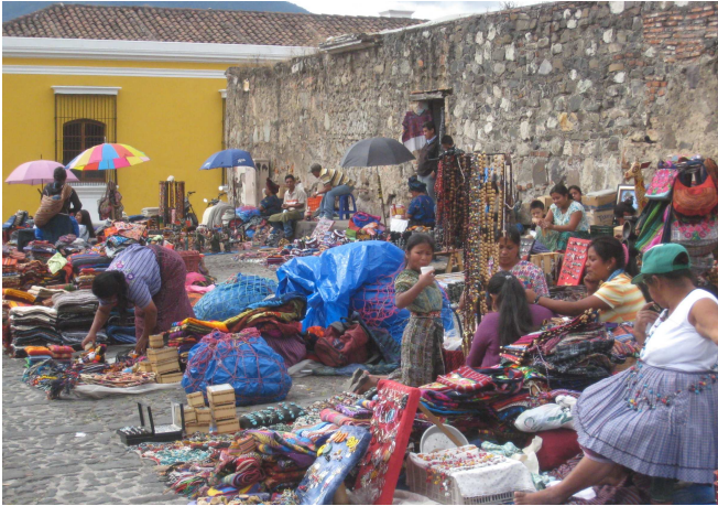
07) Ancienne capitale, Antigua est typique Amérique Latine (Espagnol) avec une population grouillante.