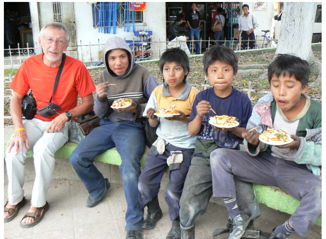
14) Ou, faute de chaussures à cirer, leur offrir à manger.