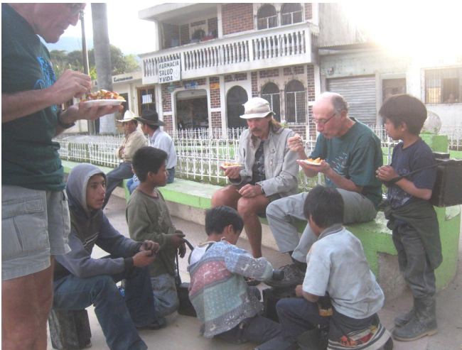
13) Manger tandis que les cirEURS de chaussures officient