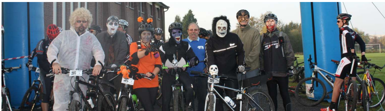
11) Ambiance Halloween avec un beau (mais effrayant ?) groupe de Bikers d'Antoing, fin octobre.