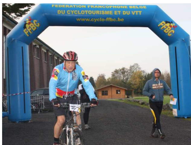
10) Passage sous le portique fédéral de départ.