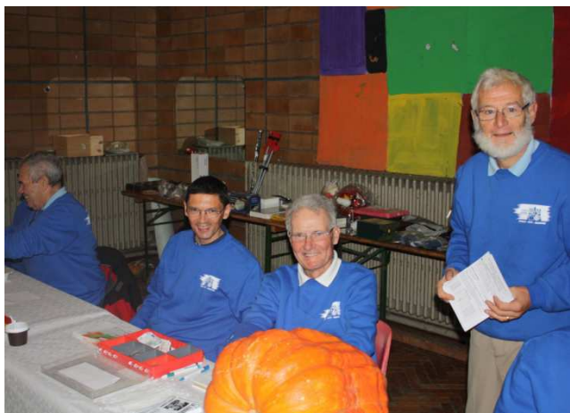
05) Inscription distinguant Affiliés et non-Affiliés.