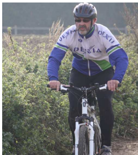
22) Un Biker pas rancunier qui roule encore avec la vareuse Dexia !