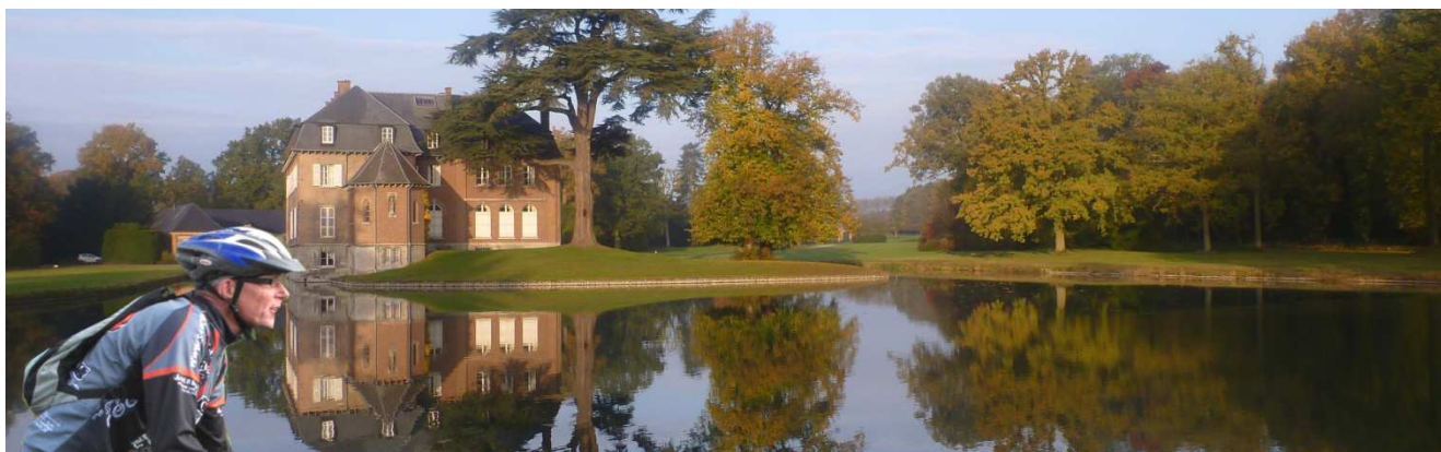
14) Passage admirable et exceptionnel dans la propriété du prince et de la princesse de Croy à Rumillies.