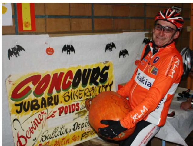
09) Au concours Poids potiron fallait dire 20,200 kg.