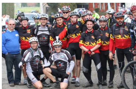
25) « Grenouilles » et « Diabes » !