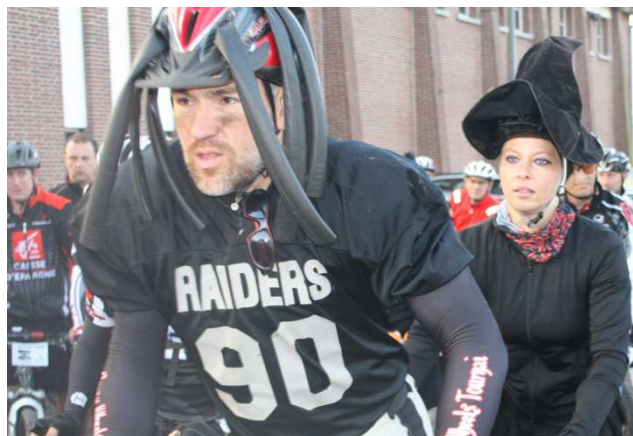
13) Tandem déguisé l'un en moche l'autre en belle !