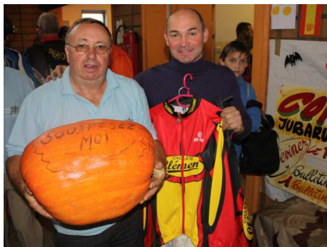
27) Le lauréat repartira avec le potiron de Marcus pesant 20k200gr.