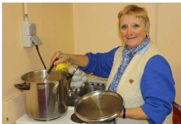
08) « Par ici la bonne soupe sur vitaminée »