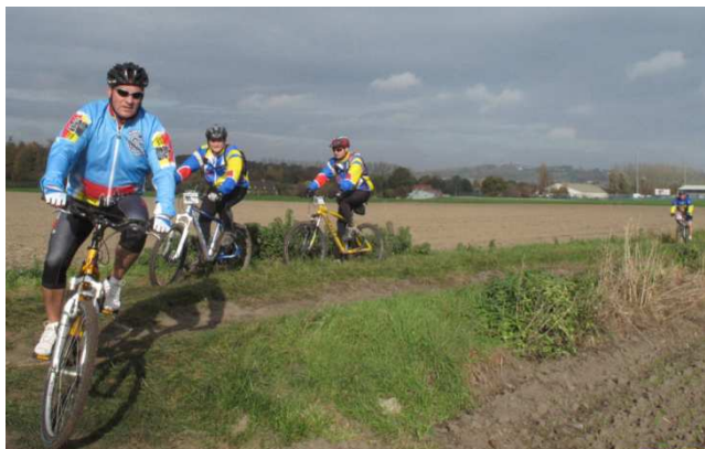
19) Après le Mont, la plaine du stade Luc Varenne.