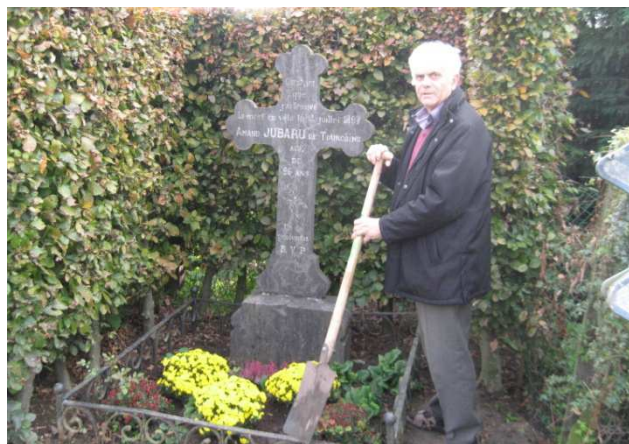
16) La croix Jubaru fleurie pour chaque Toussaint.