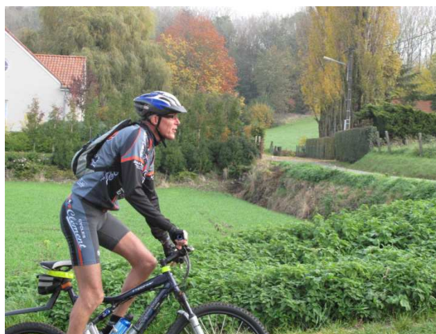
18) Paysage nature près de la Ferme du Reposoir.