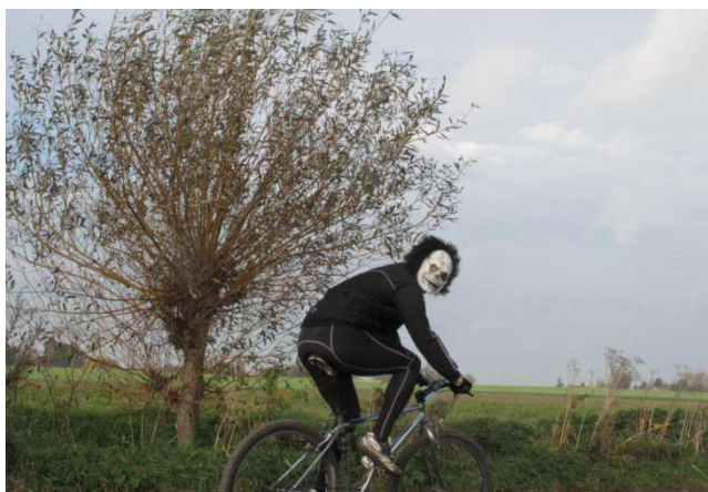
15) Campagne tournaisienne hantée Halloween.