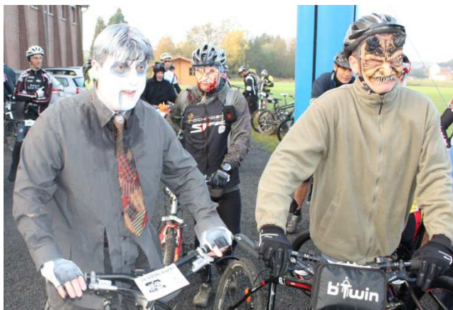
12) Déguisements parmi les plus originaux du jour.