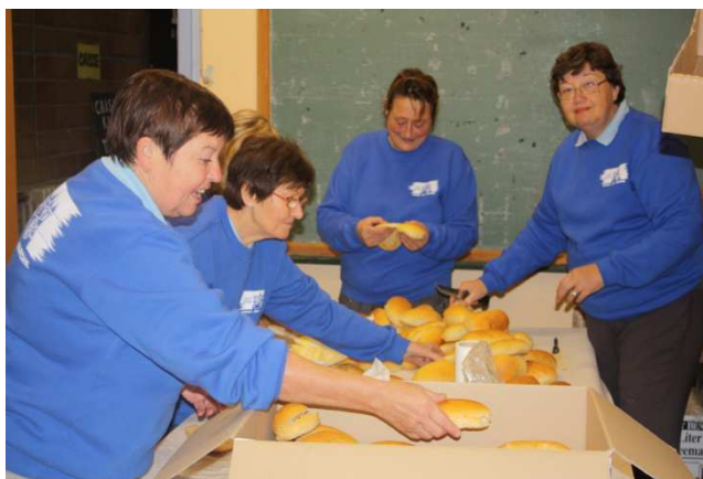
07) Préparation de 700 ou 1000 pistolets ?