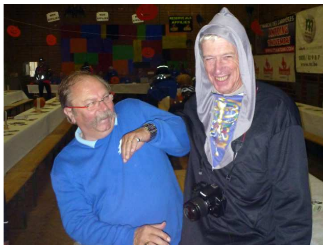
02) Moustache effrayé par Halloween Webmaster.