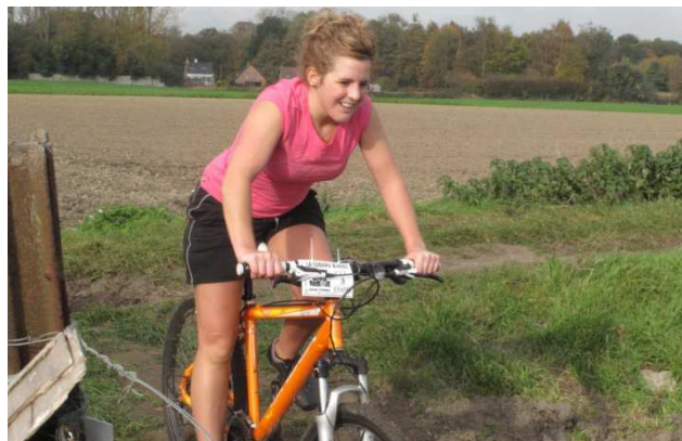
20) Après les larmes dans le mont, le sourire ...vtt.