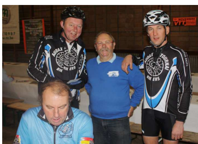
06) Audax Routier et Audax Bikers en maillots de ...