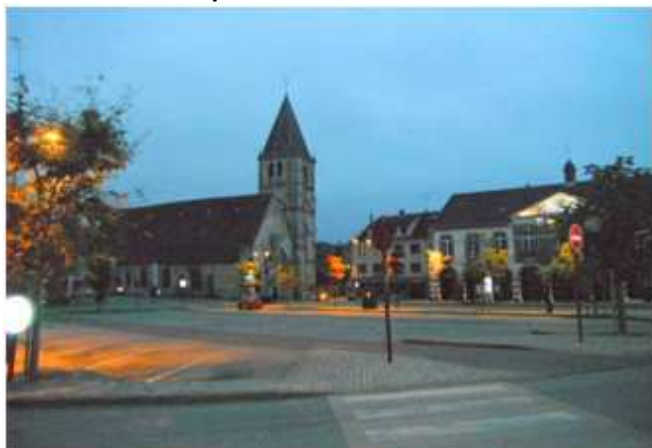
5) Longny-aux-Perches souvenir de quelques heures de repos à même le sol lors du PBP 1983