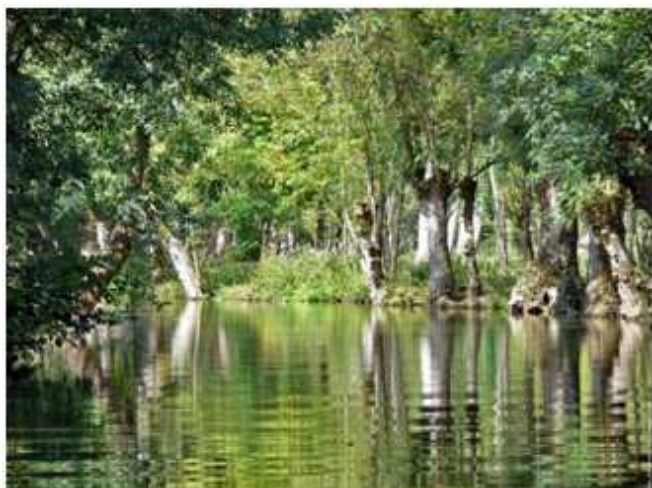
7) C'est l'occasion de visiter le Marais Poitevin