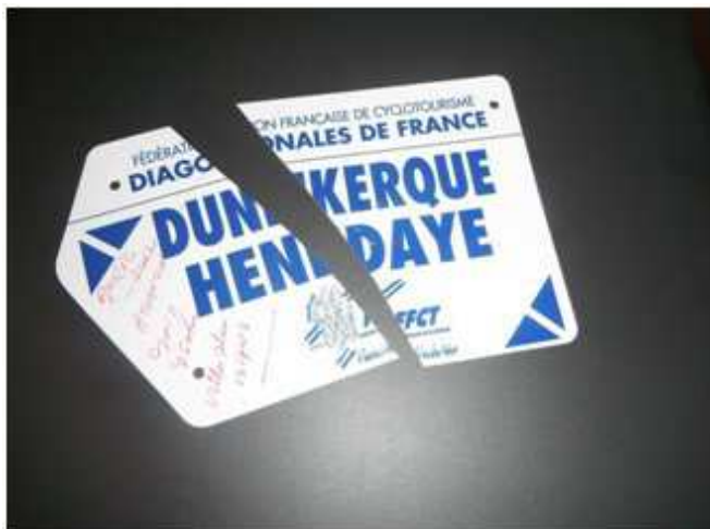
1) Décision prise de remettre le couvert de suite après l'échec d'avril.

Cette Diagonale tentée en avril 2012 et arrêtée après 450 km dans la ville du Mans pour cause de conditions atmosphériques épouvantables ne pouvait rester sans suite.