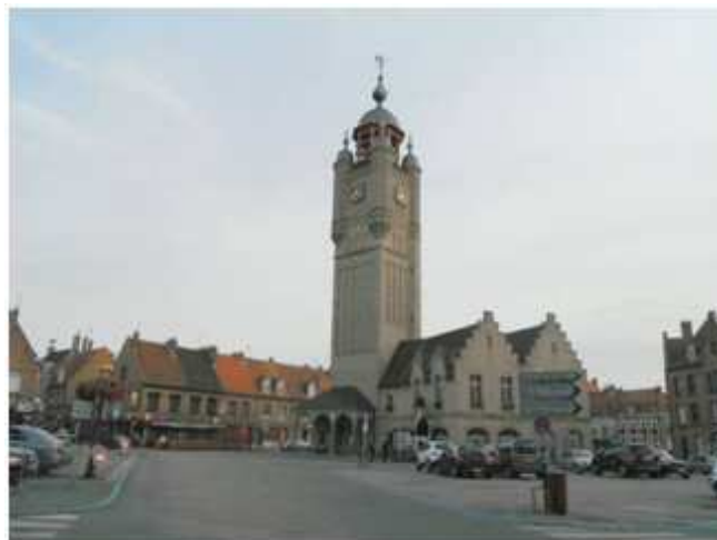
2) Un petit détour de 22 km par Bergues pour une dernière vérification du matériel