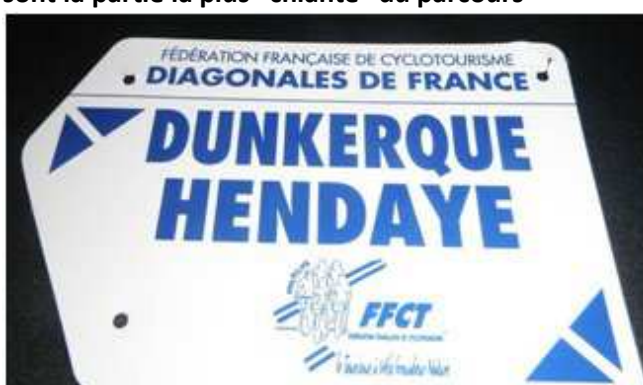
12) Cette 6 ème Plaque de cadre, je vais l'encadrer

Il m'en reste trois pour finir la série des 9, à savoir :