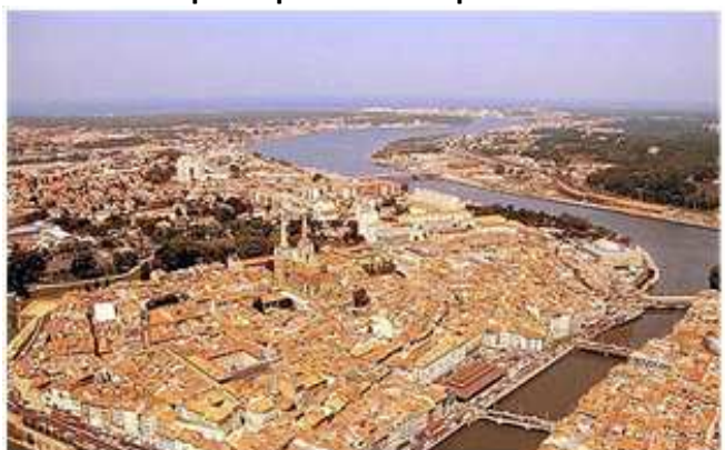
11) Hendaye se profile, voyant ainsi la réussite de cette Diagonale de France tant espérée