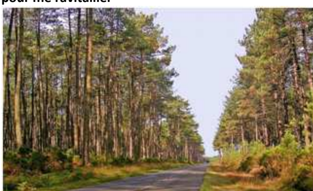
10) Les Landes et ses interminables lignes droites sont la partie la plus "chiant" du parcours