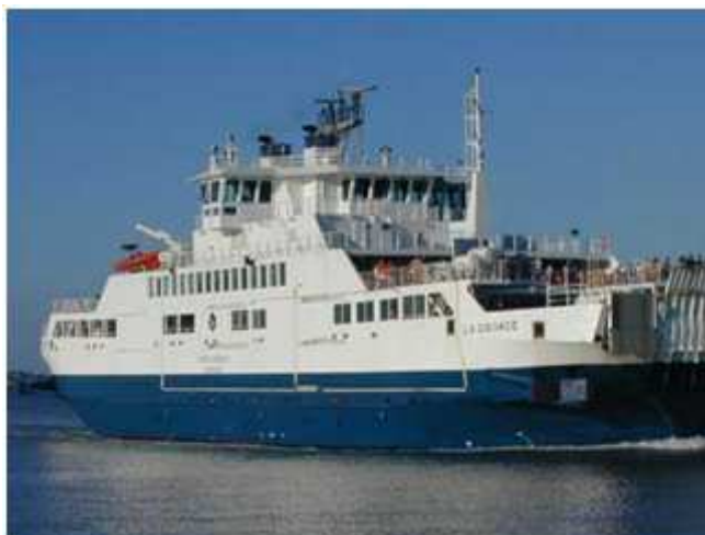
8) Pendant ces 20 minutes de traversée, j'en profite pour me ravitailler