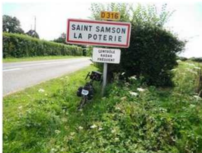
4) Pas de commerce, une photo s'impose comme preuve de passage