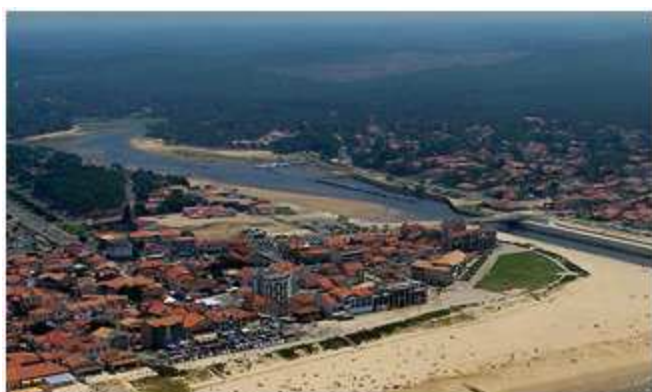
9) Un dernier contrôle avant Mimizan qui m'accueille avec une fine pluie qui ne durera pas