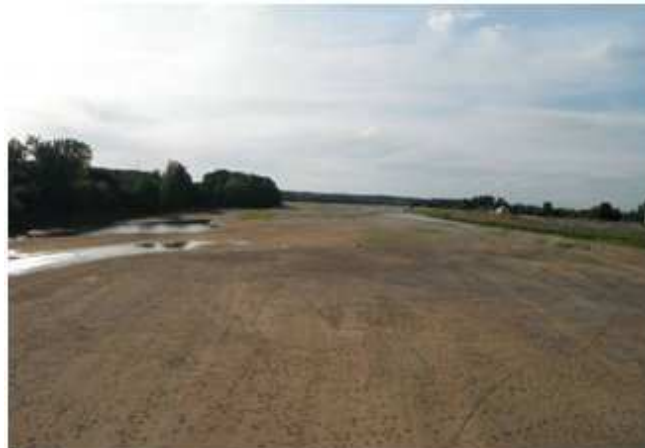
6) Traversée de La Loire à Genes dans le Maine et Loire pour rejoindre les Deux Sèvres.