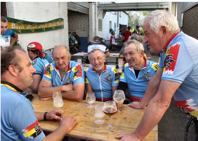
4) D'un côté les bennes se remplissent et de l'autre les verres se vident. Pour faire passer la poussière ?