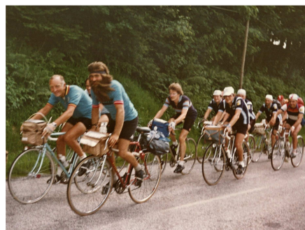
05) Mais l'Aigle avait du plomb dans l'aile. Le 1000 km de 1983 fut le dernier du Capitaine de Route.