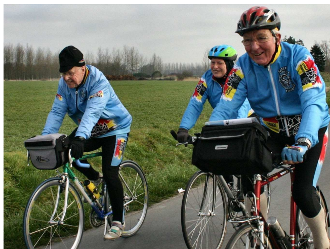
17) Aux Audax Tournai se sont côtoyés deux anciens présidents : Christian de la FBC et Raymond de la LVB