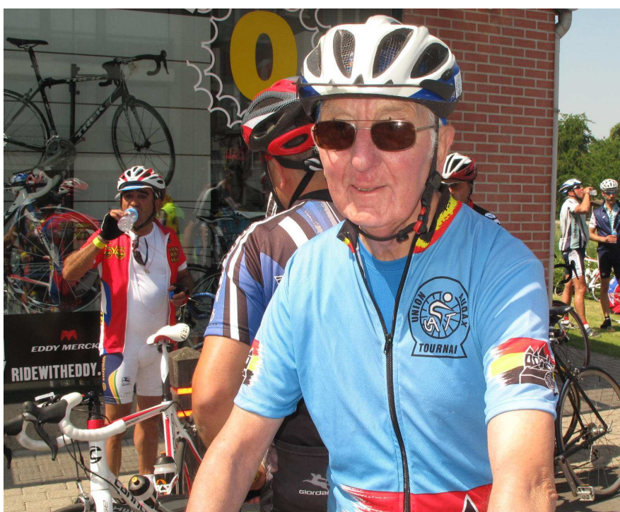
18) Il le disait et redisait à l'envie : «Je ne voudrais pas mourir sans ... ..... ETRE AUDAX POUR L'ETERNITE. (R.I.P)