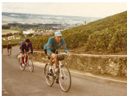
03) Cyclo hors pair, ici en 1973 à la Montagne de Reims il nous initia au cyclotourisme d'envergure.