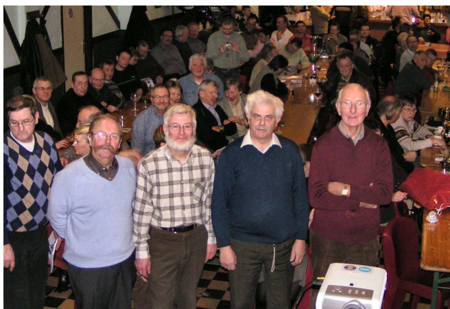
14) Les relations, inexistantes depuis 20 ans, sont redevenues normales et même cordiales, avec tous.