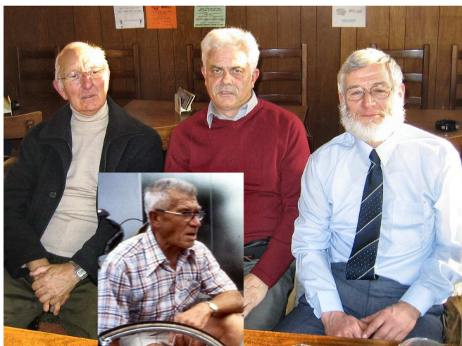
12) Au local après le décès de Maurice Vertongen, l'apôtre du cyclotourisme d'après guerre.