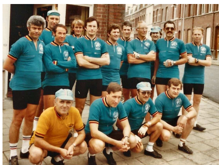
04) C'était l'époque des grands brevets Audax et Euraudax dont les Audax furent grands organisateurs.