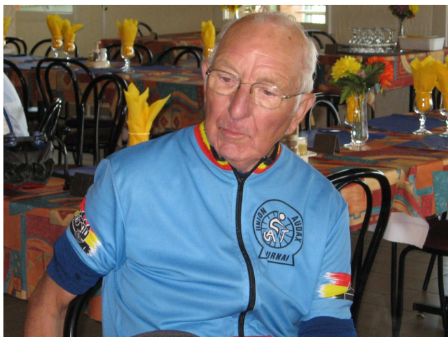
02) Après une belle « carrière » de président des cyclos de la LVB, il retrouva son club et rallia la FBC.