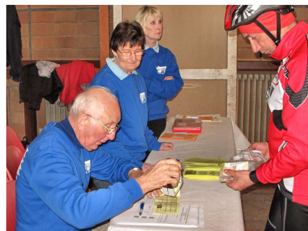
20) Désormais au service des Audax