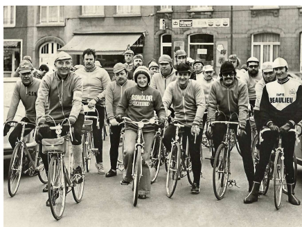
07) Sortie club dans les années 70.