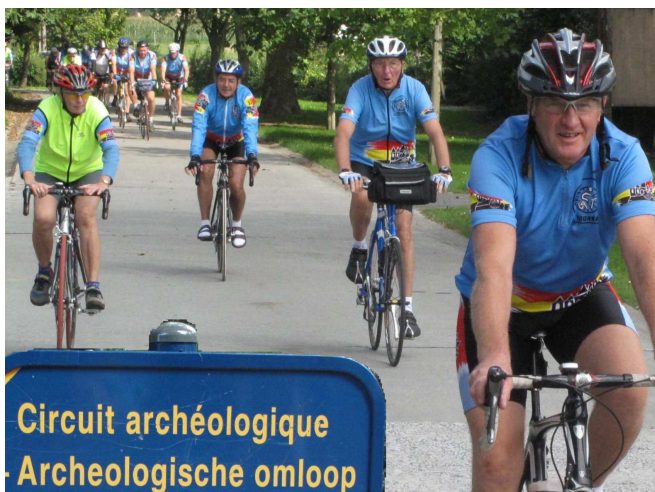
16) Son plaisir fut de retrouver le peloton des Audax même si, à 80 ans, il ne tenait plus l'allure ... Audax.