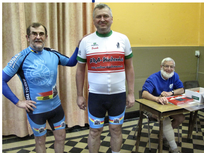
01) Cuissard Audax au cyclo qui avait oublié le sien !