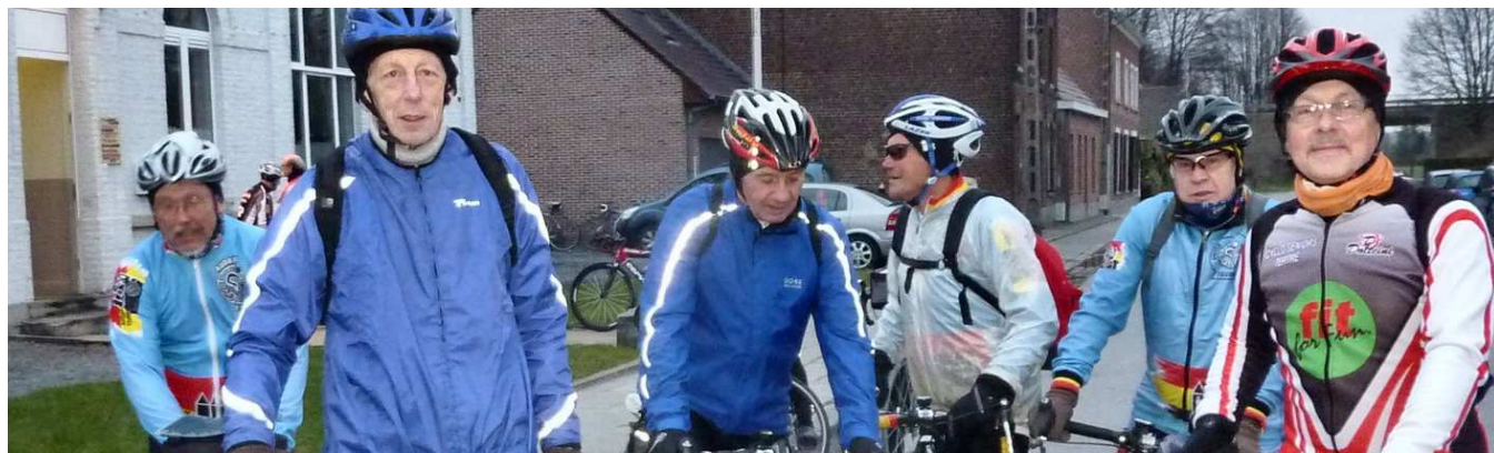
05) L'allure est libre alors on s'associe, ici entre Borains, pour rouler sur un 200 km fléché sommairement.