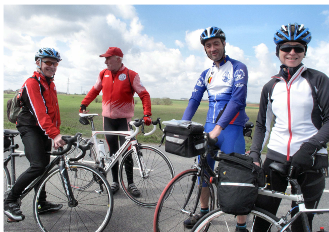
10) Arrêt pour une fuite ... qui n'arrive qu'aux autres !