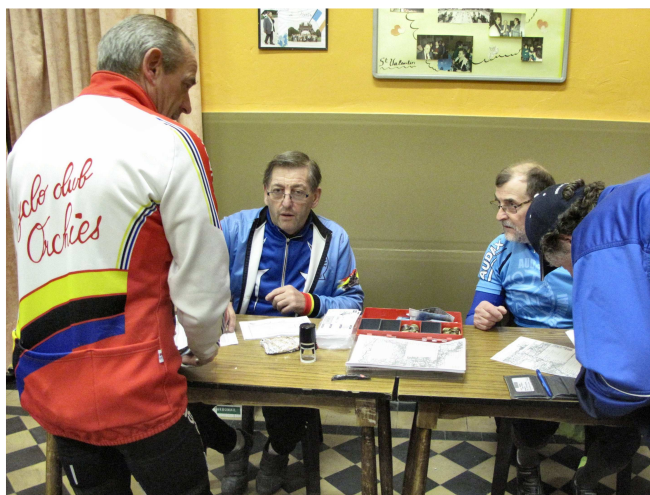
02) Aux inscriptions pour 76 Randonneurs de 200 km.