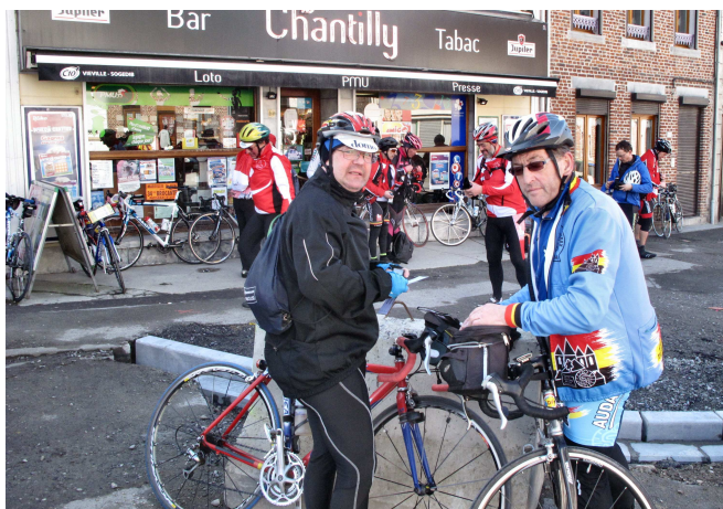
09) Arrêt pour le contrôle au Chantilly de Maroilles.