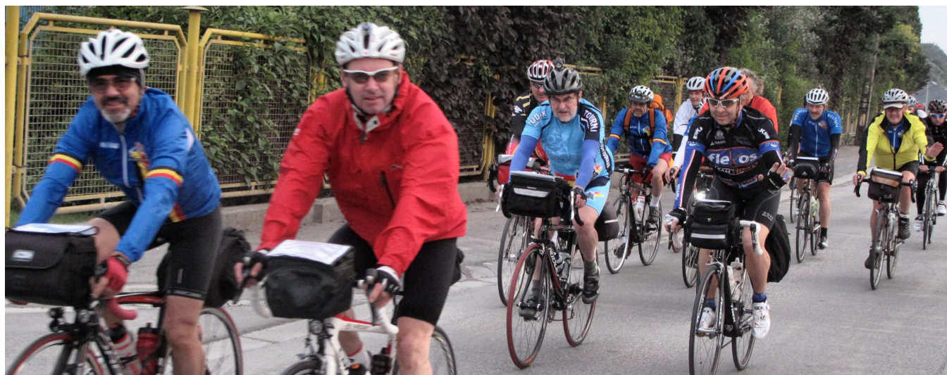
04) Avec armes et bagages car pas de ravitaillement organisé sur un parcours non fléché. Contrôles fixés à Maroilles km78, Laon km149, Compiègne km220, Moyen Multin km273, Compiègne km 321 (logement en F1 pour qui le souhaite), Grandillers km395, Chaulnes km474, Arleux km539. Une fameuse randonnée !