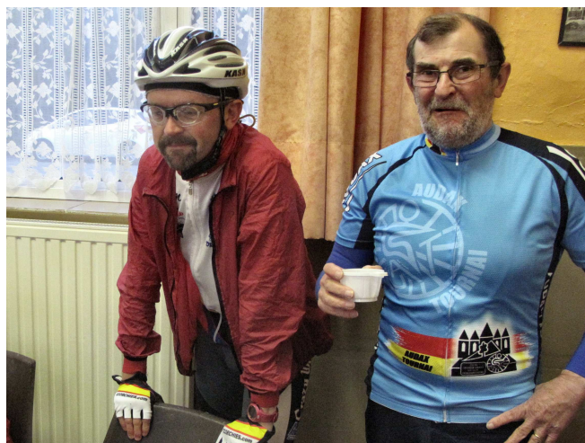
02) Au local Audax Tournai le président de la FFBC.