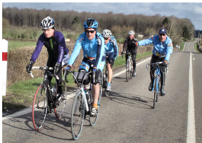
07) Sur la route des Audax qui ont la socquette légère