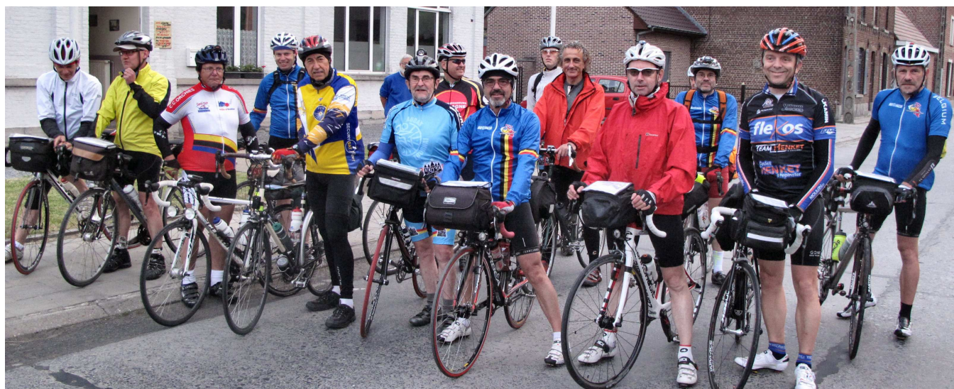
03) Départ groupé pour rester un peu en compagnie sur 600 bornes à boucler librement en moins de 40 H. Les 21 participants sont tous expérimentés et souvent en préparation de « grands trucs », comme une Diagonale !