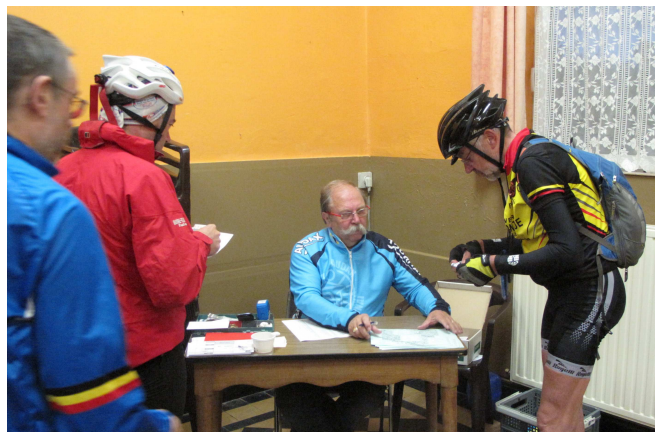
02) Pour libérer Danicau, Moustache inscrit 32 cyclos.