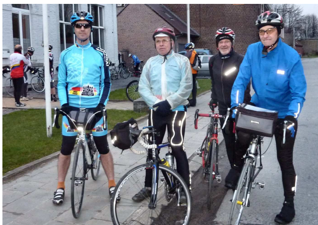
06) Audax en préparation d'un voyage en Auvergne.