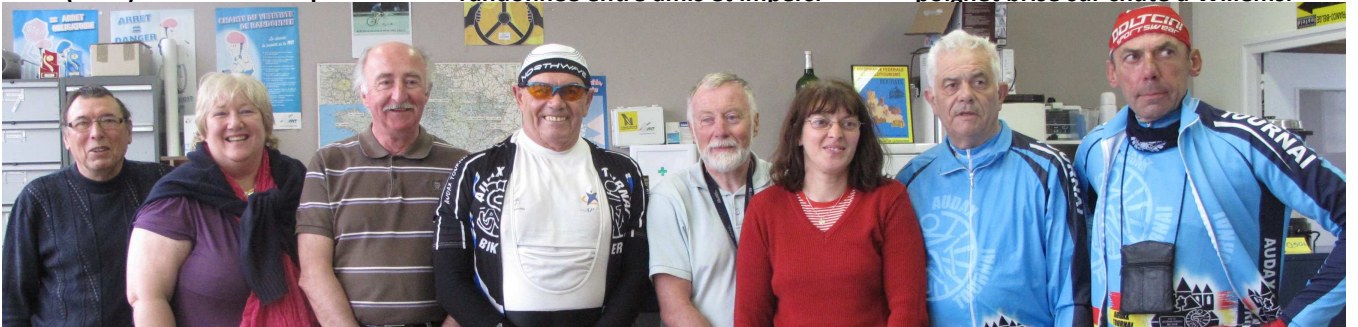
07) Visite de courtoisie au local du Nord-Touriste de Roubaix qui n'avait enregistré que 24 participants !