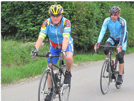
04) Parcours reliant les 4 grandes villes (LKTR) de l'EuroMétropole.