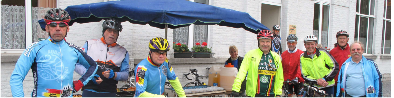
01) Le 23 juin, pas seulement à cause du mauvais temps, le LKTR réunira 305 cyclos dont 120 à Tournai.

C'est l'histoire d'une nouveauté, un peu compliquée, pour relier Lille, Courtrai et Tournai, via Roubaix en l'honneur de l'EuroMétropole qui est finalement tombée à l'eau. Au moins les Audax et les Courtraisiens auront-ils mobilisé 120 et 150 participants ... pour 16 et 24 à Lille et Roubaix.