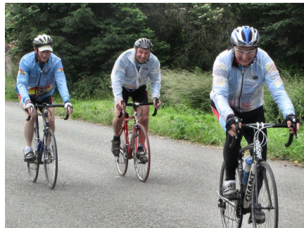
05) Sous un ciel plutôt maussade randonnée entre amis et impers.