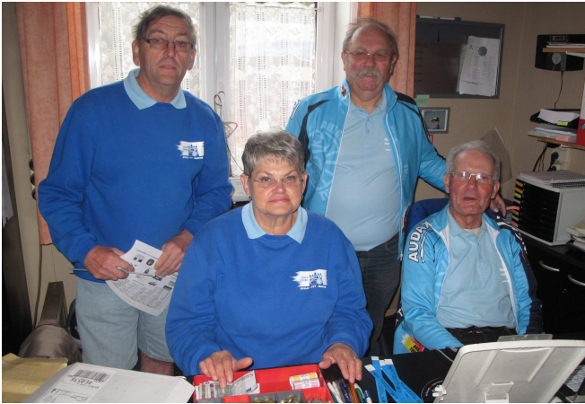
02) Les Audax étaient prêts pour faire leur part.