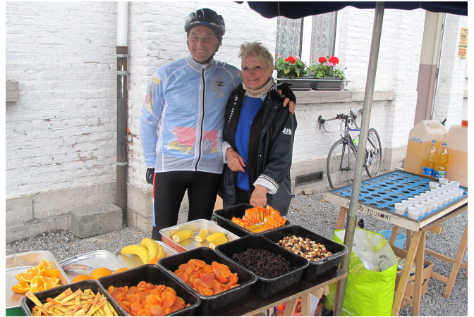
03) Avec un accueil digne de leur savoir-faire.