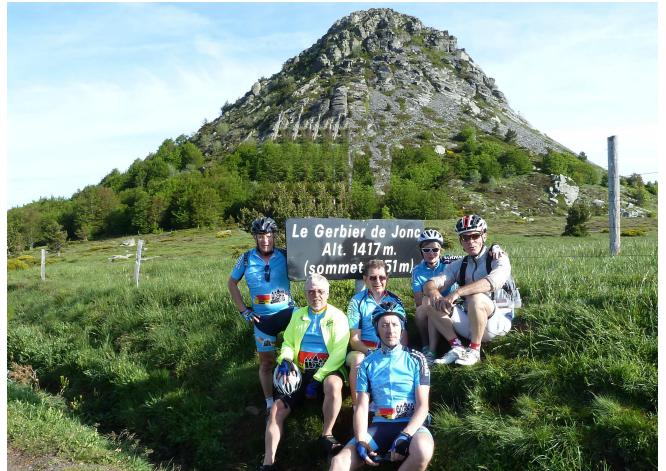
07) La bande des 6 au Mont Gerbier de Jonc (1417m).