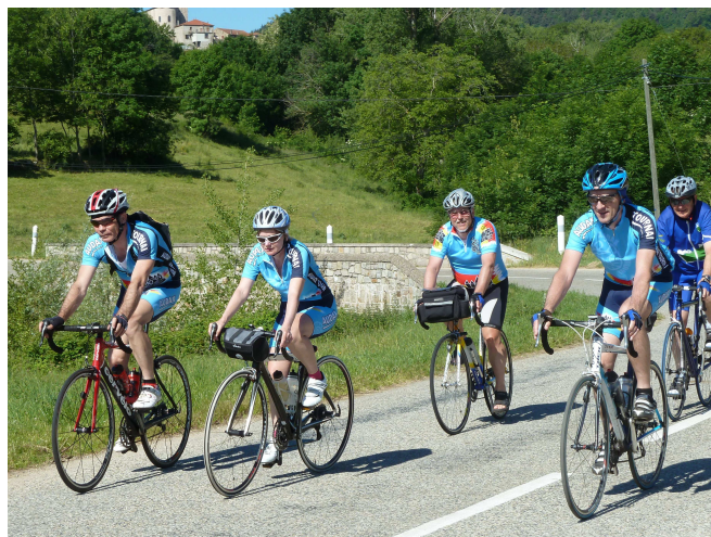
03) Une randonnée exceptionnelle en Ardèche.