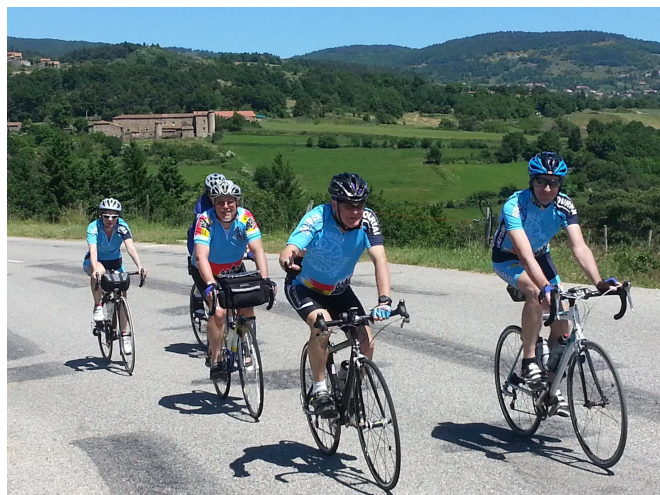
02) Du bleu Audax sur les routes de l'Ardéchoise.