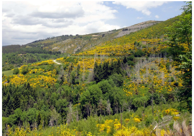
05) Pleine nature de genêts au col de Mézillac.