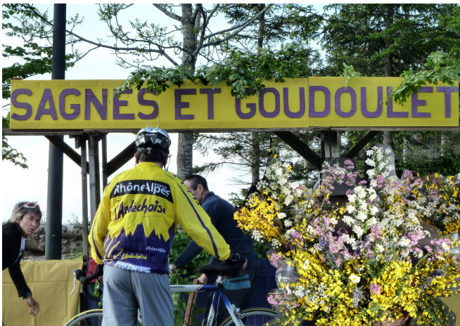
06) Logement d'étape à Sagnes et Goudoulet.