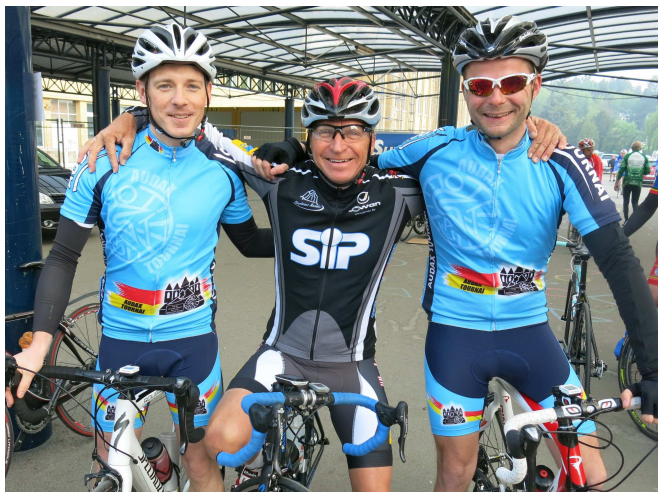
1) Rares mais costauds les Audax Tournai... et Crazy.

Plus grand événement et seul majeur de la FFBC, le Mons-Chimay-Mons des Dragons Audax reste la " Classique des Cyclotouristes " avec environ 2000 cyclos. Toujours le 1 er Mai. Avec une dizaine de présents en 2014, on constate que les ... Audax Tournai s'y font rares après avoir longtemps remporté la coupe du plus nombreux. L'ambiance est y pourtant bonne et les parcours attrayants. Pardon aux Audax oubliés (pas vus, en réalité) car les photos n'en montrent que la moitié.