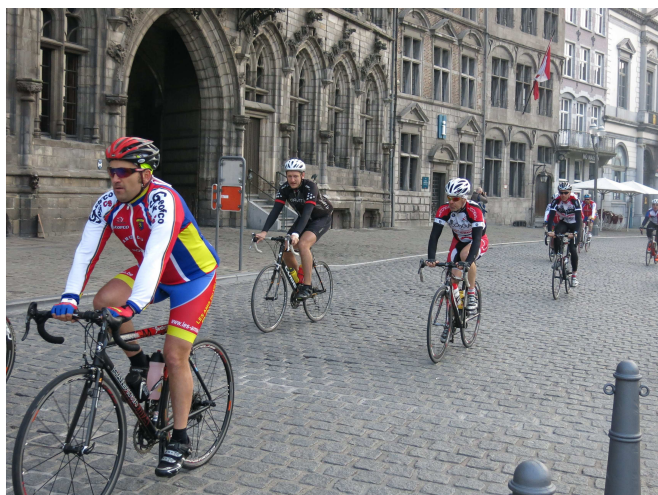
3) Pittoresque traversée matinale en cité du Doudou.