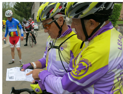
7) Un choix de parcours allant de 70 à 210 km. Les 100/150 sont déjà beaux.