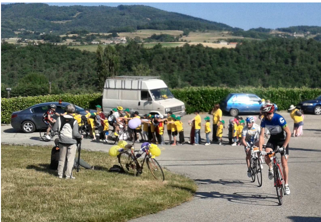
11) Comme une montée du col de la Croix Jubaru ... mais 20 fois plus long.