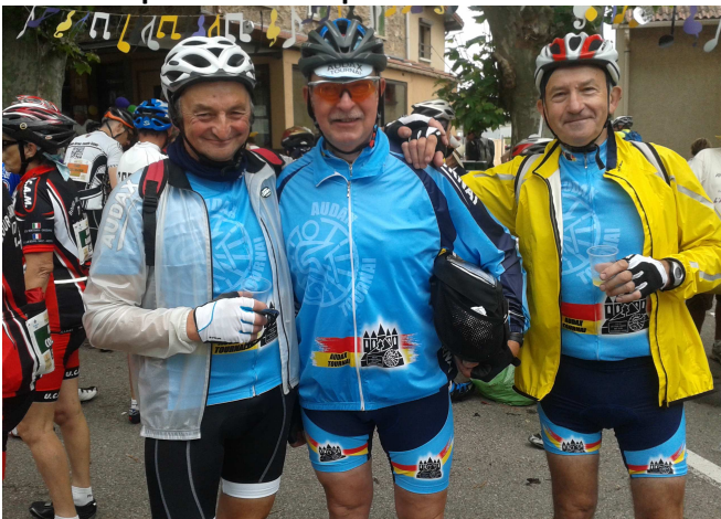
03) Notre trio à l'un des multiples ravito organisés dans les villages traversés.