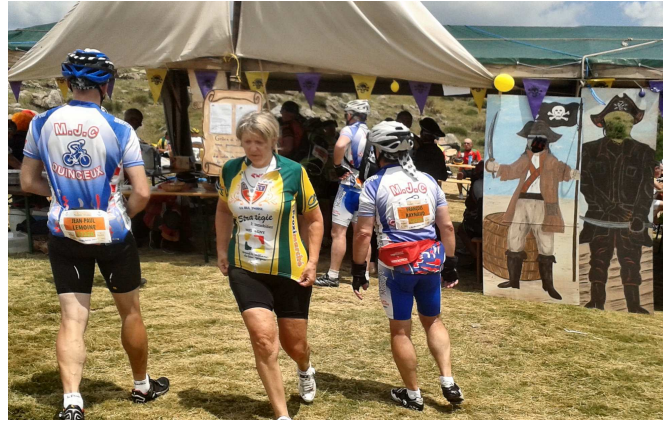
08) En haut de l'un des nombreux cols, accueil par les « pirates » de l'endroit. Chaque village a son décor.