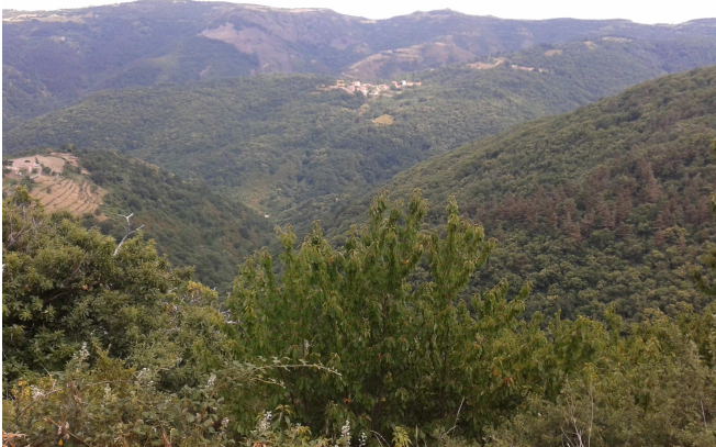
09) Une vue des monts de l'Ardèche : « Que la montagne est belle » chantait l'Ardéchois Jean Ferrat.