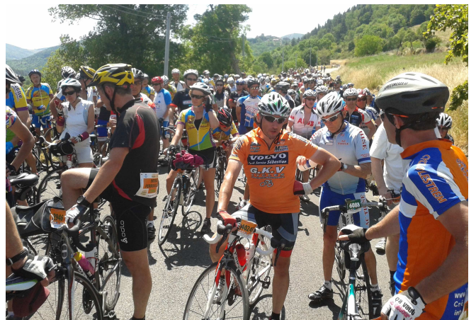
12) Bouchon à l'arrivée suite à une mauvaise chute d'un cyclo. Rien n'est simple dans cette organisation.