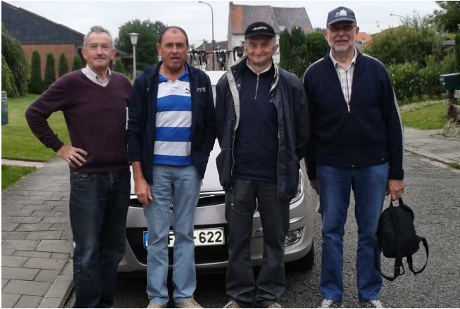
01) Le jour du départ : ils n'ont pas l'air inquiets... ils ne savent pas encore ce qui les attend.

Compte-rendu illustré de CHRISTIAN DEKETELE