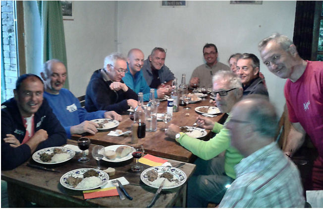
07) Repas du soir au gîte avec 3 Suisses, 2 Français, 2 Allemands et 4 Tournaisiens : on a bien sûr parlé de vélo, mais aussi de coupe de monde de foot.