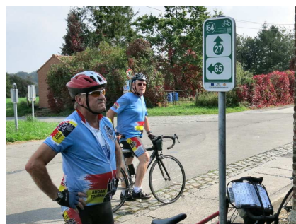
5) Chaque N° indique un carrefour. Ici direction vers deux carrefours.