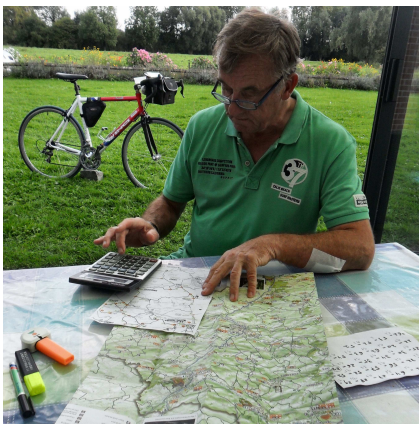
6) Préparatif sur carte papier ou net. Il faut lister les N° et le Km entre N°.