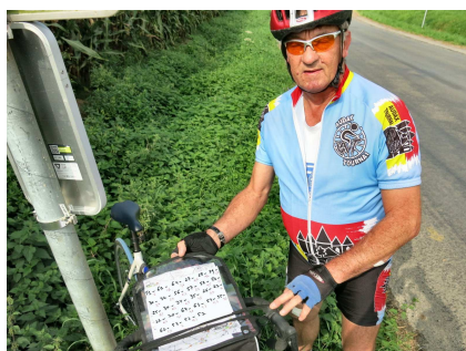
4) Avoir la liste des N° à suivre sur soi. Le sac de guidon est pratique.