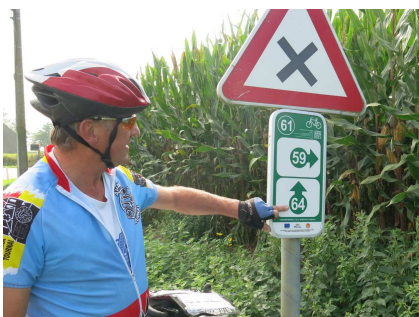
3) Savoir quel N° de carrefour suivre. Ces N° remplacent les noms de lieu.