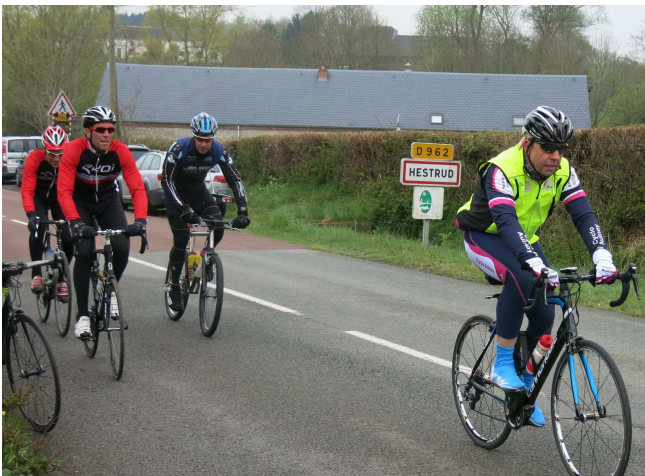
3) Double passage à Hestrud sur longues distances.