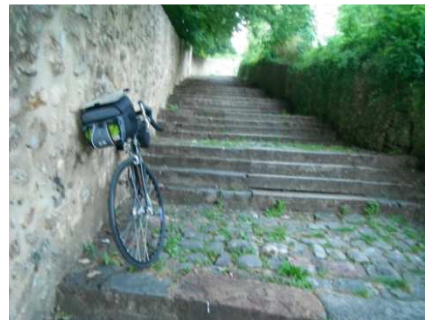
15 Petit raccourci mais ...