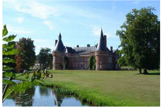
9 Maillebois avec son château, sa rivière la Blaise (affluent de l'Eure) et SURTOUT son bar OUVERT