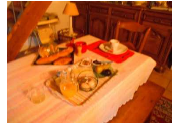
13 Accompagné d'un superbe petit déjeuner