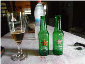
10 Deux bières belges pour moi à la maison d'hôte