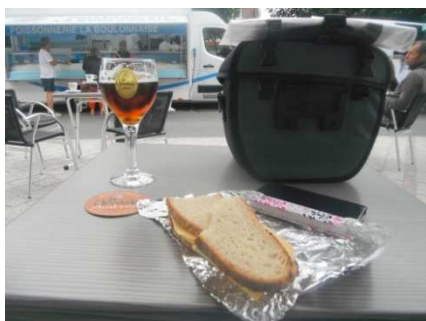
3 Arrêt casse-croûte du midi