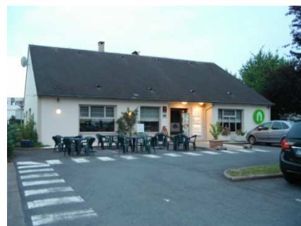
5 Repas et repos au Campanile