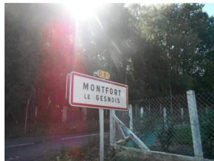
18 Monfort le Genois... Castastrophe