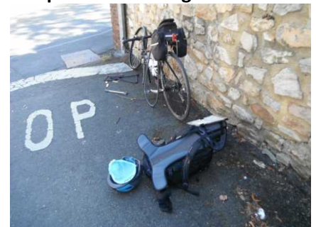
19 Crevaison, pneu foutu. A l'ouvrage