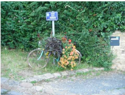
14 Vélo camouflage