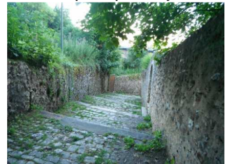
16 A pied dans ces longues ruelles