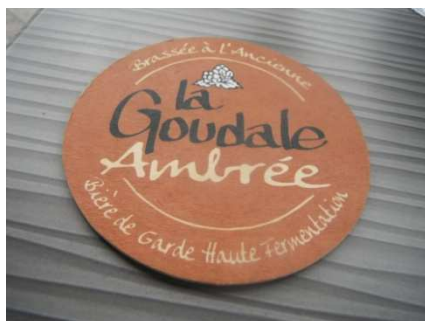
4 Bière blonde, ambrée, ou dorée, 7,2° La Goulade ... un délice !