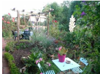
11 Jardin et terrasse