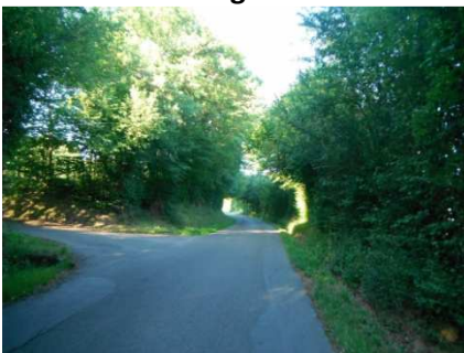
17 Ouf enfin je retrouve mes pédales