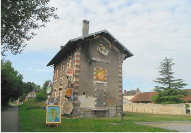
8 Petite gare du temps jadis