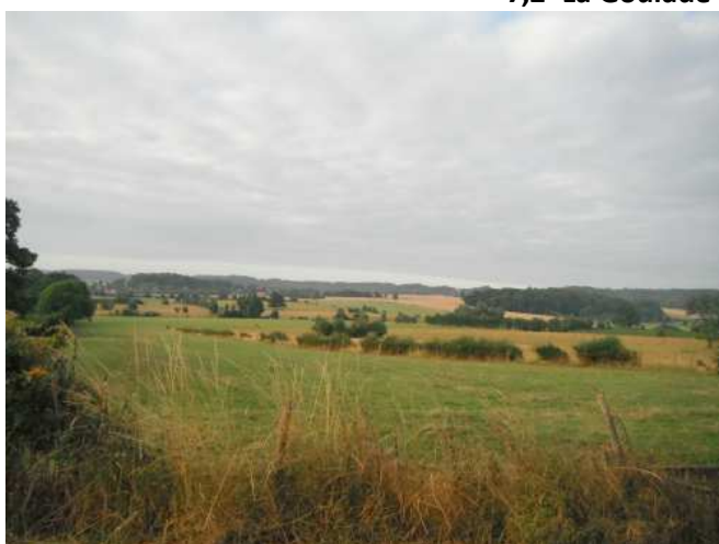
6 Paysage magnifique de la France profonde