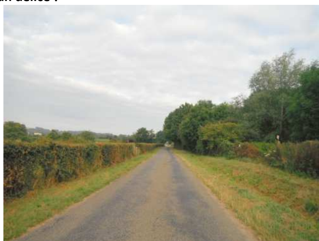
7 Petites routes tranquilles. Que demander de plus ?