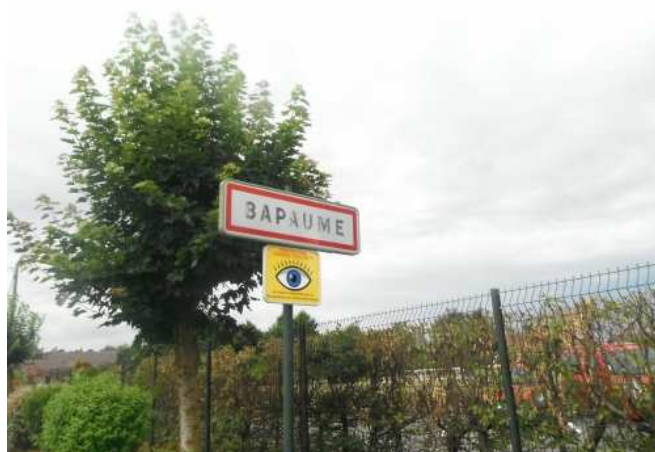
2 Bapaume, 1 er arrêt bien connu lors des "Poilus" BRM et autres sorties