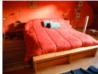
12 Un bon lit pour la suite