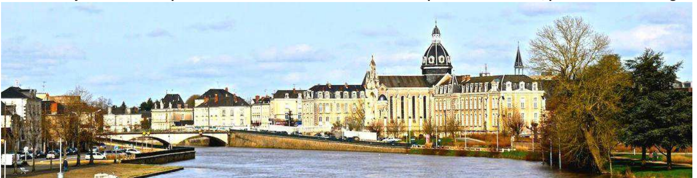
20 Château-Gontier, commune française, située dans le département de la Mayenne, et ses 11 528 habitants