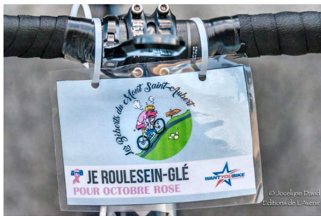
02) La plaque de cadre des Béberts du Mont St Aubert