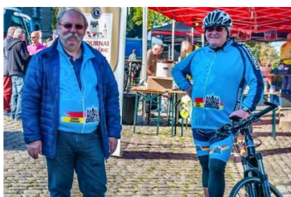
18) Moustache et Dédé en renfort