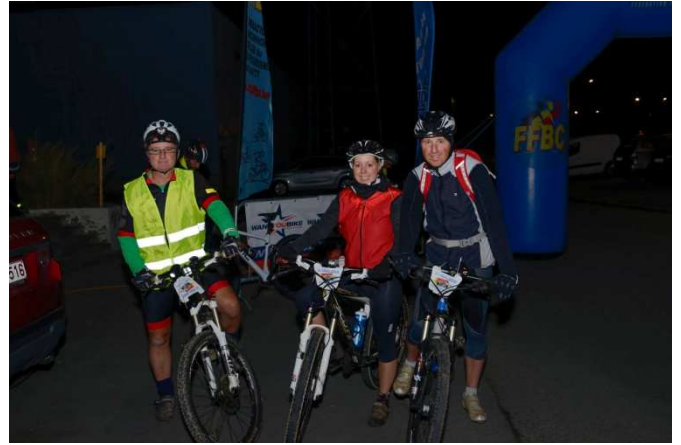
6 C'est parti, reste plus qu'à allumer les lanternes