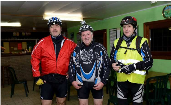
7 Déjà tout sourire au départ sans compter la suite