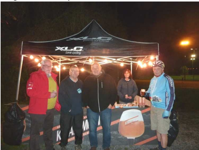
11 Ravito surprise, les Hautes instances contrôlent