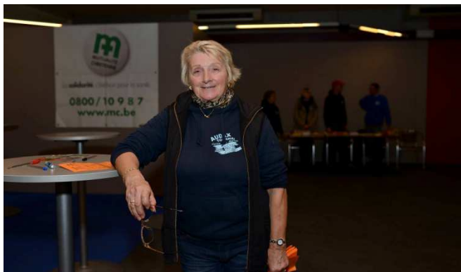
3 Marraine fidèle au poste attend les couillons