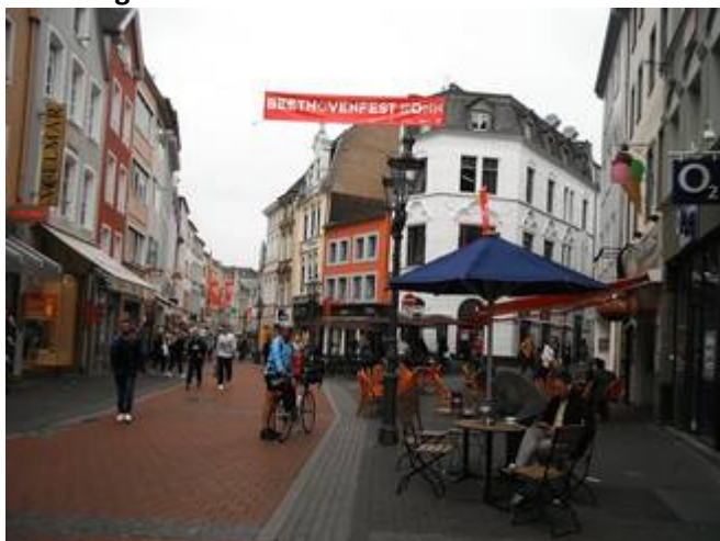
14 Bonn ville touristique aux multiples terrasses