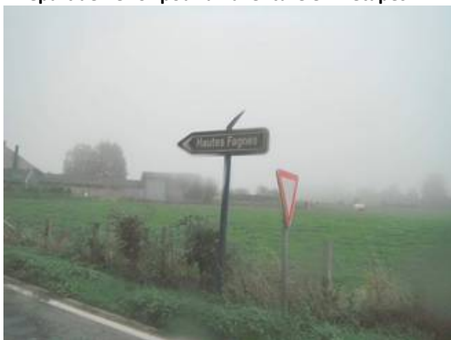
3 Direction en suite les Hautes Fagnes