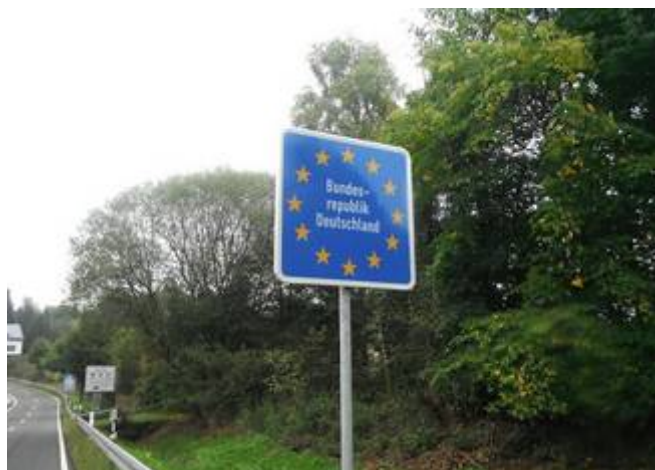
8 Entrée en Allemagne. Direction Berlin