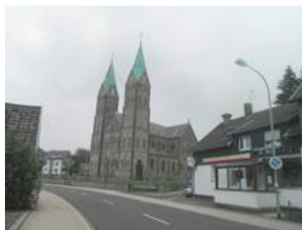
10 Routes parfaites