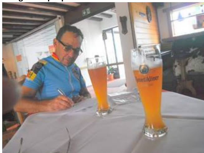
15 La Weissbier nous change de l'eau des bidons