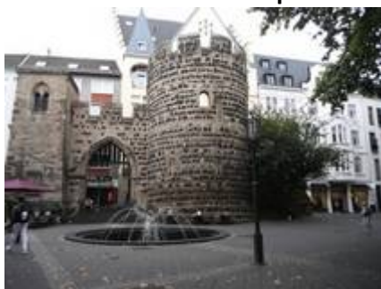
9 Visite de Bonn