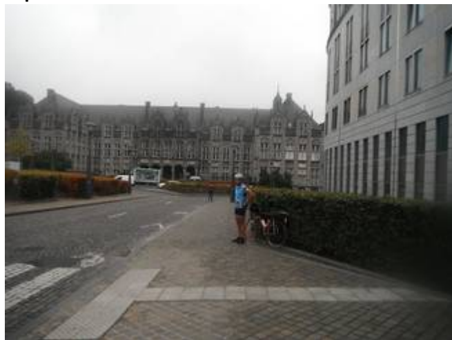
2 Passage obligé devant le Palais des Princes Evêques