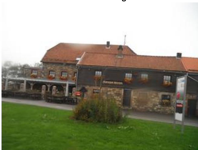
5 1 er arrêt à Jalhay