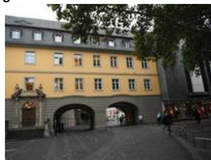
11 Batiment superbe