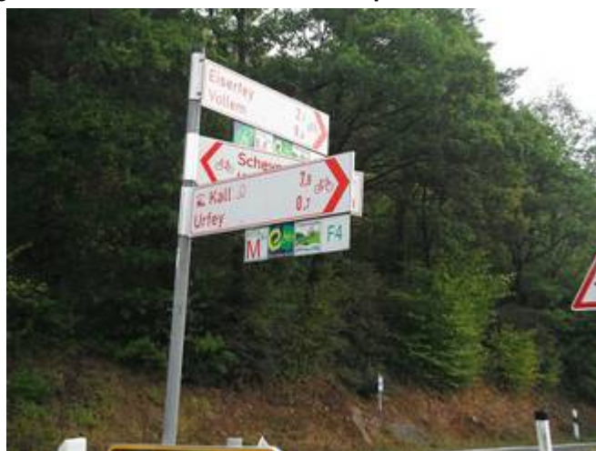
13 Signalétique parfaite