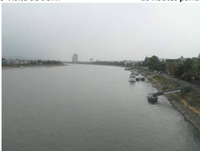
12 Passage du Rhin