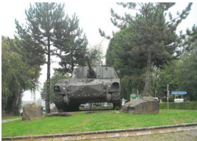
7 La route traverse le camp d'Elsenborn.