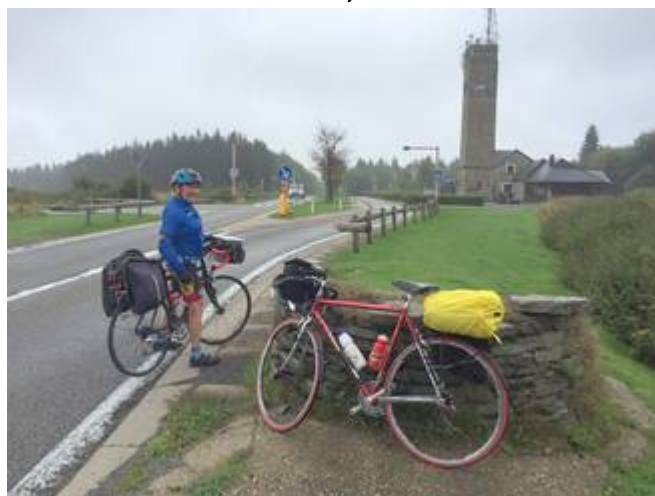
6 Le signal de Botrange et ses 694 m