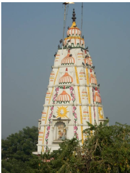
18 Les temples hindous sont partout, en ville, en pleine campagne