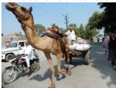
5 surprise : les dromadaires sont attelés comme les buffles