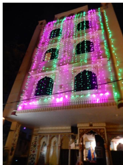
20 L'hôtel est enluminé comme presque tous les bâtiments de la ville pour le Diwali, la fête de la nouvelle