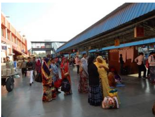
3 puis au train pour découvrir un pays de forts/palais, temples, mobylettes, échoppes, petits métiers. Un monde bien différent du nôtre.