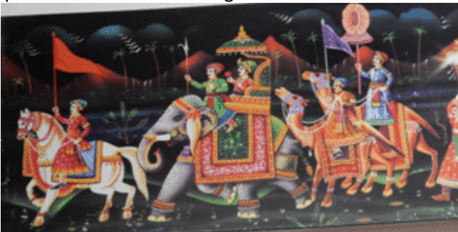
13 Parmi toutes les fresques décorant les palais : l'éléphant qui représente la chance, le cheval la force et le dromadaire l'amour. Les fresques décorent partout, palais, hôtels, murs dans les rues