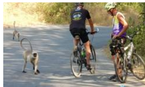
7 Georges, Il ne te veut pas du bien ! Les singes sont partout, et n'ont rien d'amical, ils peuvent montrer de fameux crocs