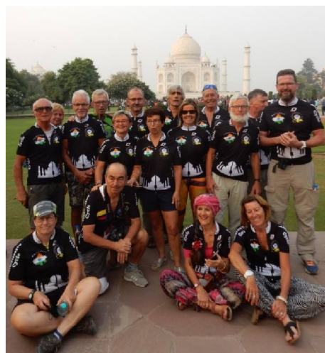
22 Le groupe, avec le maillot Taj Mahal de rigueur devant le monument classé "Merveille du monde". Aussi impressionnant que l'indiquent les agences de voyages