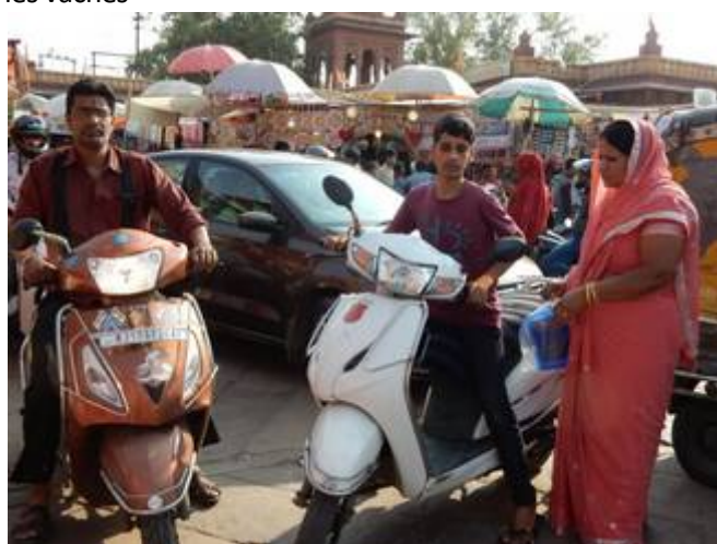
4 l'Inde moderne avec ses mobylettes omniprésentes et klaxonnantes