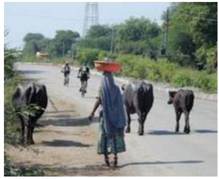
8 " Malin comme un singe » » 9 Rencontre tuk-tuk, chiens et 10 A gauche, à droite, au milieu ? A chaque dit-on et ... curieux aussi ! mobylettes en pleine campagne, approche de village, des champs, des les chiens aussi sont partout vaches, des buffles qui vont tranquilles