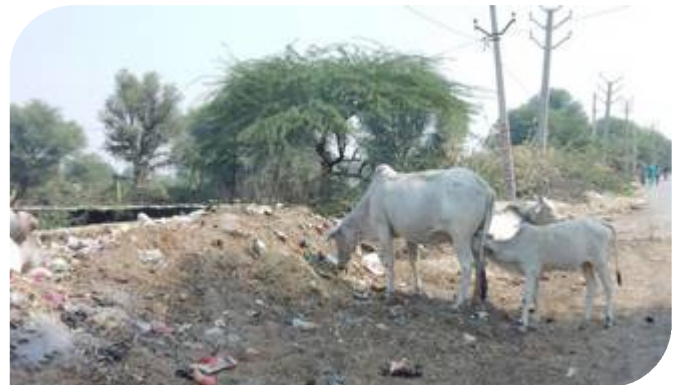
14 Plus facile pour un veau de se nourrir que pour sa mère