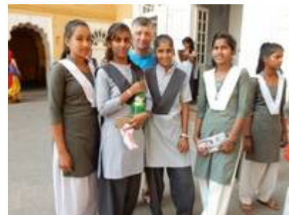
17 Tandis que d'autres, en bel uniformes, sont touristes