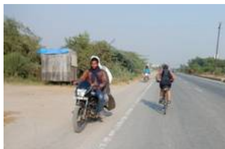
6 on roule à gauche... en principe, les contre- vous font rester toujours attentifs