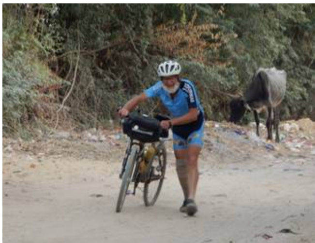
23 Progression difficile et pour cause sable mou, animaux en total liberté