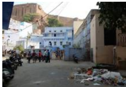
16 Au pied du château, deux jeunes, fouillent les poubelles