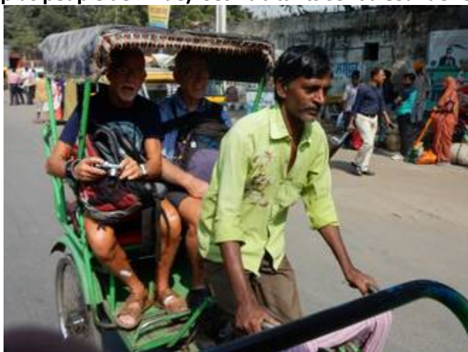
1 de l'avion on passe au tuk-tuk à pédales, à moteur qui se faufilent dans une circulation intense

Le Rajasthan est un état indien séparé du Pakistan par le désert du Thar. L'Inde fut sous protectorat britannique en 1858 et devint indépendante en 1947. Le Rajasthan ("pays des rois") a une superficie d'environ onze fois la Belgique, un dixième de l'Inde, et une population de 69.000.000 habitants (7 ème le plus peuplé de l'Inde). Ses habitants sont à 89% de religion hindoue, 9% musulmans, 1% Sikhs et 1% Jaïns