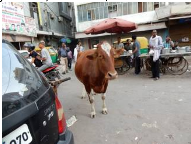
2 Sortie du très moderne aéroport de New-Delhi et après 3/4h de circulation intense Delhi avec la foule, l'animation, les vaches