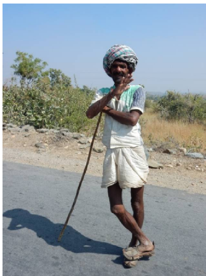
19 La couleur du turban indique le métier et/ou la caste. L'un de nos guides de visite, âgé de quelque 40 ans, nous disait s'être marié hors de sa caste