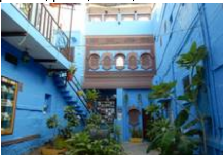
15 La cour de l'hôtel à Jodpur, la ville bleue