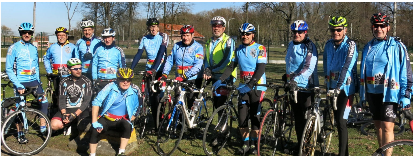
03) Groupe Audax Tournai au rendez-vous de 13h avant de se répartir librement sur 35/55 ou 75 km.