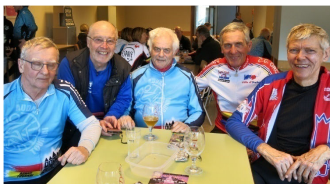
13) Prolongation franco-belge de grands voyageurs.