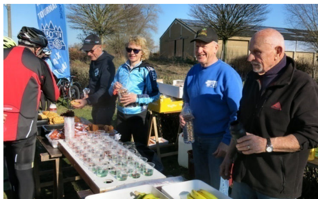
08) Direction JClaude et service des « Audax locaux »