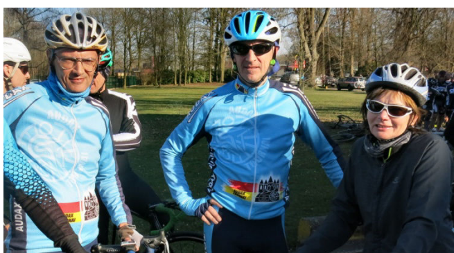
12) Du pas lourd mais du costaud chez les Audax.