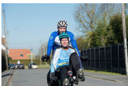
17) Tandem Audax-Bol d'Air.