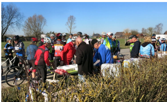
07) Après Nomain (F) ravito 55/75 à La Glanerie (B).