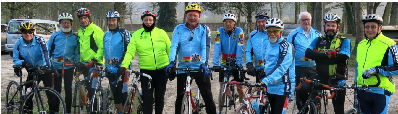
07) Le groupe Audax des participants à la 53 e Forêt de Raismes partant à 8h pour le 60 ou le 75 km.