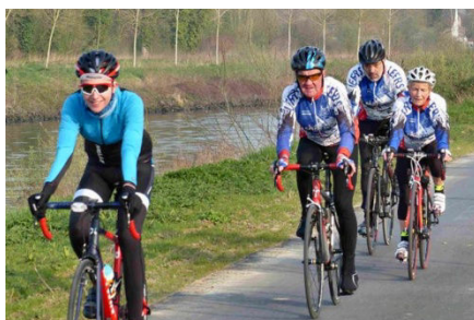
11) De Leers (F) 13 cyclos inscrits.