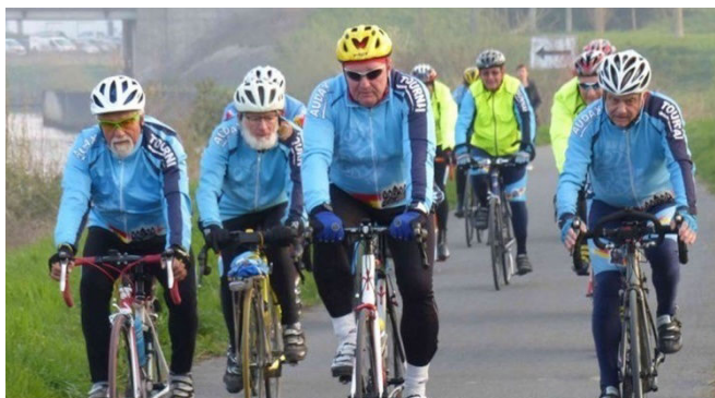
08) Chemin de halage longeant l'Escaut après Antoing