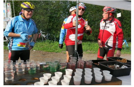
20) Bonne humeur inter-clubs autour d'une bonne table copieuse