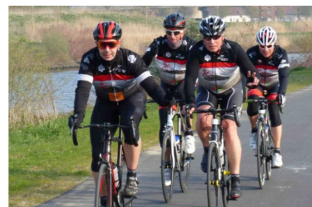
12) Les mordus de Wiers seront 18.