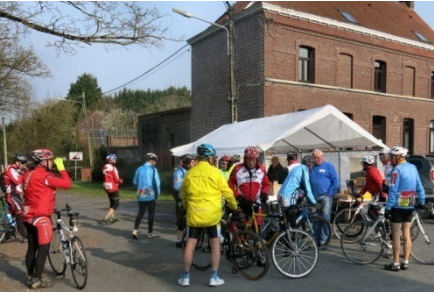
18) Ravito pour tous, y compris le 30 km à Maubray, vieux canal.