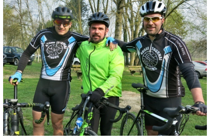
22) La jeunesse bikeuse des Audax Tournai qui ne dédaigne pas de se tester aussi sur route.