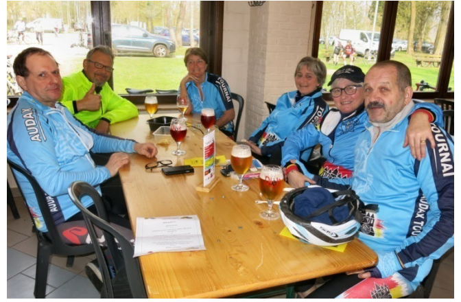
24) Et de se refaire une santé autour d'un verre.