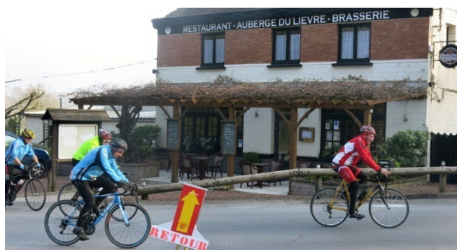
17) Avec le bon accueil de l'Auberge du Lièvre.