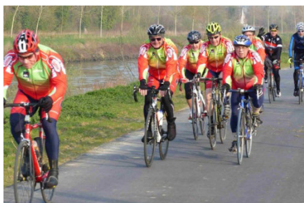
10) D'Estaimbourg 9 cyclos inscrits.