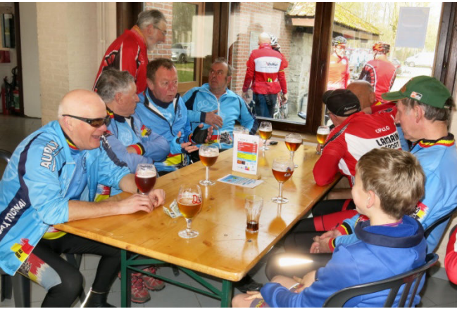
23) A l'arrêt des vélos, moment de refaire la course.