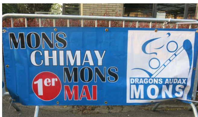
1) Lancé en 1972, le MCM a connu un bel essor du fait de son parcours et de sa destination. Le dynamisme des Montois a fait le reste du succès car tant pis si le fléchage et les ravitos y sont « légers ».

Brevet de grande tradition que le Mons Chimay Mons des Dragons Audax Mons (DAM) qui, toujours le 1 er mai, avait réuni 1800 cyclos venus de Wallonie, des Flandres et des Hauts de France. D'après les photos de l'organisation que nous replaçons ici, au moins 5 Audax Tournai se sont retrouvés dans ce grand rendez-vous cyclo où, jadis (!), notre club fut le plus nombreux avec plus de 40 inscrits. Si les parcours de MCM sont forcément beaux et costauds on pouvait choisir sa distance tout un profitant du beau temps et d'une organisation très « montoise ». C'est-à-dire joyeuse et légère !