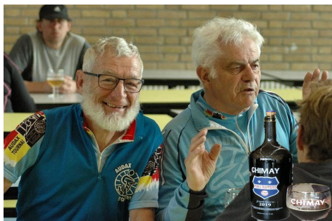
6) Pour profiter de MCM il faut disposer de la journée et... apprécier les spécialités locales.