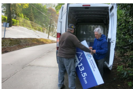
51) Le lendemain deux équipes