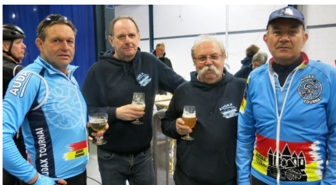
49) L'organisateur Moustache peut se désaltérer.