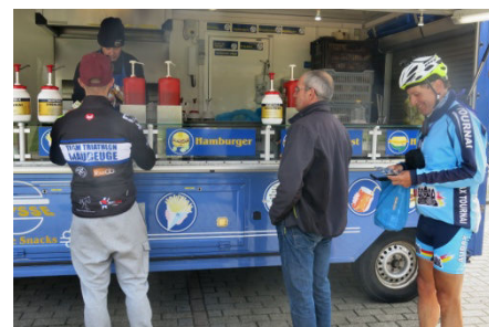
46) Une frite pour se remonter ?