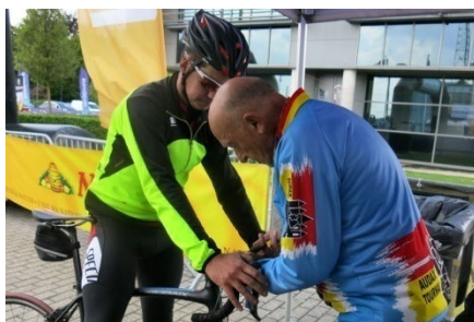
35) Libération de plaque de cadre.