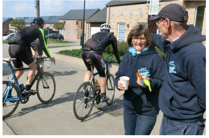
26) Sous le contrôle de ravitailleurs se ravitaillant. La journée est longue à ce poste de service.