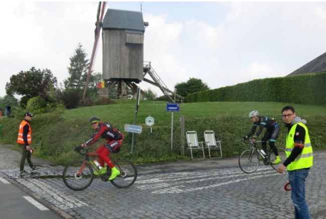
27) Implication exemplaire des signaleurs Audax. Au moulin du Cat Sauvage la mission est périlleuse.