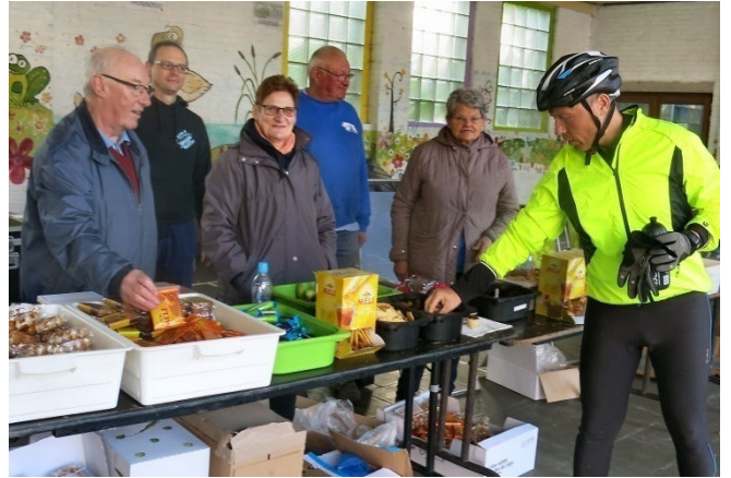
17) Ravito placé sous abri qui se mettra en plein air après 9h, tant pour le liquide que le solide.