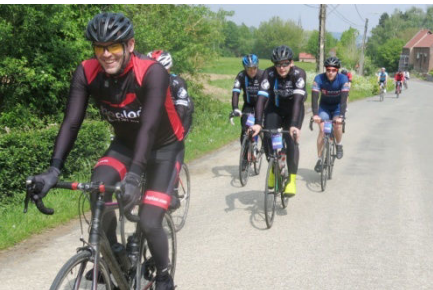
29) La Croisette à Saint Sauveur.