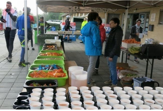
25) Ravito à Flobecq pour les plus longues distances. Fameuse pédalée de 145 ou 175 km de Monts.