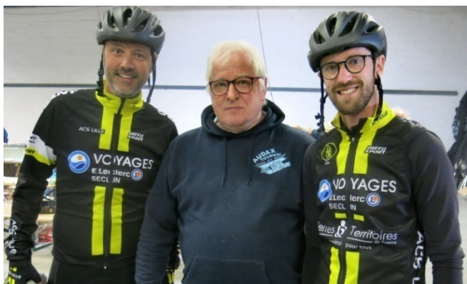
42) Le président au service d'accueil des cyclos.