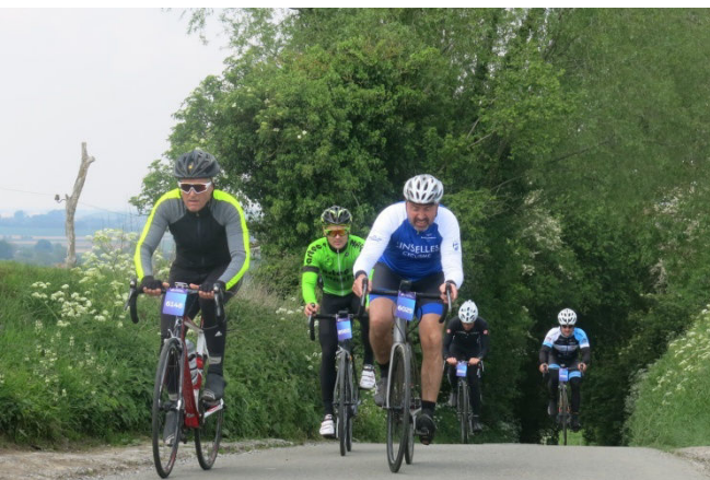
32) Sur le retour pour tous la montée du Trou Robin est une épreuve courte mais redoutable.