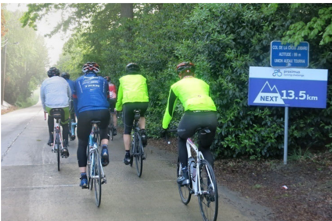
12) Passage au col vers la côte des Trieux à 13,5 km. Ce panneau fait partie du charme de la Grinta !