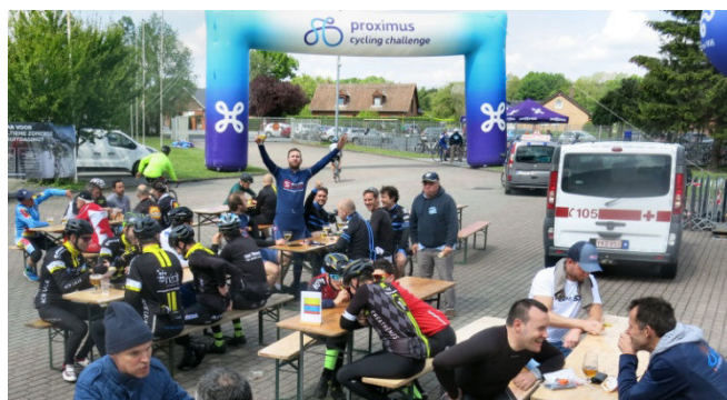
50) Ambiance festive en terrasse, sous le soleil.