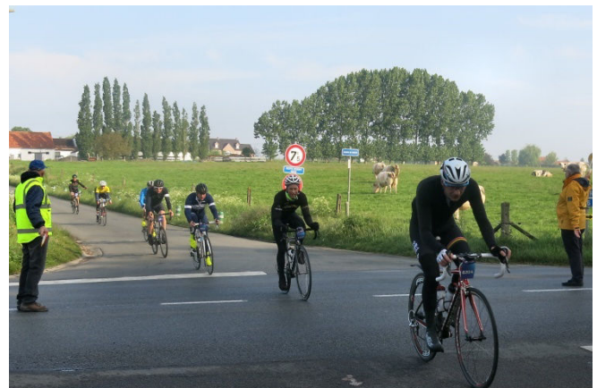
13) Signaleurs en poste pour la chaussée de Renaix. Cette présence de bénévoles fait partie de l'accueil.