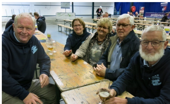
43) L'équipe relations publiques au service des VIP.