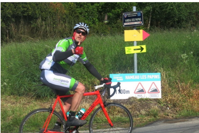
23) Au pied des Papins, c'est parti pour 1100m à 7,5%