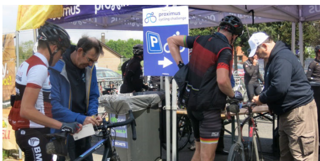
47) Fameux service de gardiennage des vélos.