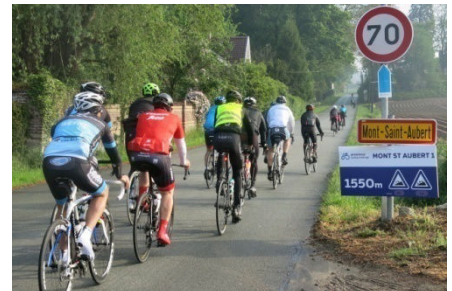
11) Mt St Aubert via le col Jubaru.