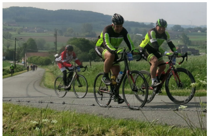
24) Montée des Papins plus dure côte de la Grinta !