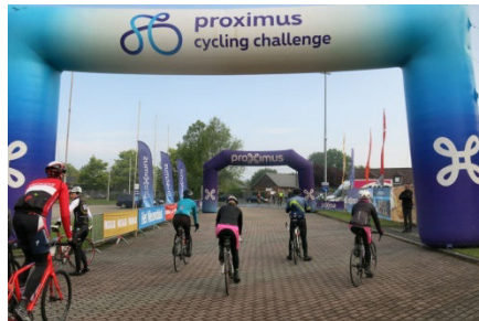
10) Grand décorum du Challenge.