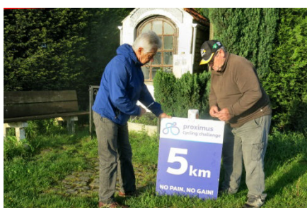
52) s'occuperont de tout démonter