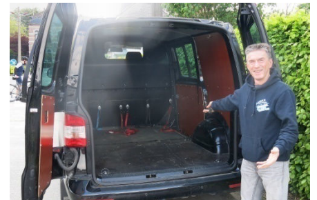
31) Assistance rapatriement gratuit