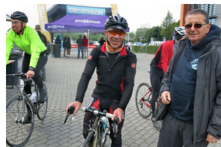
36) Satisfaction 1500 fois répétée.