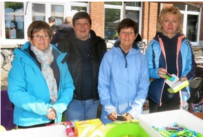
18) Pose photo le temps d'une accalmie dans la tâche de réassortiment des biscuits, gaufres et fruits.