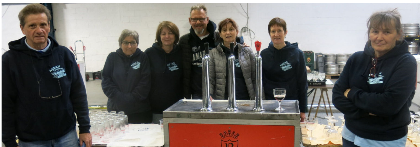
37) Une partie de l'équipe mobilisée pour le service du bar : opération accueil et écoulement de la Tournay !