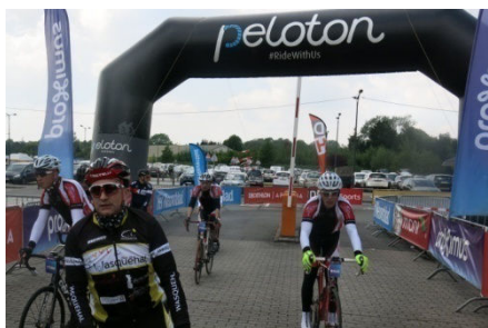
34) Arrivée devant Tournai-Expo.