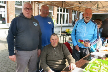
20) Encouragement du président Jozef Tomme venu saluer la troupe