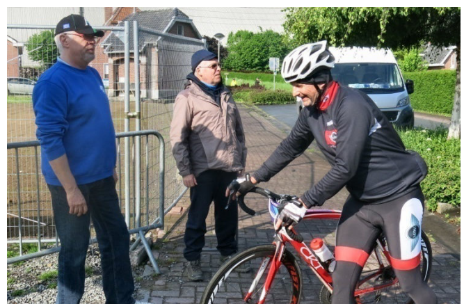
15) Entrée au ravito de Frasnes (AR) sous contrôle.