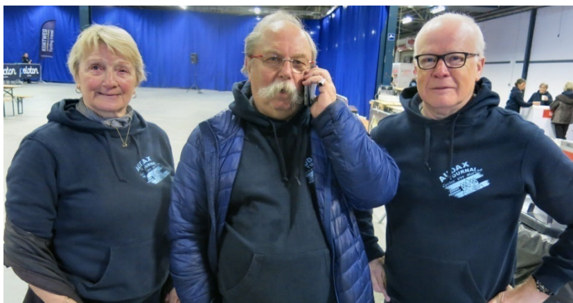
06a) Le grand ordonnateur entouré de ses deux bras, droit ou gauche.