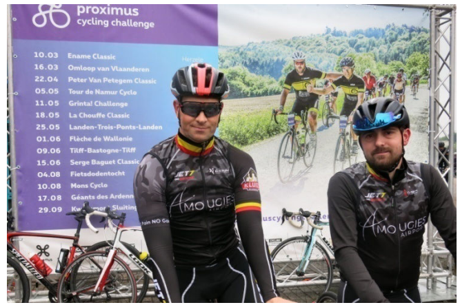
08) Parmi les rares régionaux deux costauds d'Amougies. Il faut dire que le parcours et les 15€ décourageant les adeptes des « Picardes ».