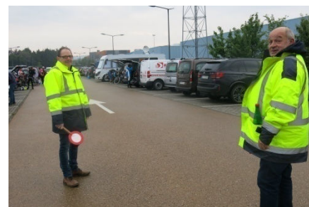
05) Beauf au rangement parking.