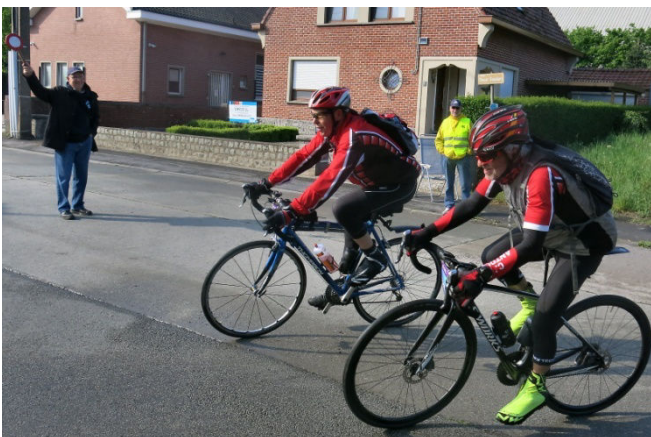
14) Cyclos d'Antoing toujours présents à la Grinta !