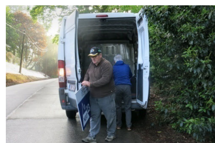
53) ... et de tout remballer !