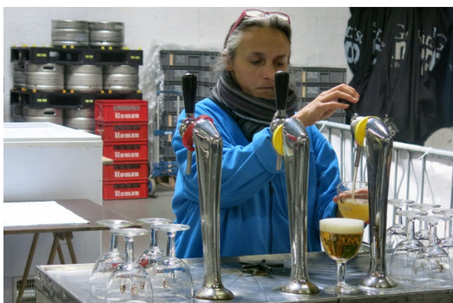
40) Un remplissage selon les règles de l'art.