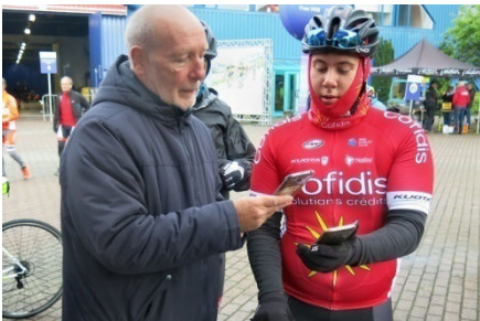
09) Départ rapide des pré-inscrits.