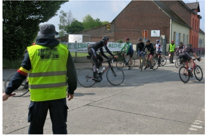
28) Cela se corse à Saint Sauveur quand des cyclos se croisent au pied de la rue des Monts.