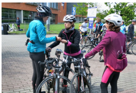
45) La Grinta ! s'est bien terminée.