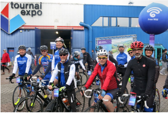
07) Affluence limitée de 1500 cyclos à Tournai-Expo. Annonce de mauvaise météo et concurrence de nombreuses organisations sont en cause.