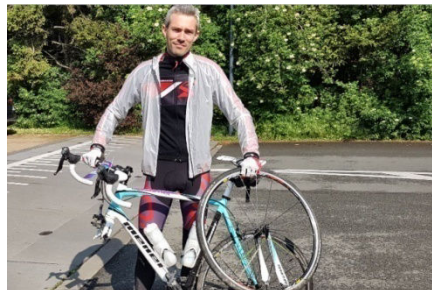
30) La malchance d'une roue voilée