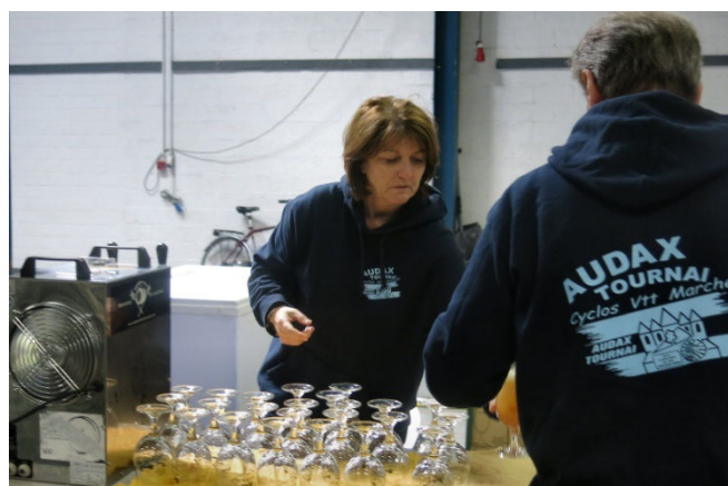
41) Un service ininterrompu... jusqu'à plus soif.