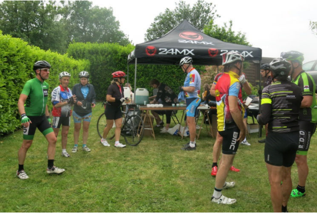
08) A Forest le poste de ravitaillement pour tous.