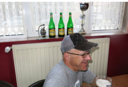
15) Trois Moinettes au palmarès.