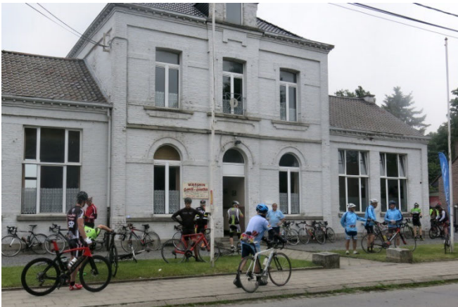
01) 250 cyclos dont 37 Audax devant le local Warchin