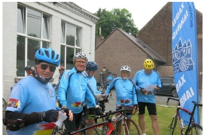
04) Groupe au départ de 13h pour le 73 km.