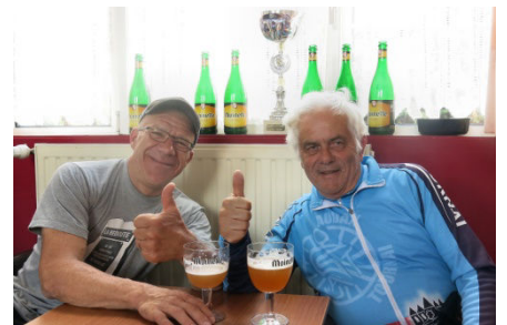
17) A deux bien plus de Moinettes.