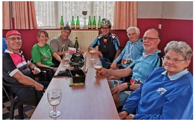
14) Tableée en attente du retour des randonneurs.