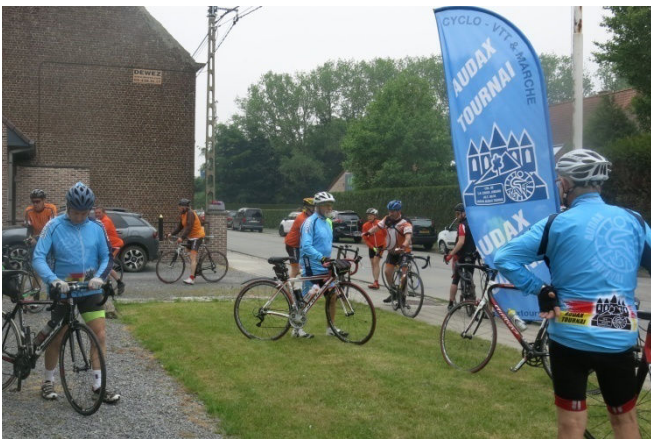
03) Ralliement sous le panache bleu Audax Tournai.