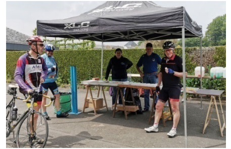
12) Ravito costaud à Oeudeghien.