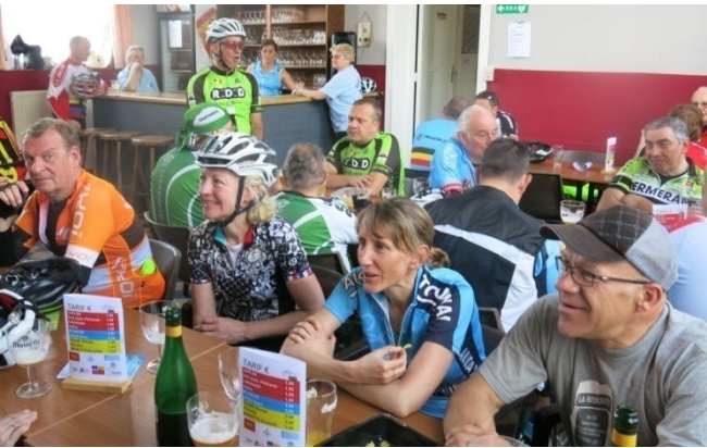
13) Retour au local pour ceux du 40/73/115 km.