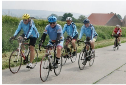
11) Groupe Audax sur les hauteurs.