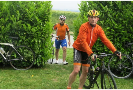
10) L'entrée dans le jardin privé.