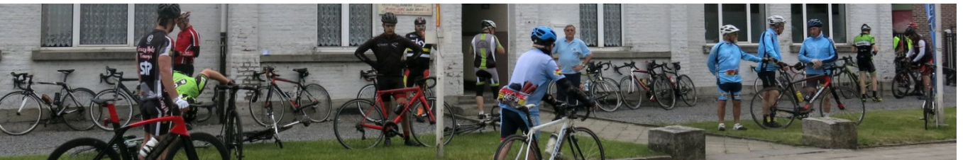
18) Une bonne organisation Audax Tournai pour préparer les prochaines belles aventures lointaines de l'été.