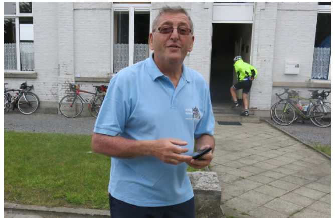
02) Daniel Houtekins pour les parcours et fléchage.