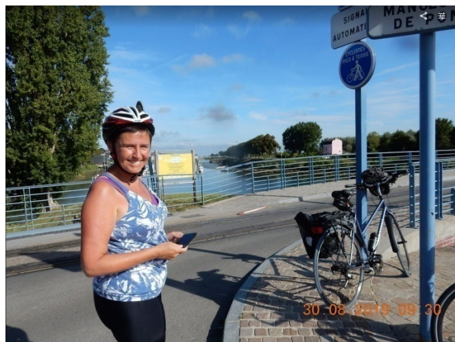
Petite pause sourire le long du canal