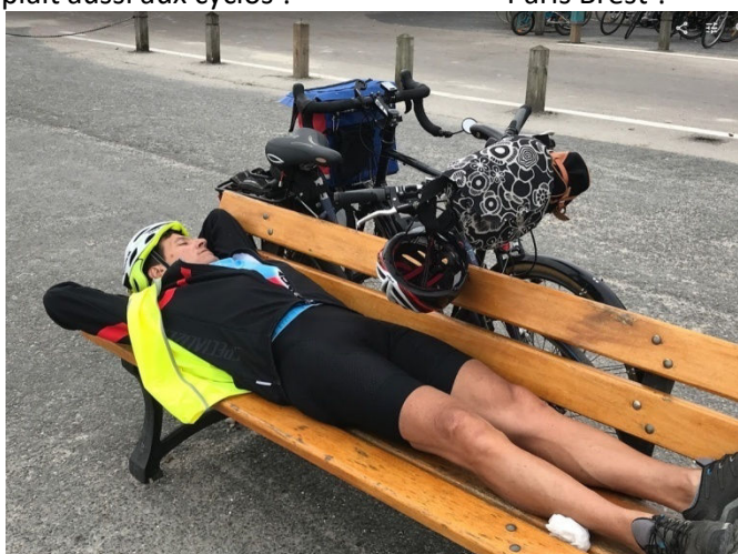
Une petite sieste pour digérer ces bananas split ne sera pas surperflue avant de rentrer vers notre superbe hôtel