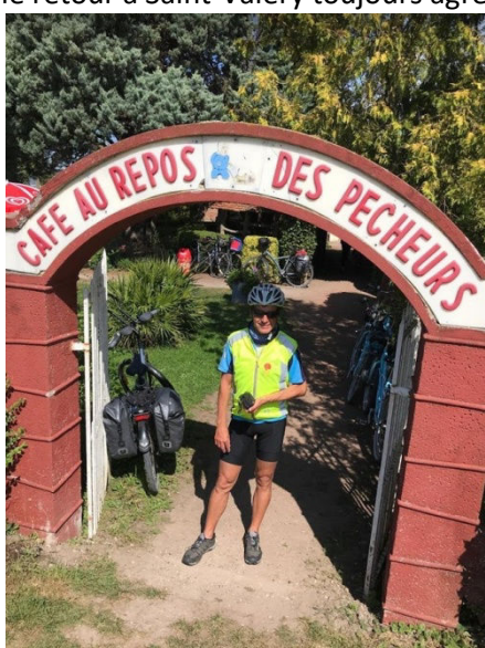
Repos des Pêcheurs convient et plait aussi aux cyclos !