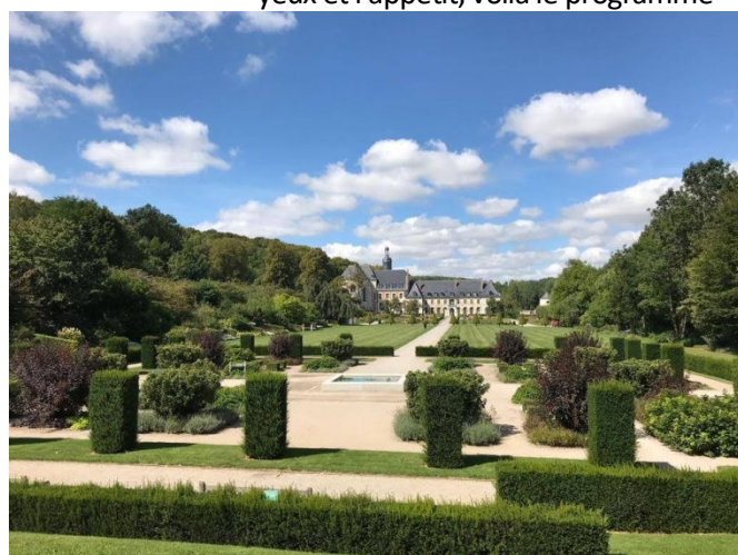
Les Jardins de Valloires du côté de Argoules. Arriver aux 8 hectares et aux 5 jardins d'ambiance se mérite : des petites montées, du vent, les points de vue sur la Somme, et toujours le soleil

Un total de 270 km ! Très beau voyage avec mon grand amour Véronique!