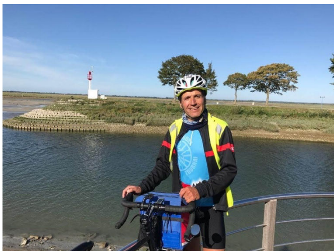
Vers Abbeville le long du canal, un peu de bosse pour le retour à Saint-Valery toujours agréable