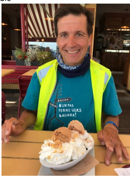
Combien de banana split pour un Paris Brest ?