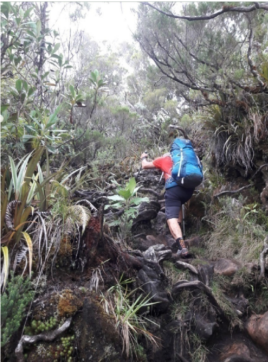
7 Interminable ascension vers le refuge du Piton des Neiges