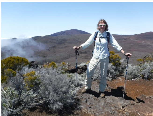
9 Chri Chri à la plaine des sables et du Piton de la Fournaise