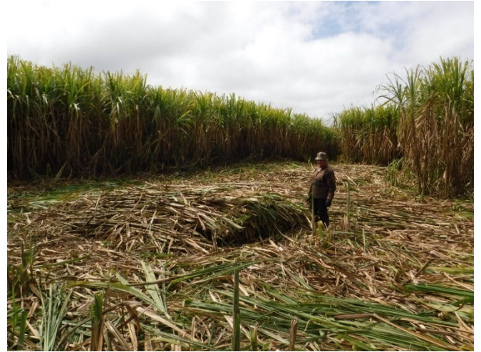
6 Coupe manuelle de la canne à sucre