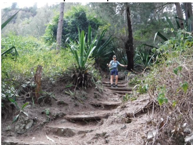
3 Sentier technique