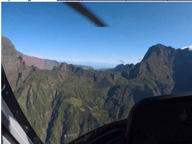
1 Survol en hélicoptère du cirque de Salazie

Reportage sur : https://chouchouetphilou.wordpress.com/