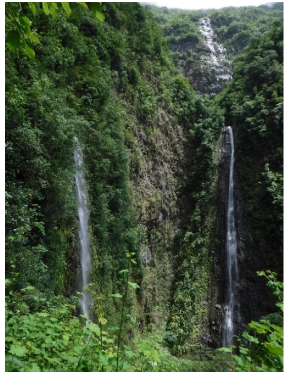
8 Une des innombrables cascades