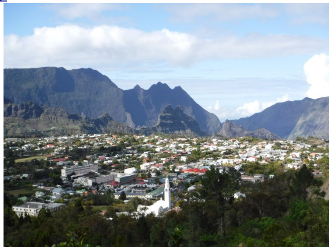
2 Cirque de Cilaos