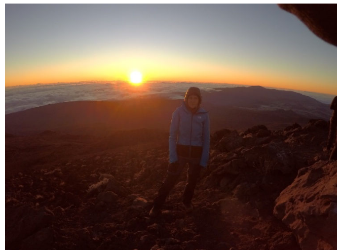
10 Lever du soleil au Piton des Neiges