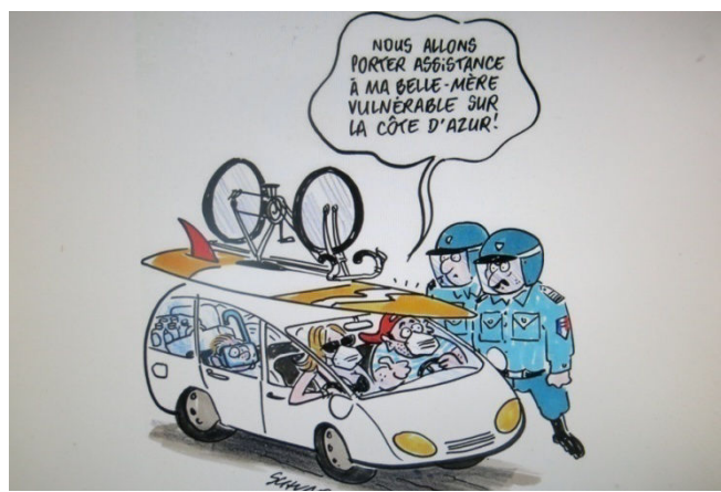
06) Resquille française, parfois pour venir en Belgique