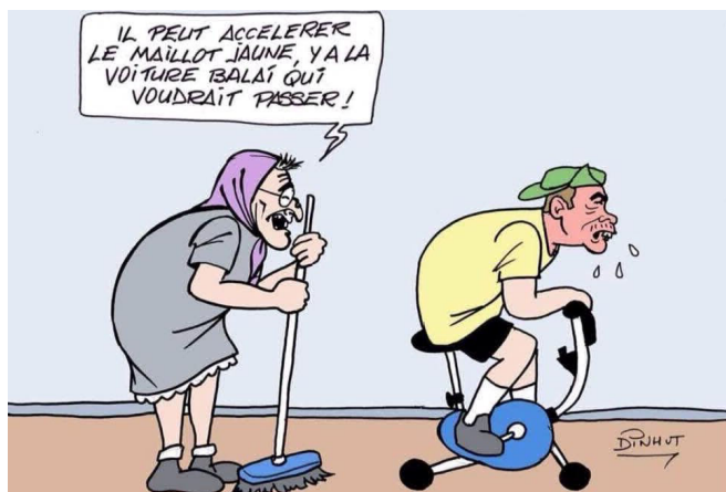
05) Surtout en France, condamnation home-trainer !