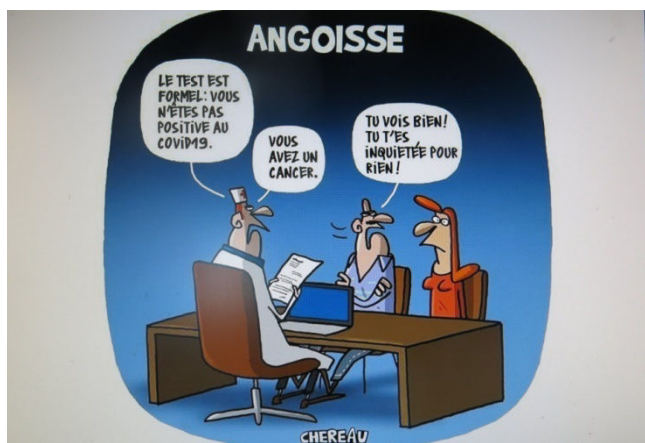
07) Chez certains l'angoisse irraisonnée du Covid 19 fut telle qu'on en oubliait tout le reste.