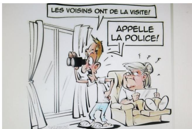
14) Les stigmatisés s'en sont donné à cœur joie !.