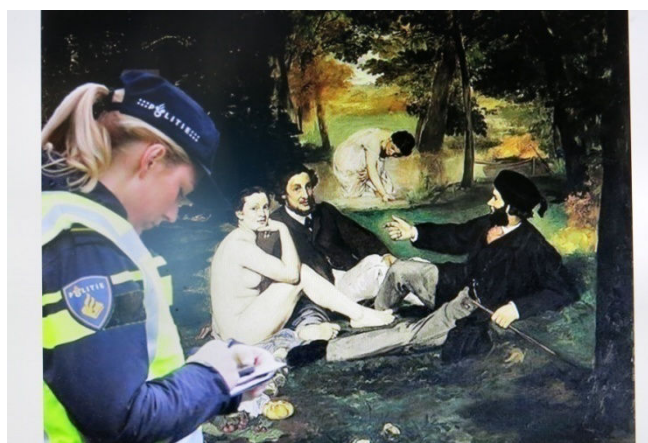
08) Le discernement policier fut forcément inégal mais la population ne se plaignit même pas.