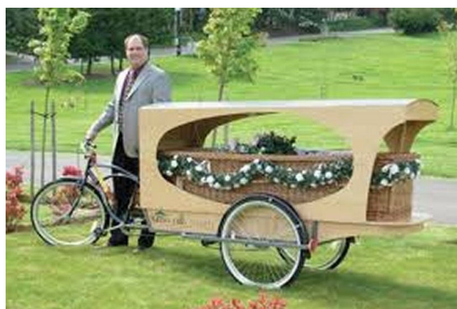
02) Quand le cyclo préparait son dernier voyage ?