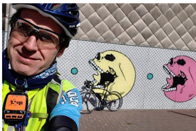
01) Tout l'art fut de rouler plus vite que le virus !

Le brutal « confinement » du 14 mars 2020, de sinistre mémoire, a été suivi d'une longue et lente période de « déconfinement » à partir du 4 mai. Avec des interdits pour les rassemblements, qui furent annulés, tant religieux, sportifs, scolaires, professionnels que... familiaux. Cette pénible situation donna cependant quelques idées lumineuses aux humoristes. Il y eut donc de quoi rire... jaune ! Voici une petite sélection de blagues pour jouer au con... finement.