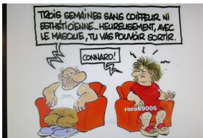
15) Vive la fin du virus et la paix des ménages !