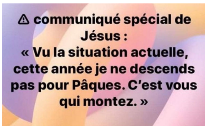
03) Fêtes de Pâques 2020 complètement perturbées.