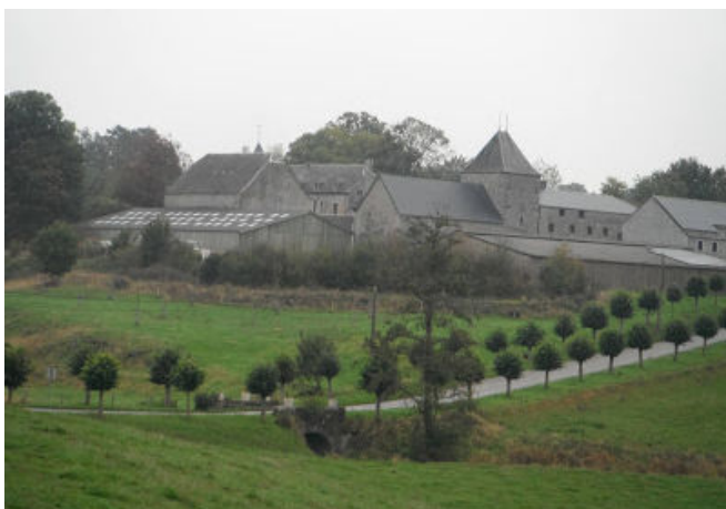
3 Belles routes et belles fermes namuroises