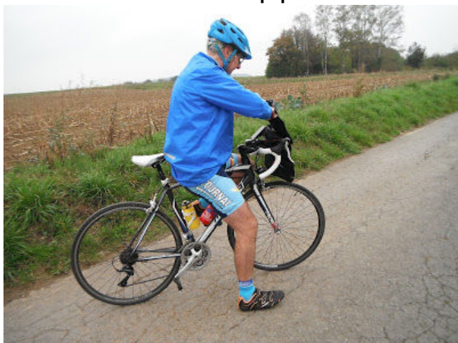
11 Un p'tit creux ... vite fait dans la musette