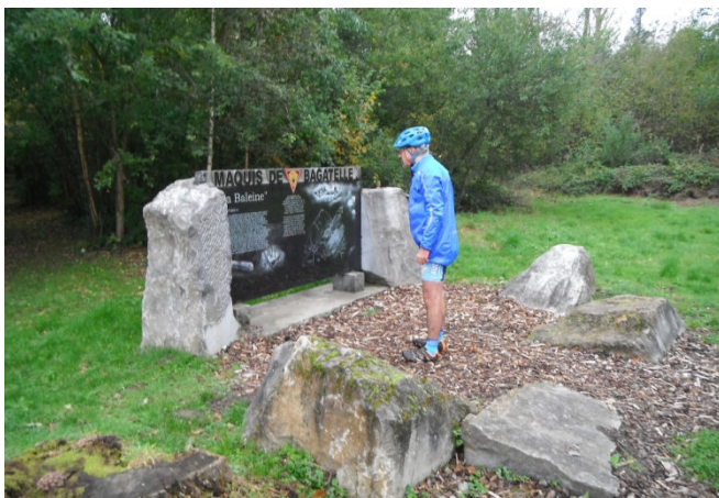
5 Passage et instruction sur monument du Maquis de Bagatelle