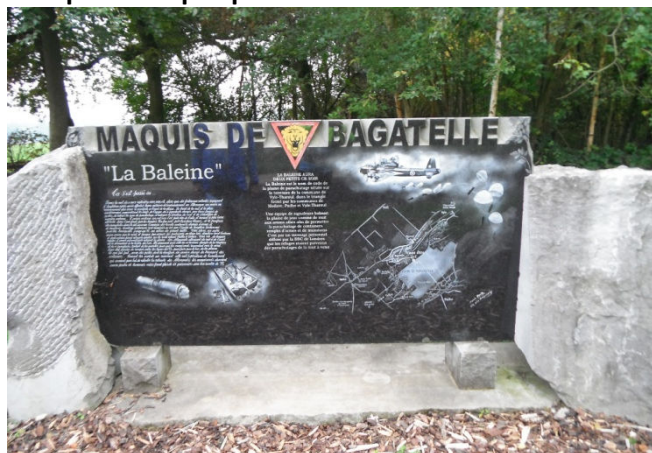
6 "La Baleine aura deux petits ce soir !" Nom de code de la plaine de parachutage située sur le territoire de la commune de Vyle-Tharoul, dans le triangle formé par les communes de Modave-Pailhe et Vyle-Tharoul