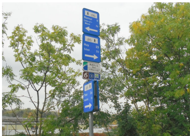
8 Très beau balisage du parcours