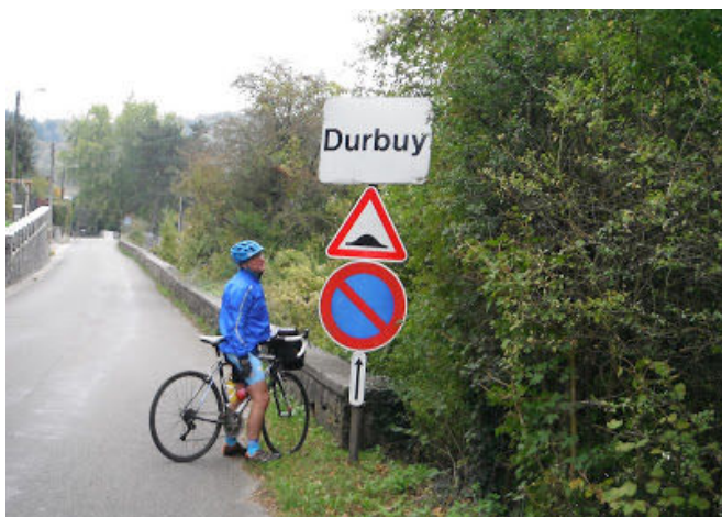
7 Durbuy en vue