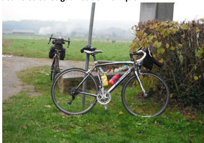
4 Un peu de repos pour nos deux montures