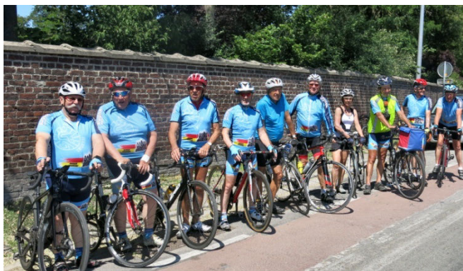
17) Le groupe du samedi 30 mai 13h30 Verte Feuille.