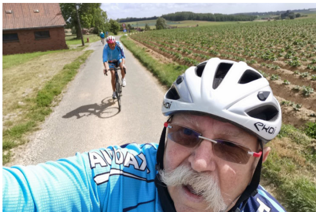
09) Moustache s'entraîne au selfie en roulant.