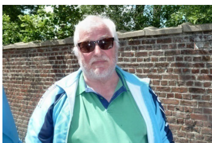
06) Vivement le retour du groupe.