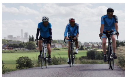
14) Bien en selle à Gaurain Rx.