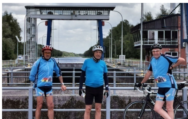
12) Respect de la distanciation à l'écluse de Péronne selon les directives anti-coronavirus Covid 19.