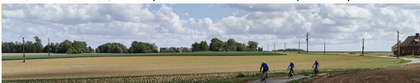
16) Agréable parcours de 55 km à travers les champs cultivés de Wallonie Picarde en attendant les pelotons.