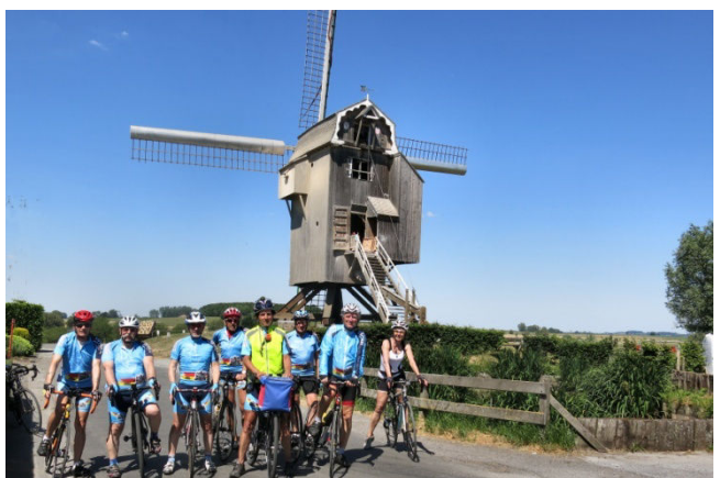
22) Arrêt pose touristique au moulin de Moulbaix.