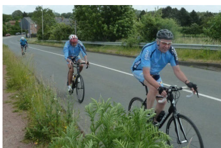
05) Bonne distanciation à Warchin.