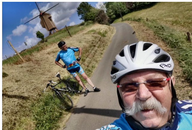
10) Puis en s'arrêtant en des lieux remarquables.