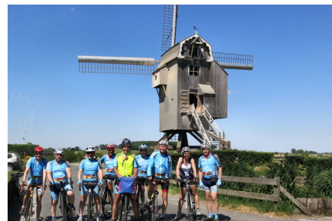
23) Les mêmes et, en plus, le photographe du jour.