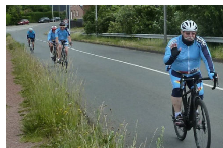
07) Moustache a le parcours GPS.