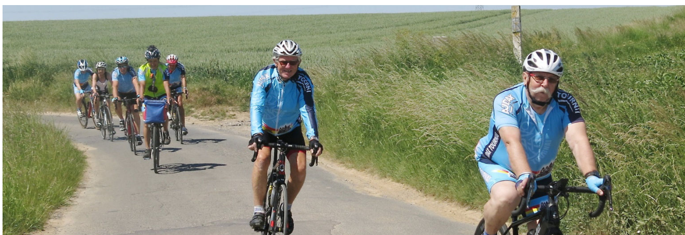
19) Beau temps ensoleillé, mais venteux à l'aller pour 68 km vers Ligne, Moulbaix, Tongre ND et Beloeil. Véritable sortie de retrouvailles déconfinement en ce premier jour de week end de Pentecôte. Ici Ligne.