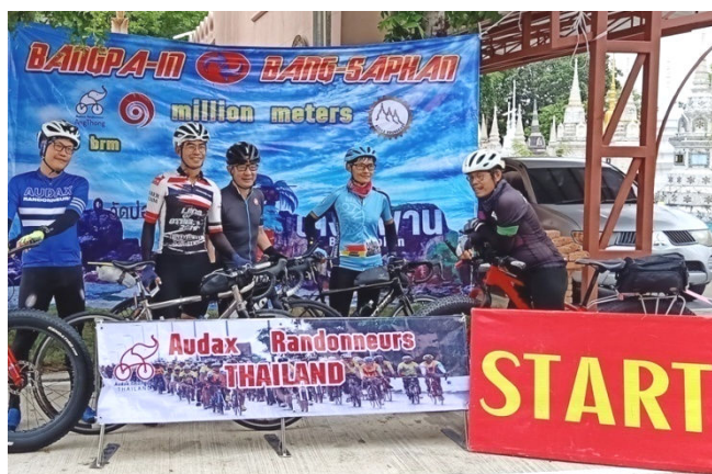
2) Départ grandiose d'un BRM en Thaïlande pour un éléphanthesque million de mètres ou... 100 km.