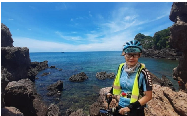
6) Parcours thai vers le sud du pays en longeant le Golfe de Thaïlande. Parcours facile mais... long, venteux à l'aller, chaleur tropicale et 3 jours+2 nuits.