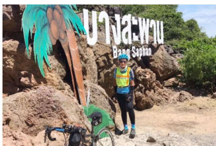
4) Demi-tour au site Bang Saphan.