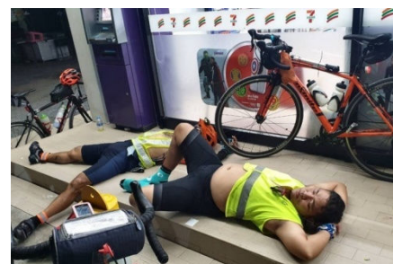
5) Effets du vent, chaleur et nuits !