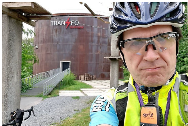
02) A Zwevegem, nouveau centre de plongée Transfo Duiktank dans d'anciennes cuves de mazout.