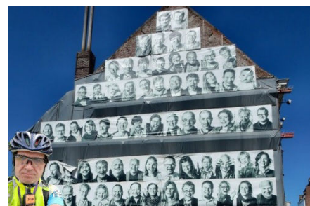
05) A Courtrai face au pont Buda.