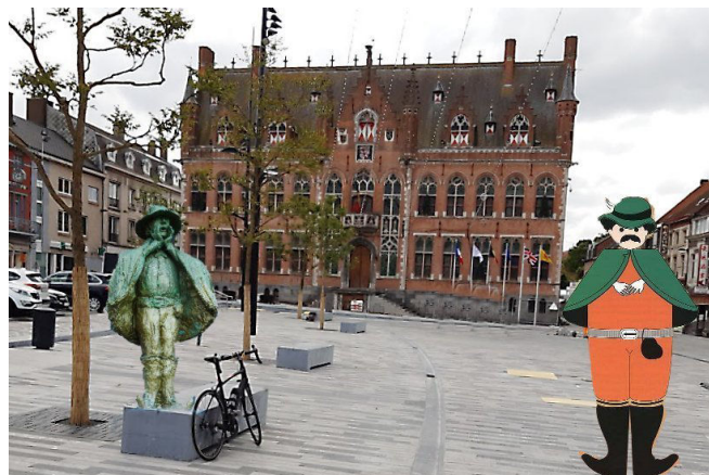
07) Alors c'est retour sur la grand place, joliment restaurée, de Mouscron où les Hurlus sont de sortie.