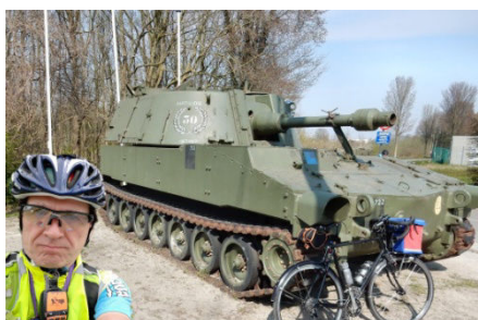
03) Bataille de la Lys à Ooigem.