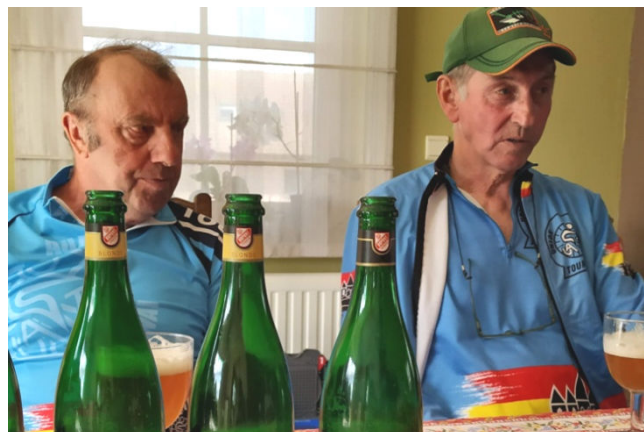
2) A Leuze et à Chapelle à Wattines on n'en a que des grandes dont on verra bientôt l'étiquette.