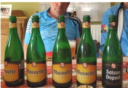
7) Ne dites pas à un Leuzois que la Moinette n'est pas aussi de Saison. A partager de manière raisonnable