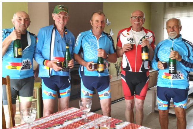
1) A la santé du virus évité mais pas à coup de Corona pour boucler la sortie des amis déconfinés.