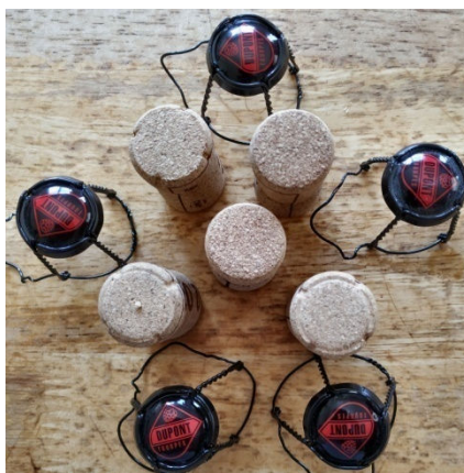
4) Sortez les couverts de Moinette