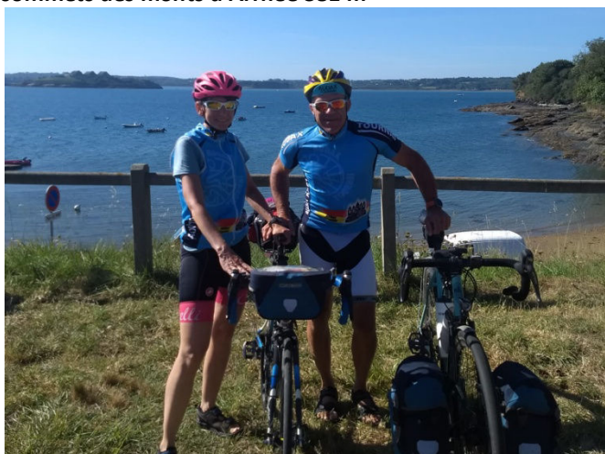
15 Vous remarquerez, qui porte les bagages...