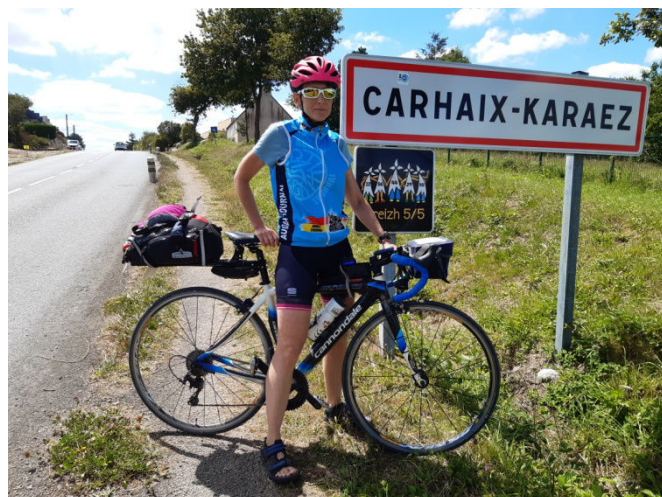
16 Hommage à PBP