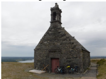
12 St Michel de Braparts, 1 des plus sommets des monts d'Arrhée 381 m