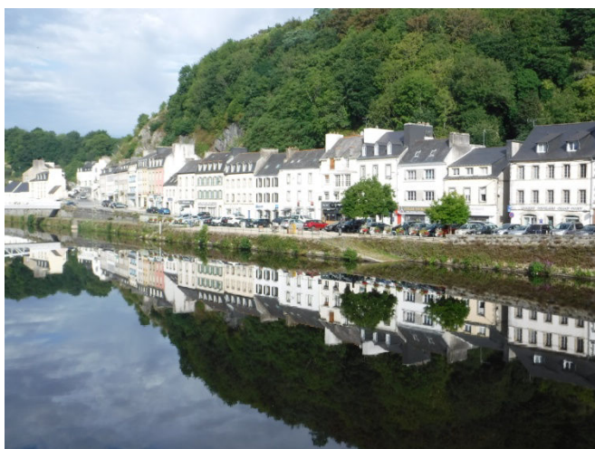
1 Des vues à couper le souffle