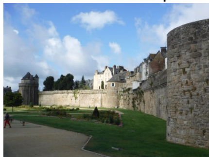
4 Une seconde vue des remparts