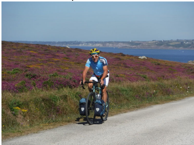
6 Philou sur les routes de la presqu'île du Crozon