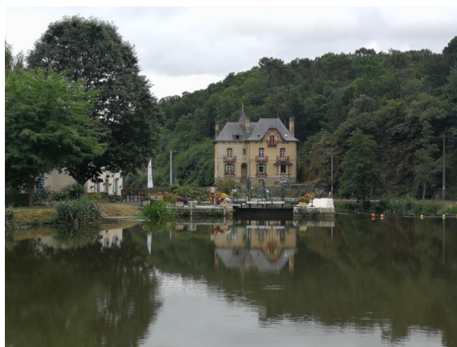
2 Notre première chambre d'hôte à Rohan