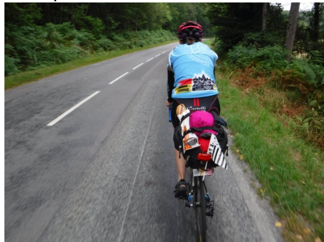
7 Nous roulons à la "Française" baguette et drapeau