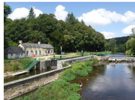
5 Canal Nantes -Brest