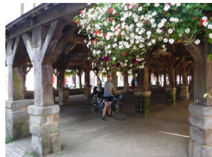
14 Marché couvert de Questembert