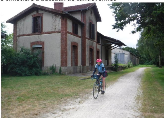
10 Ancienne gare longeant la voie verte