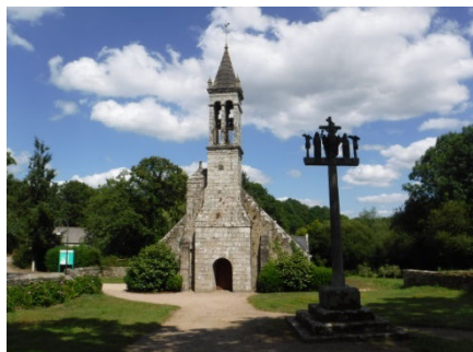
13 ND de Bonne Nouvelle