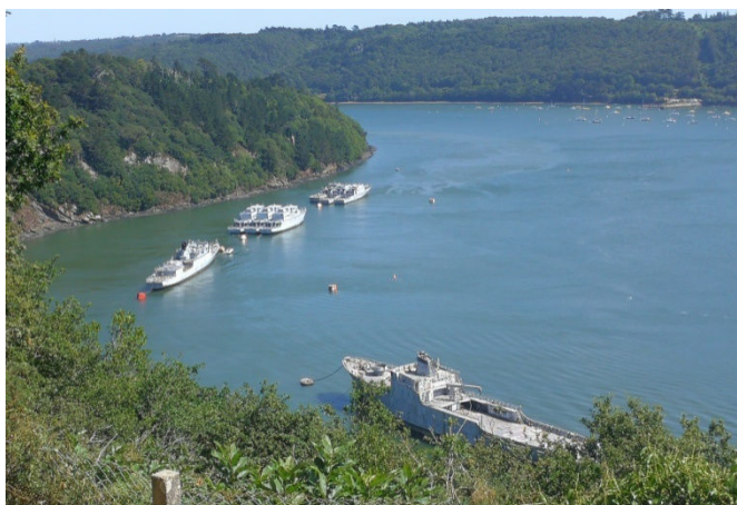
8 cimetière à bateaux de Landevennec