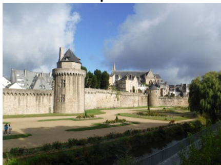
3 Vannes et ses remparts