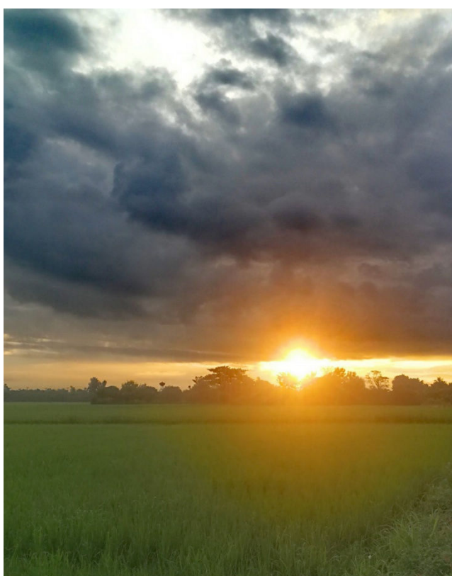
1) Fantasmagorique lever du soleil à Chiang Mai.

Que de brevets cyclos annulés en cette année de pandémie... Et donc, du moins chez les randonneurs au long cours, autant d'occasions manquées de voir le soleil se lever et/ou se coucher à l'horizon alors qu'on sort de la nuit ou/et qu'on s'y prépare. Rouler de nuit aura été une aventure insolite ou une expérience magique très rarement vue à vélo cette année. Cependant, puisque la terre a continué de tourner sur elle-même en 24h (tout en tournant autour du soleil en 365 jours !) le soleil a continué de se lever et de se coucher. Parfois en illuminant le ciel de manière fantastique qui incitait à sortir les appareils photos... Ne manquaient alors que les vélos !