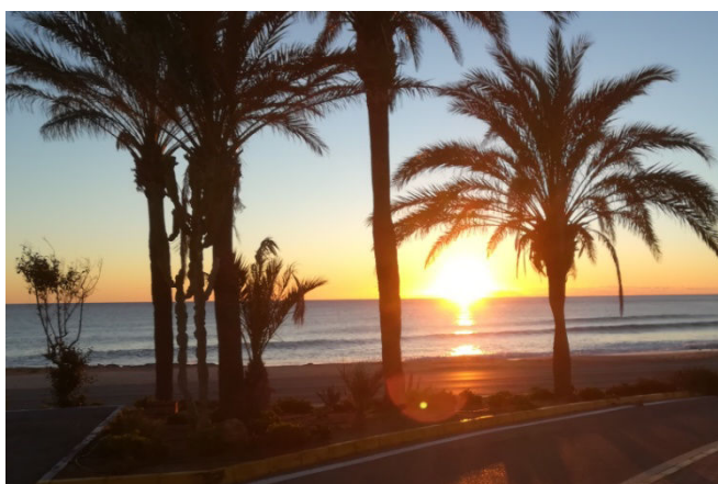
3) Preuve d'un joli séjour 2019 Andalou pour Dédé D.