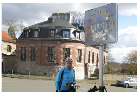
13) Frontière de France interdite.