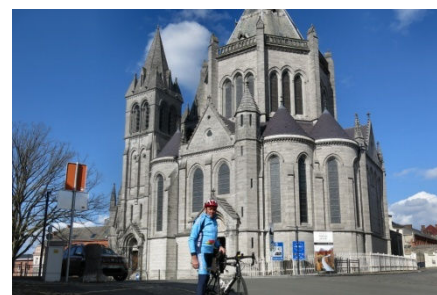
15) Alors seulement Bonsecours !