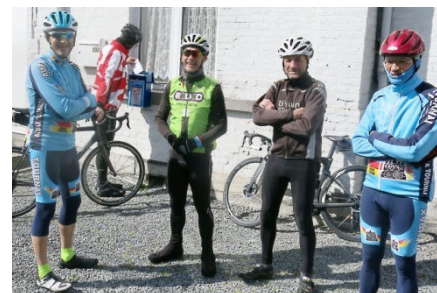
05) Bulle de 4... autorisée alors.