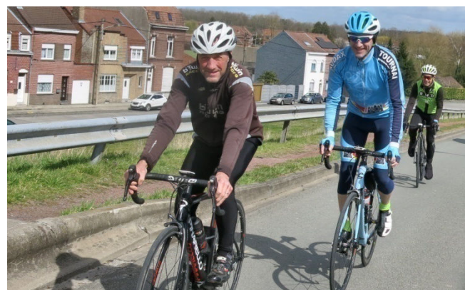
07) C'est parti pour le 70 km Forêt de Raismes.