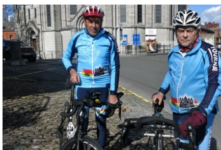
14) Crainte du virus variant Chti !