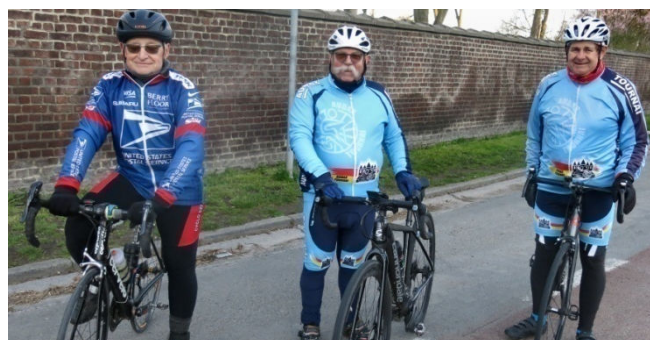
17) Nouveau départ Verte Feuille dimanche 28 mai.