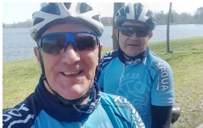
12) Un selfie au Grand Large de Péronne au retour.