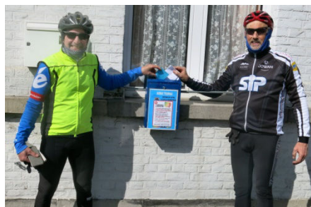
03) Boîte pour " e-card " au local.