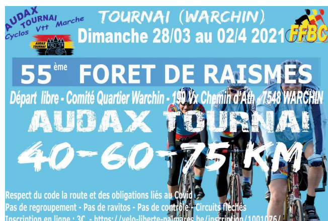
02) Affichette annonçant 55 e au lieu de 54 e en 2021.