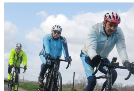
10) Derrière, on s'active vivement.