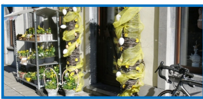
19) Préparatifs, huit jours avant Pâques à Péruwelz.