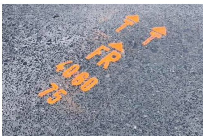
01) Parcours FR 40/60/75 fléchés " T " orange au sol.