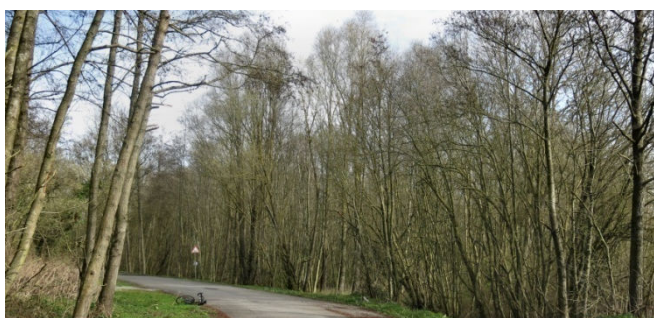
18) Forêt en cours de route mais pas celle de Raismes