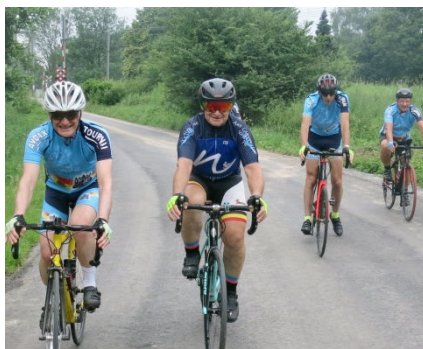
03) Parcours 50/70/100 km en région de vertes Collines d'Ath.