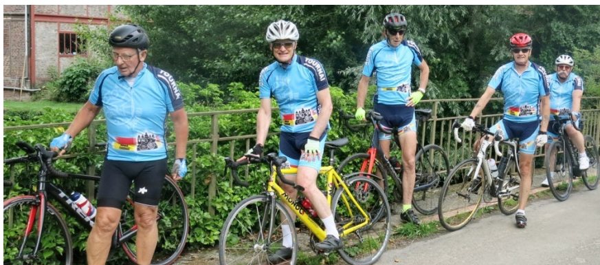
04) Le groupe Audax Tournai, parti à 8h30, au bord de la Dendre.