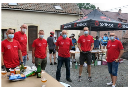
06) Pas moins de 6 bénévoles pour le service au ravito de Gibecq.