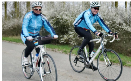
16) Vent piquant contraire à l'aller.