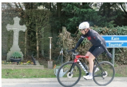
06) Pédaleur tournant vers le Mont