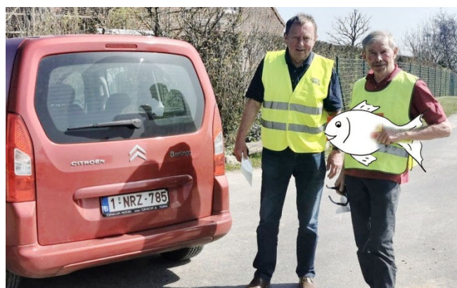
04) Ce 1 er avril tentation d'un fléchage poissonneux !