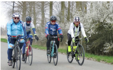
15) Décor printanier, temps frais.