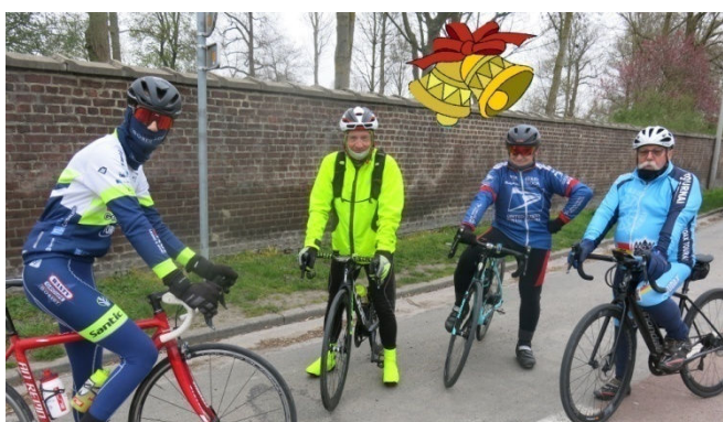
25) Nouveau tour le dimanche de Joyeuses Pâques.