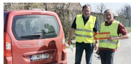
31) Défléchage panneaux Citroën.