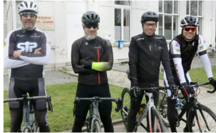
11) Quatuor Crazy pour le 110 km.