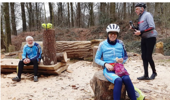
18) Faute de ravito, on sort les vivres des poches.