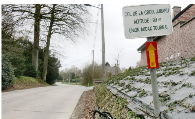
27) Avril 2021, ambiance Covid 19 au passage du col.