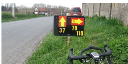
30) Panneau 37/70/110 de JClaude.