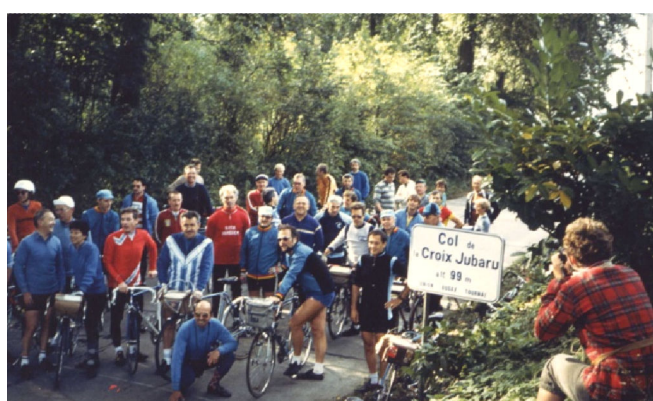
28) Avril 1985, inauguration du col Croix Jubaru 99m