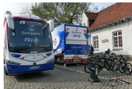
07) Team FdJ du Ronde au Mont.