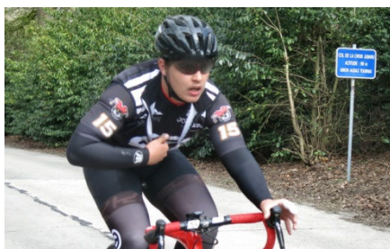
21) Passage aussi sportif que Crazy.