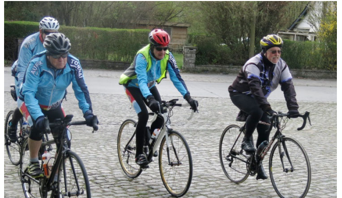
14) Bulle de 4 Audax Tournai sortant de Rumillies.