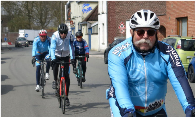
13) Bulle de 4 Audax Tournai partant de Rumillies.