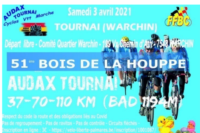
01) Bois de la Houppes au calendrier BAD de la FFBC.