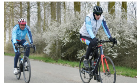
17) Le temps de voir venir les côtes