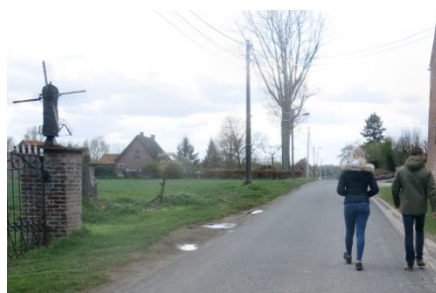
06) Marche dans Forest et environs