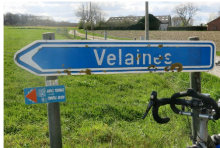
11) Direction Velaines sans y aller.