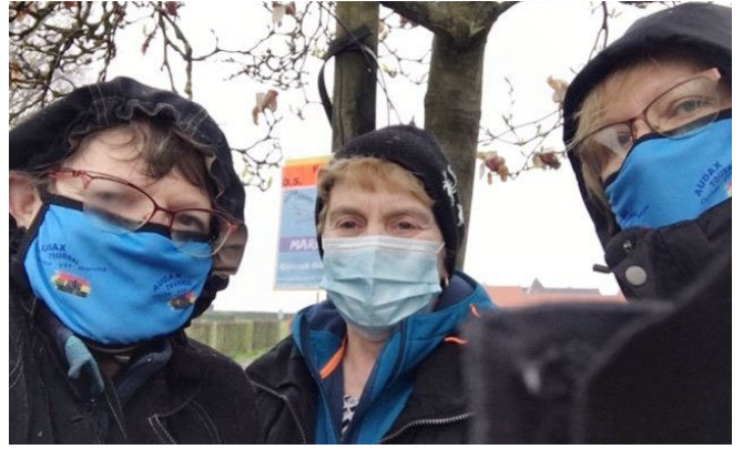
18) Le masque " Audax Tournai " anti-contaminant.