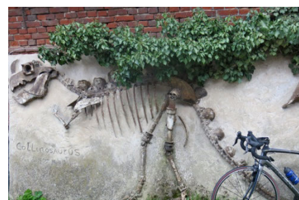
07) Célèbre fossile de Collinosaurus