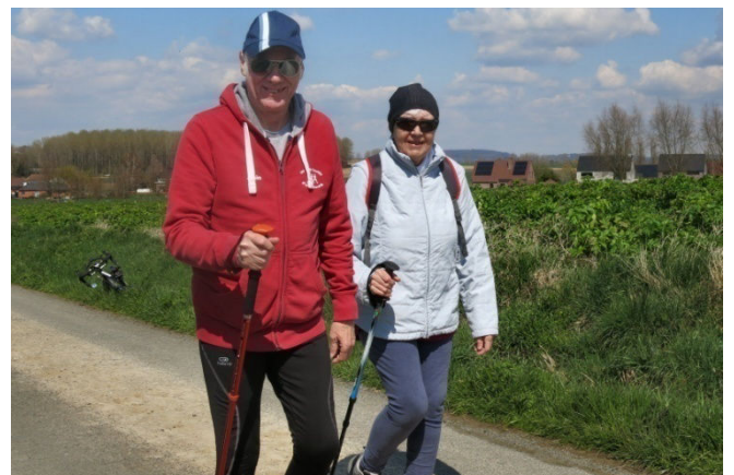
16) Venus marcher en attendant la reprise du jogging