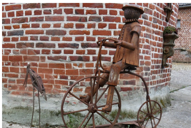
03) Forest vaut le détour pour ses "sculptures".