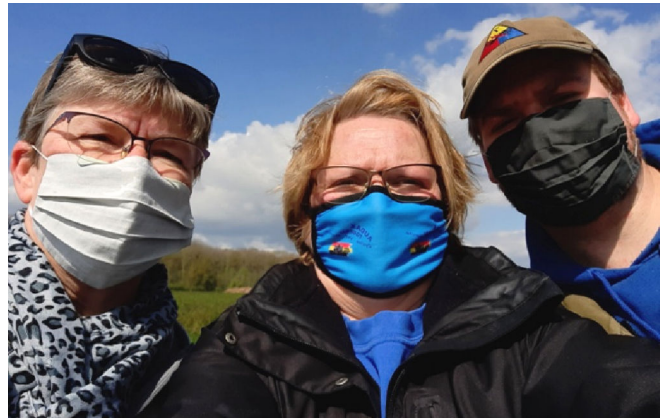
22) A droite, le fils du beau-frère d'un Audax connu !