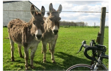
12) Qui se ressemble se rassemble.