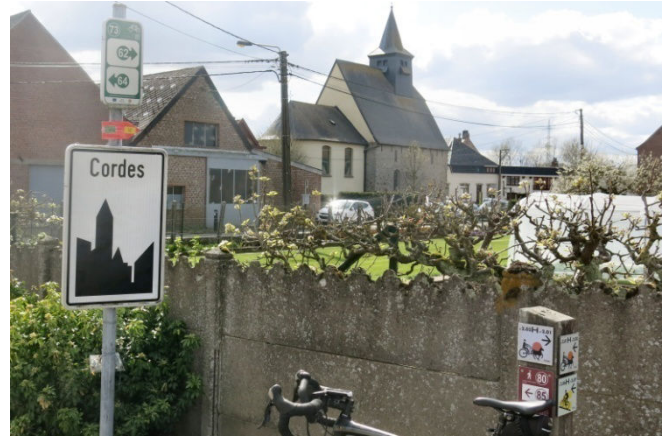
09) Le parcours passe par le petit village de Cordes : y voir l'église XIIe et sentir la torrèfaction de café !