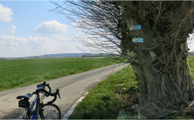
17) Parcours campagnard bien fléché sur saule.