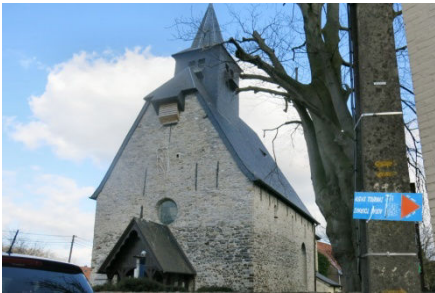
10) Eglise romane contournée.