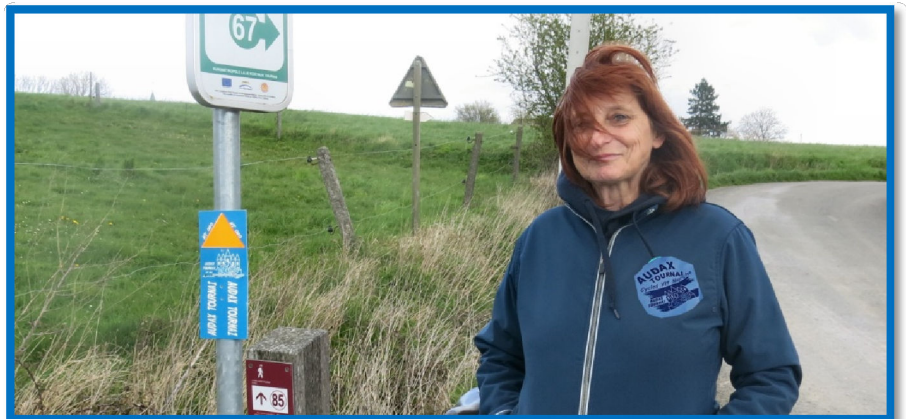
24) Belle marche proposée pour atténuer les affres de la pandémie.