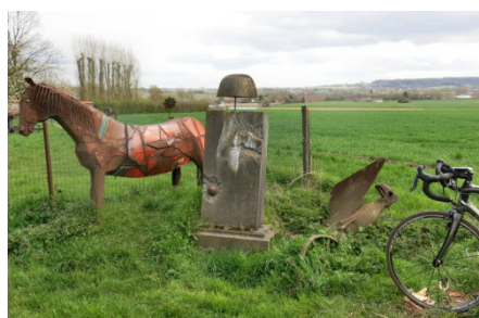
05) Napoléon après Waterloo 1815