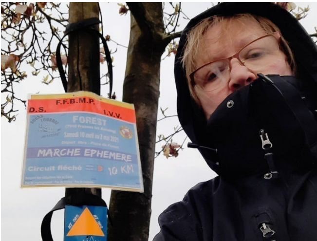
13) Repérage pour voir si la marche est aux normes.