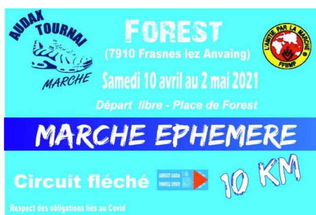
02) Circuit permanent du 10 avril au 02 mai 2021.