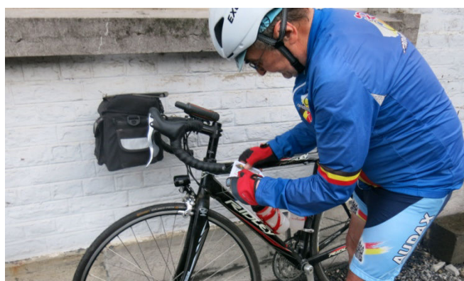
04) Danicau notre Randonneur Number One.