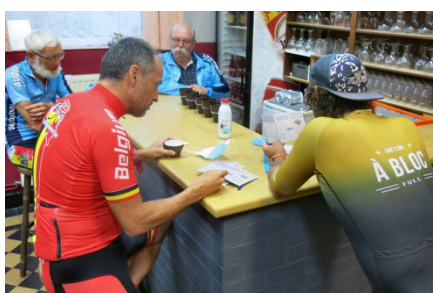
05) Venus de Belgique et du Nord.