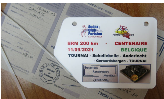
03) La plaque de cadre du BRM 200 du Centenaire.