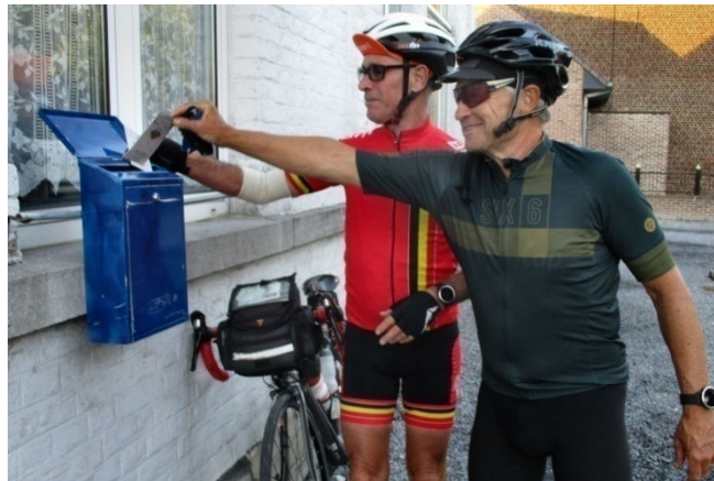
16) Mise en boîte des cartes car pas de bar au local.