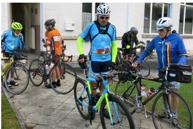
10) Départ et allure libres pour 200 km en – de 13h30