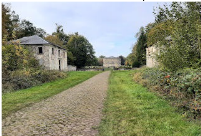
10 En fond le château de l'Hermitage