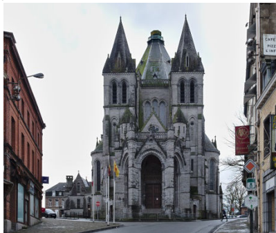
2 Départ basilique de Bonsecours