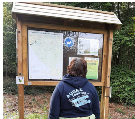
6 Panneau explicatif