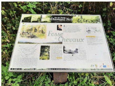
7 La Fosse à chevaux était à l'époque du charbon "le diamant noir".