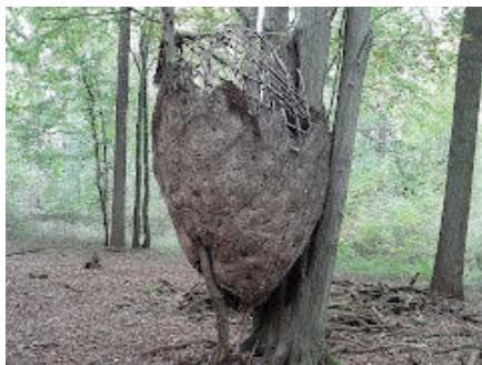
8 Des sculptures éphémères ont été placées dans le cadre de MONS 2015