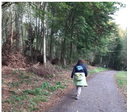
4 Tel un métronome, le pas est donné