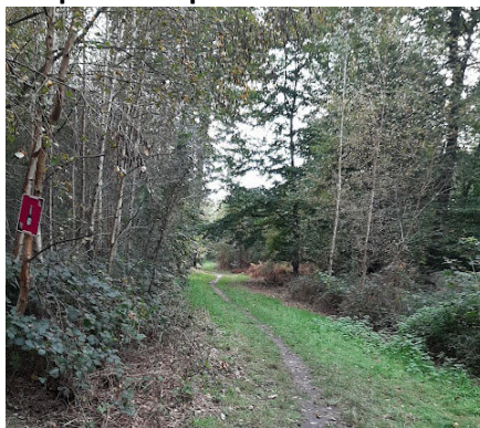
5 Parcours balisé