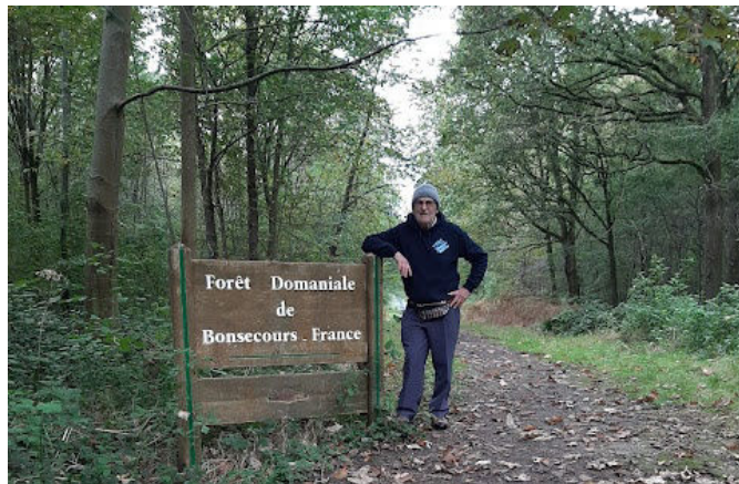
11 Et voilà, un paradis vert à côté de chez nous.