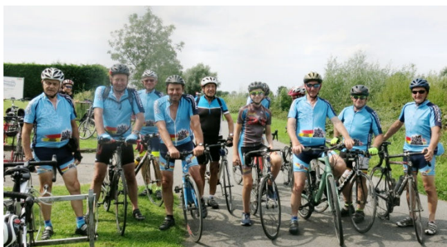
17) On reprend les machines pour filer vers Courtrai.