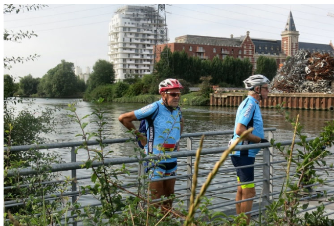
09) Belle vue sur la Deûle canalisée qui longe le site des (ex) Grands Moulins de Paris à Marquette.