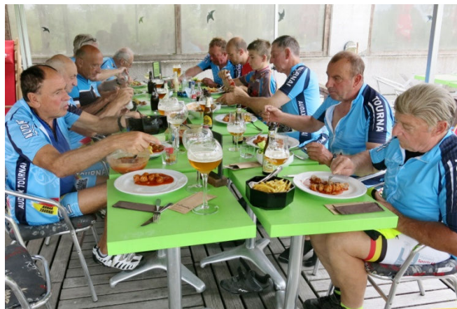
16) En terrasse, repas partagé en bonne convivialité. Tout va bien même si l'on sait qu'il faudra rentrer !