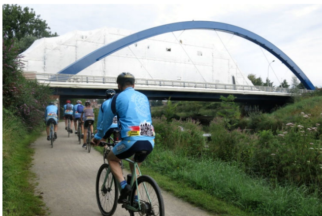
06) Pont " empaqueté " à la manière de Christo à hauteur de Wattrelos. Le circuit devient urbain.