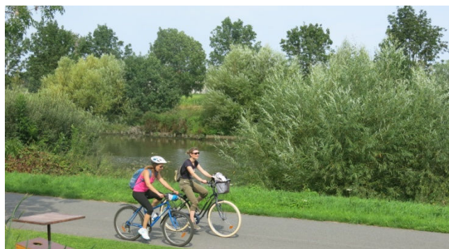
18) Sur cette piste agréable c'est fou de pédaleurs.