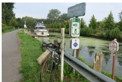
04) Sur 90 km le circuit est balisé.