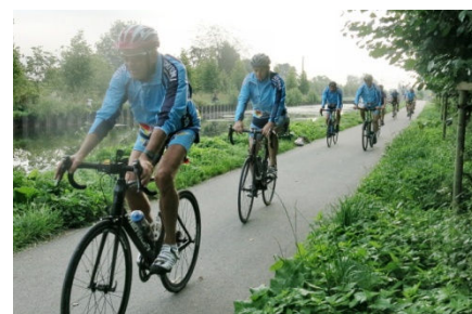
05) Canal d'Espierres après l'Escaut.