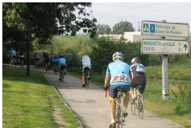
07) Très ambitieuse, mais agréable, la " véloroute " du Canal de Roubaix. Insolite traversée de la ville.