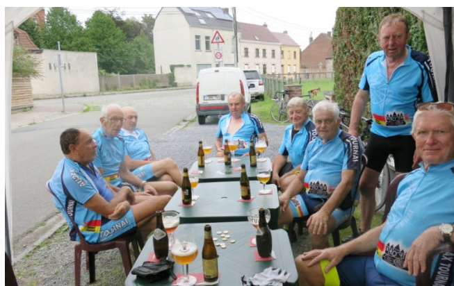
22) Bilan positif du Carré bleu... avant un Carré Vert ?