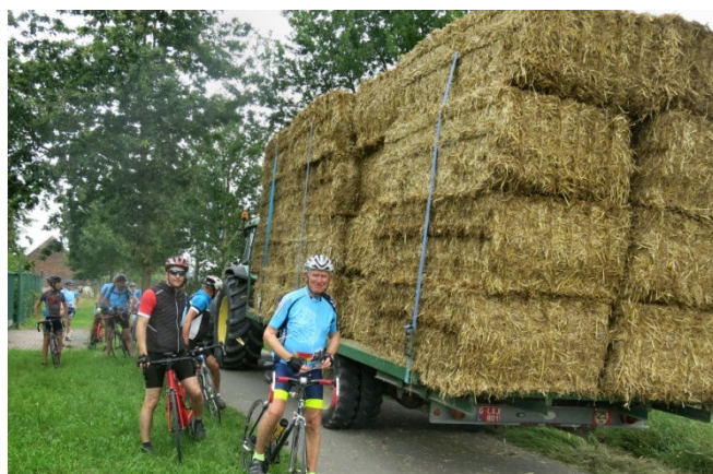
20) En ce 21 août 2021 et cet été maussade, les moissons ne sont pas terminées. Alors priorité...