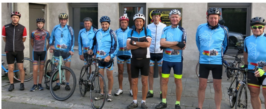
01) Départ matinal de Kain pour 12 Audax Tournai sur 122 km de chemins de halage. Temps idéal pour une journée vélo sans soucis.