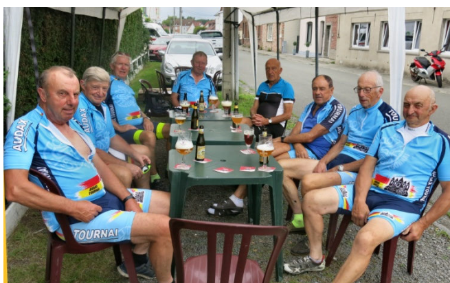
21) Puis c'est le réconfort face à la Clef d'Or de Kain.