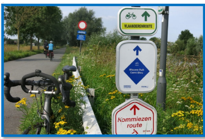
24) Le " Carré Bleu " de l'EuroMétropole peut être suivi en permanence, mais rien ne vaut... VICTOR !