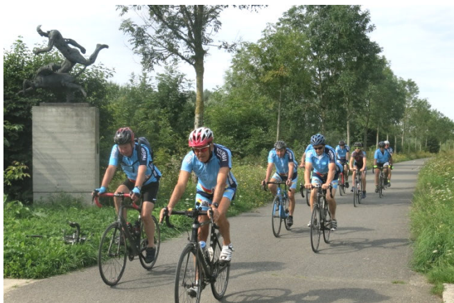
13) Après Comines, le retour en longeant la Lys/Leie