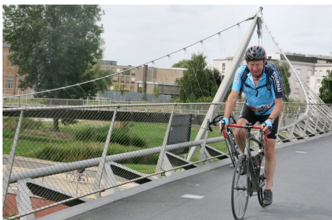
19) A Courtrai le lien entre la Lys et le canal de Bossuit se fait via cette superbe passerelle cycliste.