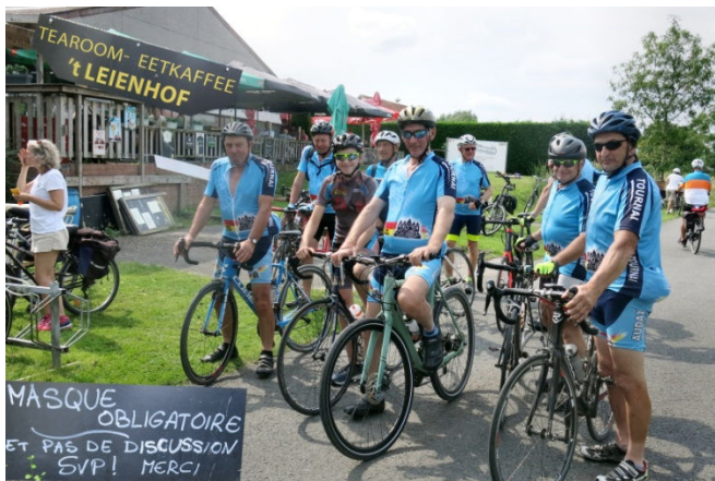
15) A Lauwe, face à la Lys, le t'Leienhof est une adresse accueillante pour le groupe qui a réservé.