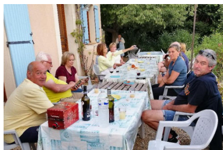
11) Table de retrouvailles au Gîte.