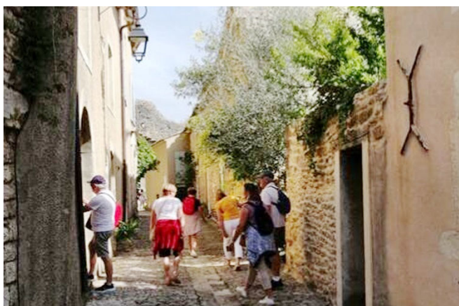
13) Jour de la visite de Bonnieux, village perché du Vaucluse avec un abrupt connu des cyclistes.