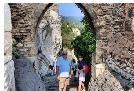
05) Marche dans les rues de village.