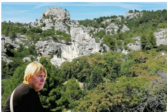
17) En Vaucluse, le massif du Luberon se distingue par ses falaises de roches serties de garrigue.