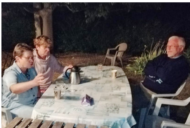
33) Nostalgie du soir quand on prolonge la journée.