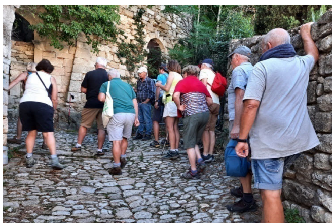
24) Promenade dans les "calades" d'Oppède le Vieux : pavé de galets digne du chemin des Poètes.