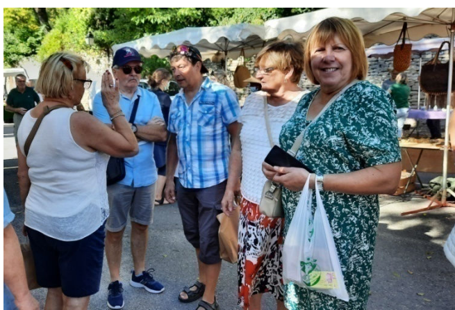
31) Dans la variété des activités, le marché de Gordes.