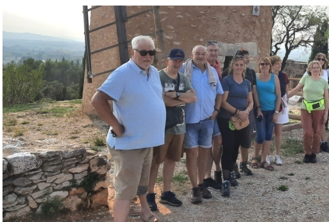
01) La découverte de St-Saturnin passe par le moulin.