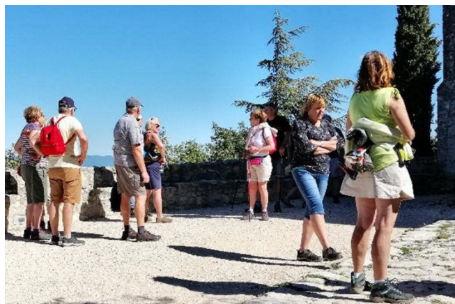
16) A Oppède le Vieux on a vu : le village, le château féodal, l'église ND d'Alidon, le moulin à huile...