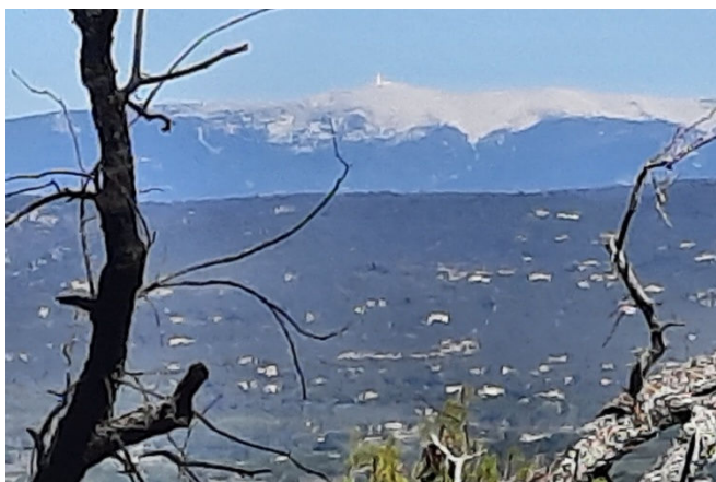
26) Au loin, mais pas si loin, le sommet du Ventoux, ce géant qui domine et sublime le Lubéron.