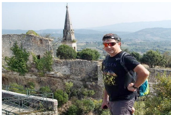
09) Mais il a fallu faire des choix difficiles.