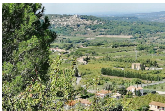
23) Parmi les cultures provençales, vignes et oliviers.