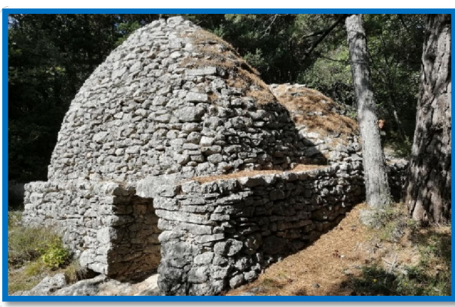
34) Une borie du pays pour un logement de fortune.