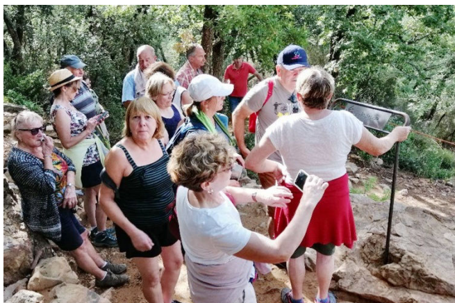
15) Oppède le Vieux est un village, bien préservé, construit sur un éperon rocheux, qui force l'arrêt.