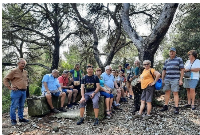
02) Et une exploration guidée du décor provençal.