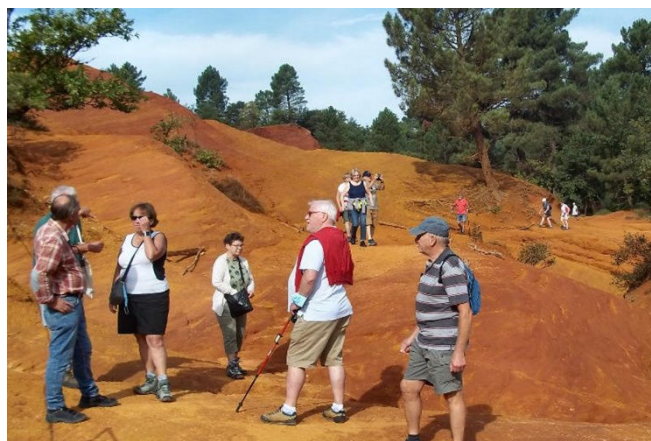
07) La couleur ocre est bien celle de la terre du lieu. L'ocre y fut exploitée jusqu'en 1992 comme colorant.