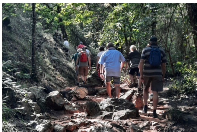
14) Les marcheurs ont le privilège d'arpenter un chemin de cailloux en pleine nature sauvage.