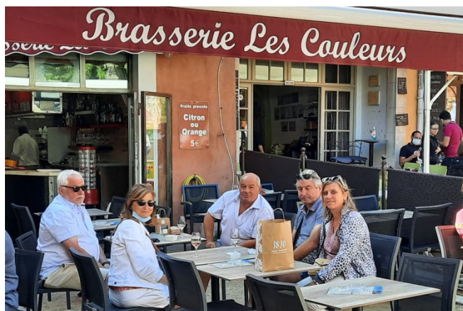
25) Les couleurs du Lubéron sont si belles et variées qu'on demande à revoir celle de la mousse.