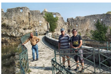
19) Les Remparts de St-Saturnin.