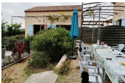
10) Idée du Gîte Oiseaux de Passage