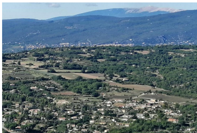
18) Le village de Saignon, perché sur un plateau à 820m, domine une basse vallée situé à 230m.