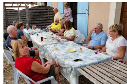
12) Dans l'attente du repas du soir.