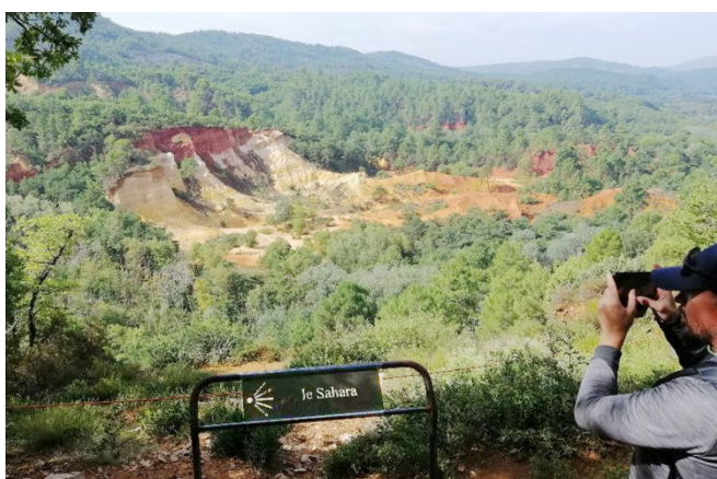
22) Du Colorado, on est passé au Sahara végétal.