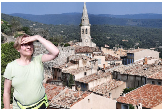
08) Au-delà de Saint-Saturnin chaque jour avait sa destination touristique dans le Lubéron provençal.