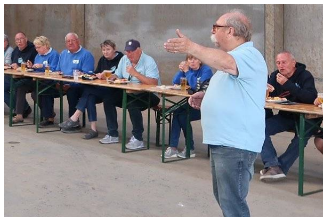
12) Moustache n'en finirait pas d'expliquer les démarches nécessaires pour mener à bien le projet.