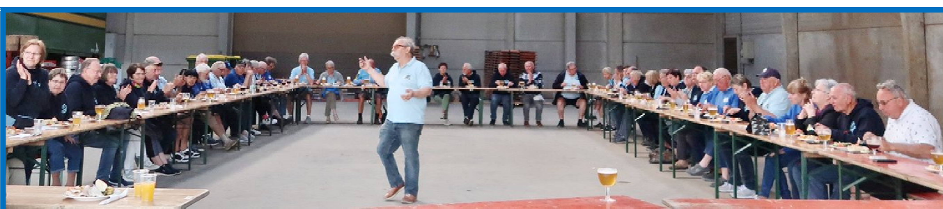
13) Comme dans les aventures d'Astérix et Obélix, la Grinta ! se termine par une tablée autour d'UNE... BIERE !