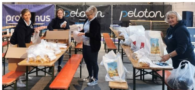
06) Préparation des sandwiches pour les bénévoles.