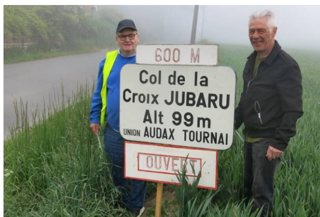
02) Ils avaient pour mission de poser les panneaux devant compléter le fléchage réalisé le jeudi.