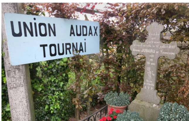
03) Personne ne se plaindra de la protection d'Amand Jubaru : pas d'accident à la Grinta ! 2022.