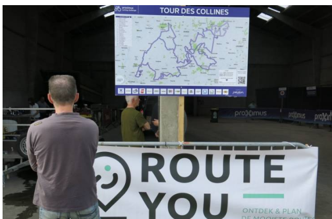
09) Un parcours musclé dans les Monts et Collines. Les parcours, bien fléchés, sont disponibles sur GPS.