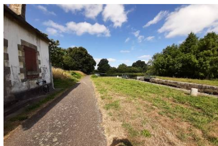
Routes en parfait état

Une expérience qui nous rappelle que nous pratiquons un beau sport tout en restant humbles dans nos exploits