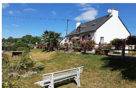
De jolies maisons fleuries