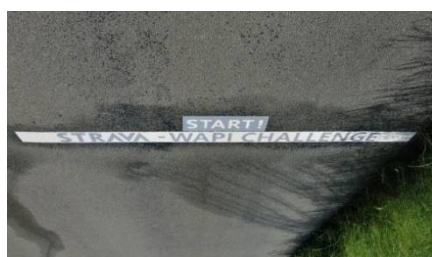
04) Une ligne « Start » pour Strava.