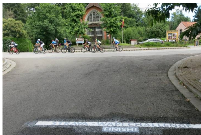
14) Là aussi une ligne « Finish » pour le Strava.