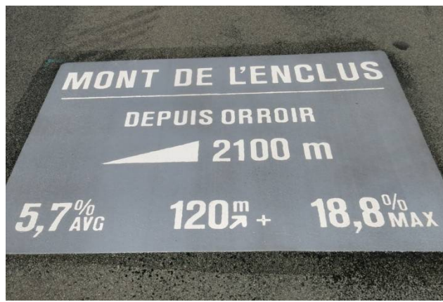
12) Nos moyens étant limités, le logo Audax Tournai ne figure pas à l'Enclus, La Houppes et Beau Site.