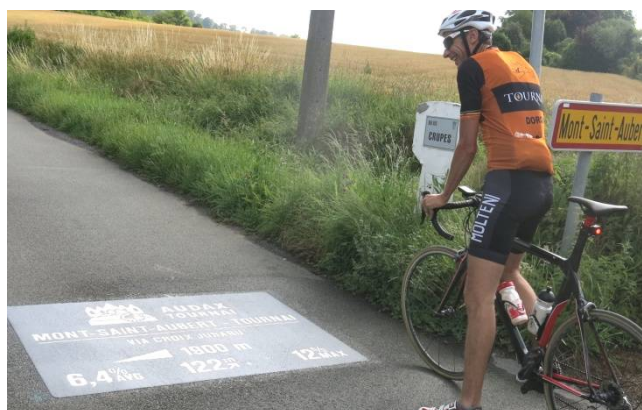
02) Avec le temps point ne sera nécessaire de s'arrêter pour consulter les données chiffrées.