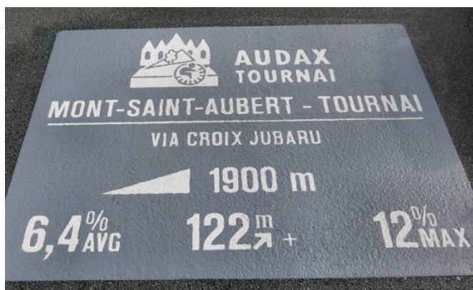
01) L'un des trois thermocollés posés au pied du Mont dé but juillet 2022. Voir le logo Audax Tournai.

De l'aveu même des autorités d'IDETA, la demande de panneaux signalétiques sur les flancs du Mont Saint Aubert par les Audax Tournai, a « accéléré la réflexion » d'inclure les Monts de Wallonie Picarde dans le vaste projet transfrontalier d'une Chaine des Monts via Interreg. Le tout dans la perspective Eurocyclo de favoriser la pratique cycliste de loisir sportif passant par des Monts de France, de Flandre et de Wallonie. Le tout étant assorti d'un défi moderne baptisé « Strava Wapi Challenge » à l'usage des pratiquants adeptes du GPS et autres smartphones. Ceci de manière à profiter des superbes paysages régionaux tout en se mesurant aussi bien à soi-même qu'aux autres. Dans cette opération les Audax Tournai sont intervenus au titre d'experts pour les données chiffrées comme ils l'avaient fait pour « l'Encyclopédie Cotacols, 1000 côtes de Belgique » parue en 1990.