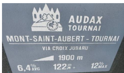
03) De Tournai, via la Croix Jubaru.