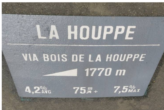
13) La Houppes, au cœur de notre Bois de la Houppes.