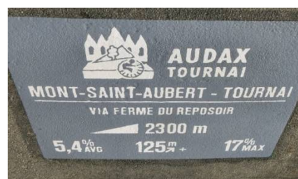
05) De Kain, via Ferme Reposoir.