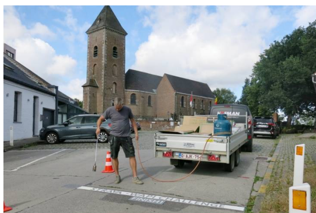
07) Le « Finish » du Strava Wapi Challenge au Mont.