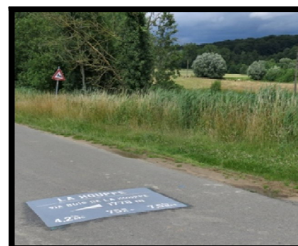
16) L'idée est de favoriser la pratique sportive du vélo dans une région qui s'y prête !