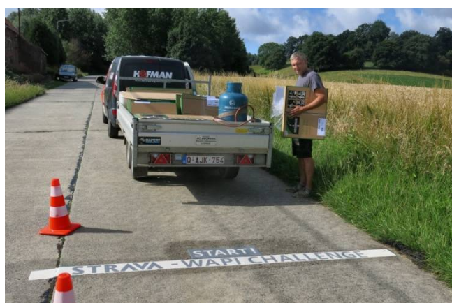
06) Le « Start » du Stava Wapi Challenge au pied.