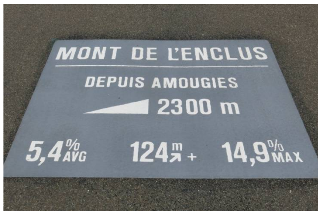
11) Ces thermocollés se retrouvent sur 4 collines de Wapi qui intègrent une « Chaîne des Monts ».