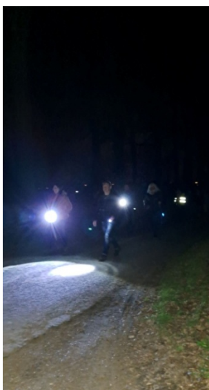
13 Toutes leumerotes allumés ils s'arrivent