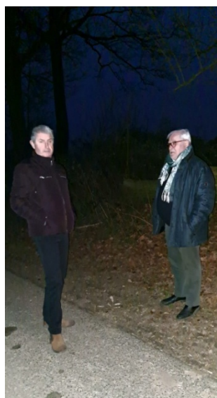
12 Le silence de la nuit est perturbé