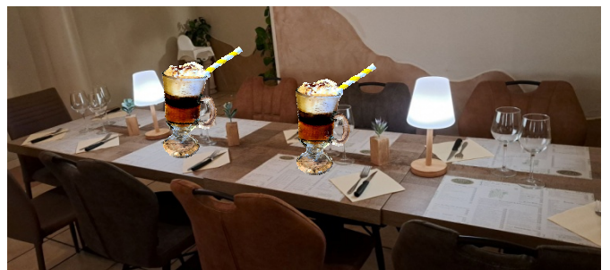
6 Tables mises avec soin mais sur l'autre on n'a pas attendu ... sans doute fait-il froid, voir... très très froid