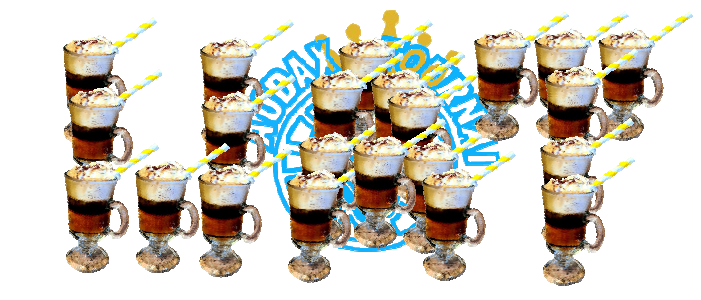
22 Pour teminer une farandole d'irich Audaxienne