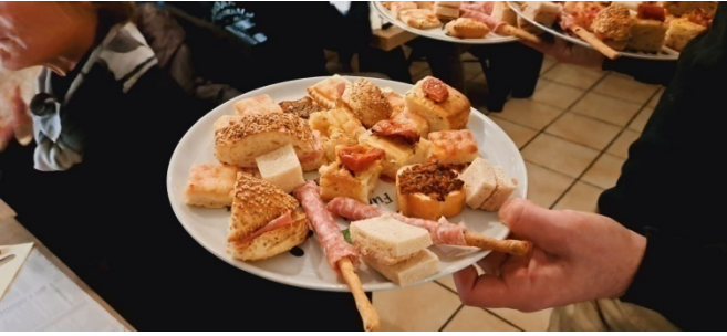
16 Au menu pour requinquer tout ce beau monde