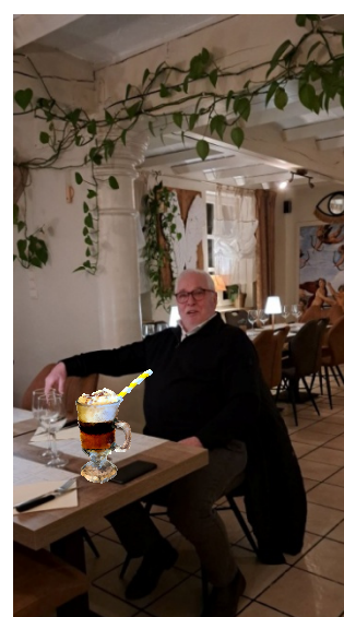
14" Je commençais à me faire un sang d'encre " dit le président