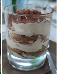
Pizzas Pizzico maison et mousse au chocolat