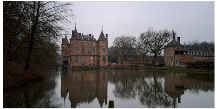
2 Depuis que nous sommes Royal" on s'y fait bien à la vie de château. Direction le château d'Anvaing.