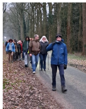
9 Derrière ça suit en papotant