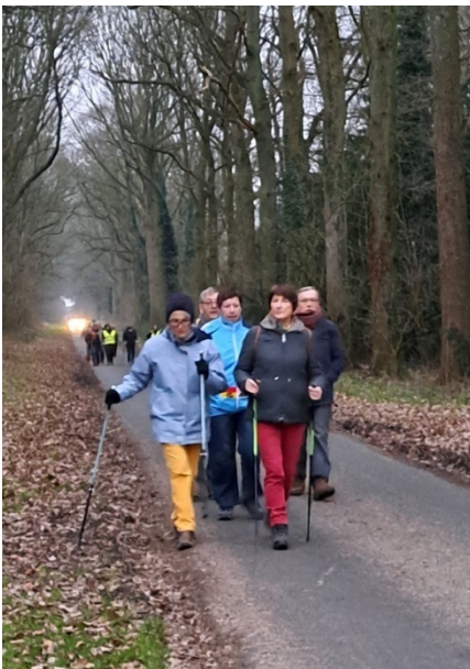
3 Les "Bâtons facilitent l'allure