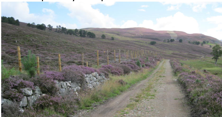
11 Des flancs de montagne couverts de bruyères de se parquer dans les passing places.