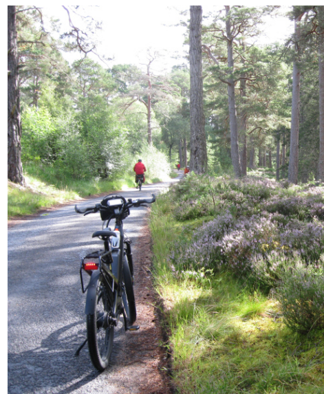
13 Petit arrêt dans la forêt