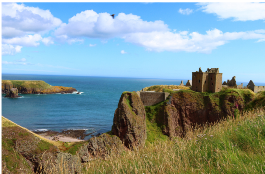
12 Dunnotar Castle