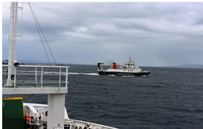
7 Pour raccourcir les liaisons en voiture, nous avons pris quelques ferries