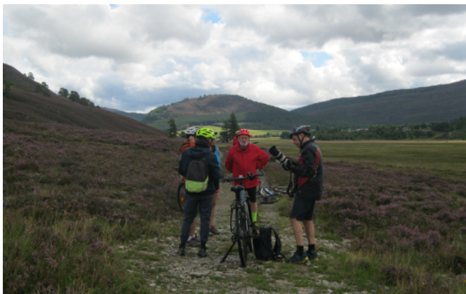
6 A Fort William, nous avons tenté l'ascension de Ben Nevis, le sommet de plus haut du Royaume Uni. Nous avons renoncé en raison de la pluie car la descente la montée et la se faisaient sur un chemin rocailleux et glissant