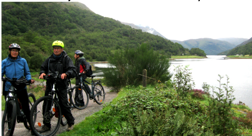
17 En Ecosse, on voit les 4 saisons chaque jour

Personnellement j'ai bien aimé les bières brunes style Guinness