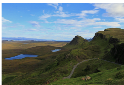
14 Au sommet du.... pass