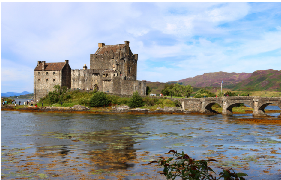
9 Nous avons admiré quelques châteaux emblématiques d'Ecosse comme Dunnotar et Eilean Donan, ainsi que celui d'Edimbourg, ville très animée qui a un style assez particulier