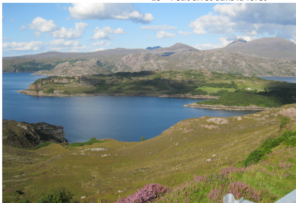
16 Un loch, la mer et les montagnes

Personnellement j'ai bien aimé les bières brunes style Guinness