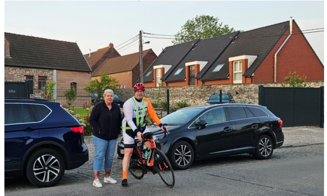
2 Retardataire on ne sait pourquoi mais il terminera