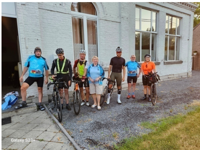
7 Pour 600 km