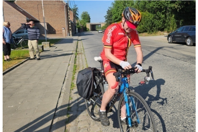
6 Formalités d'inscription ok, c'est le gps qui débloque. Belle journée en vue