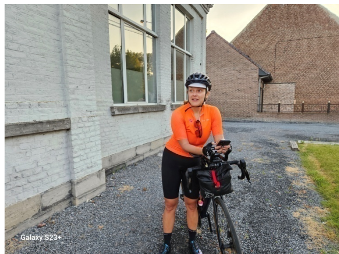
8 No problème GPS Bye bye