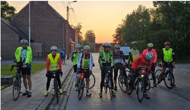
3 - 6h du matin le soleil pointe son nez, c'est parti