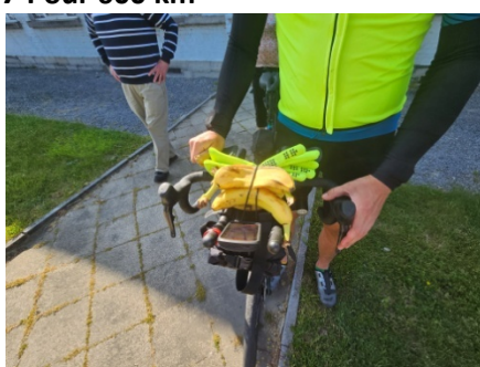
9 Bananes en suffisance juste ce qu'il faut ni plus ni moins