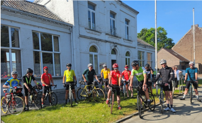
1 Départ imminent pour 13h30 de selle max