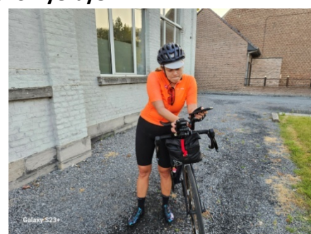
11 Foutu bordel de gps. Tout à l'heure il marchait