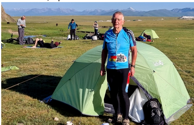
Logement en tente puis yourte puis chez l'habitant.

Le jour suivant , des chemins caillouteux s'enfoncent un peu plus dans la chaîne montagneuse de Tien Shan, une des plus grandes d'Asie. Puis le relief passe par de courtes montées abruptes succédant à de longues descentes piégeuses sur des pistes, en mauvais état, à proximité de rivières tumultueuses.