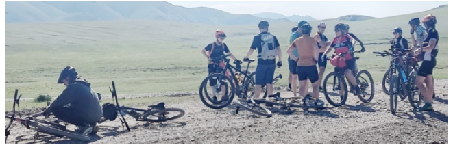
Un groupe de 12 cyclos vttistes anglophones.

La première journée est consacrée à la visite de la capitale, Bishkek, très imprégnée de son passé soviétique. Le pays est l'un des rares où l'on peut encore voir des statues de Lénine et de Marx .