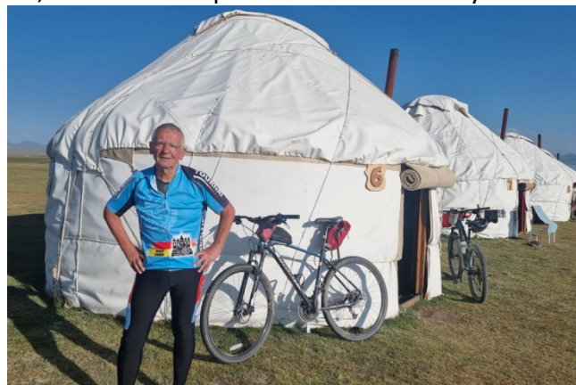
Plein ciel bleu avant une nuit quasi à la belle étoile.

L'étape du jour 7 ne comporte que... 39 km. mais avec 24 km d'ascension vers le sommet culminant à 3.346 m. Petit braquet en permanence pour arriver au sommet après 3 heures et demi de montée dans la caillasse. Lunch au sommet avec un point de vue remarquable à 360 degrés. Il reste à redescendre sur des chemins tout aussi difficiles vers le lac Son Kul, où nous allons passer la nuit dans une yourte.