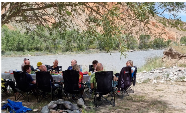
Une camionnette pour le matériel et le pique-nique.

L'accompagnement des cyclos est bien organisé : nos bagages sont transportés par une camionnette qui nous précède tandis qu'une autre assure le ravitaillement de l'étape. Un accompagnateur cyclo roule devant et un autre derrière.