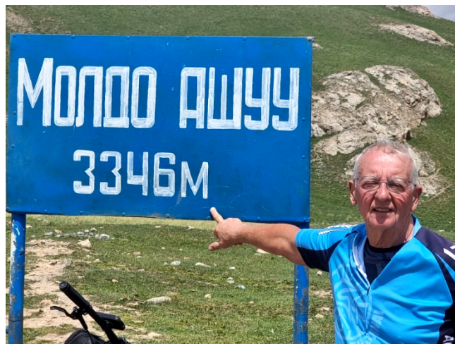
Le point culminant du périple affiche 3346 m.

Les tentes montées, on apprécie le repas préparé par nos guides. Et il ne nous reste plus qu'à apprécier le ciel étoilé, sans aucune pollution lumineuse.