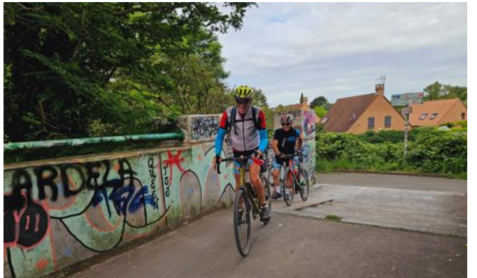
10 Chacun y va selon son degré de franchise