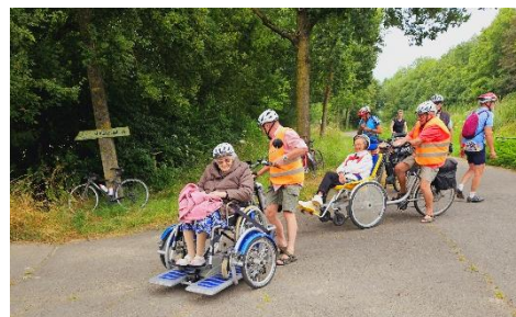
35 Arrêt insolite avec ces quatre personnes à mobilité réduite