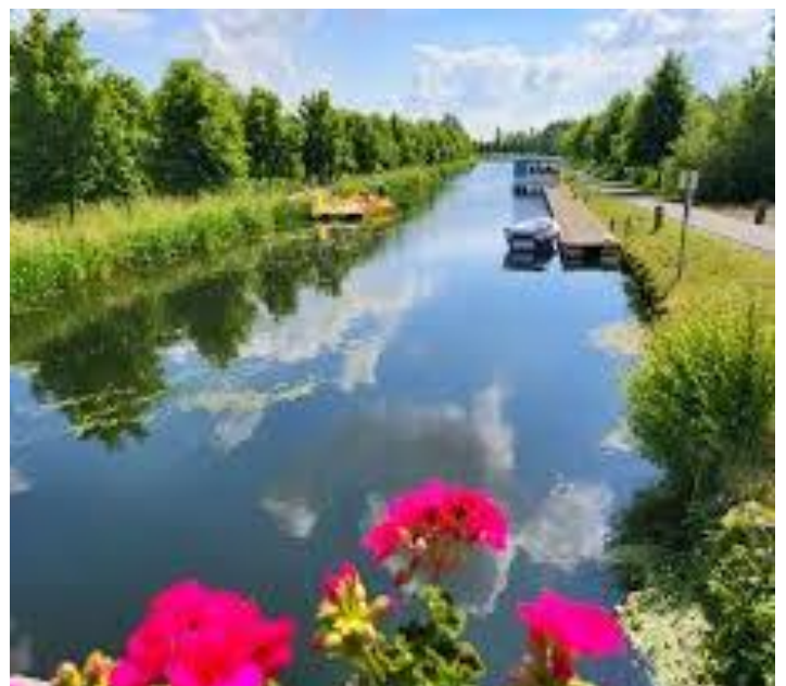
2 Vue bucolique sur le canal de l'Espierres

Construit de 1840 à 1843 afin de relier la Deûle à l'Escaut, le but de ce canal était d'approvisionner en eau et en charbon Lille-Roubaix-Tourcoing. Pendant plus de cent ans, le canal de l'Espierres a contribué à l'essor économique de la région.