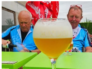
17 Arrive le rafraîchissement avant le repas " boulettes frites