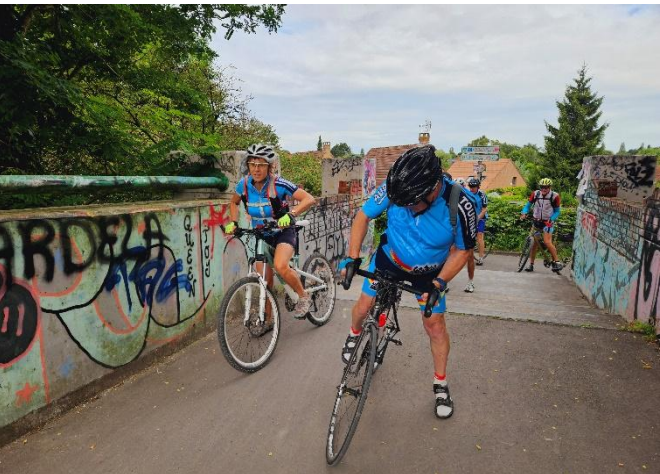
7 Une fois la difficulté passée, on reclipse les pédales