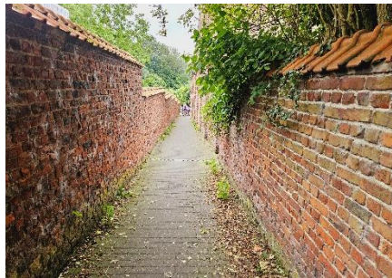
14 Tout comme cette jolie ruelle