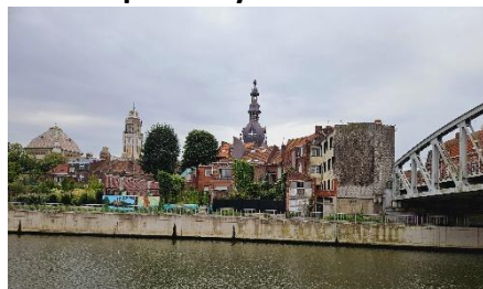
16 Ploegsteert son magnifique clocher