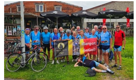
18 Photo souvenir avant le retour tout en suivant le canal