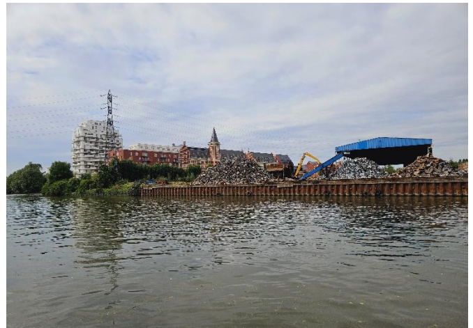
12 Les Grands Moulins de Paris