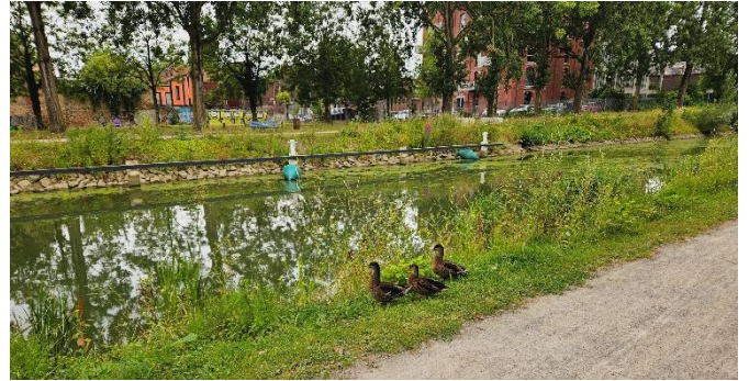
4 Sans doute pas aux goûts de ces canards, mais nous sommes non pas applaudis