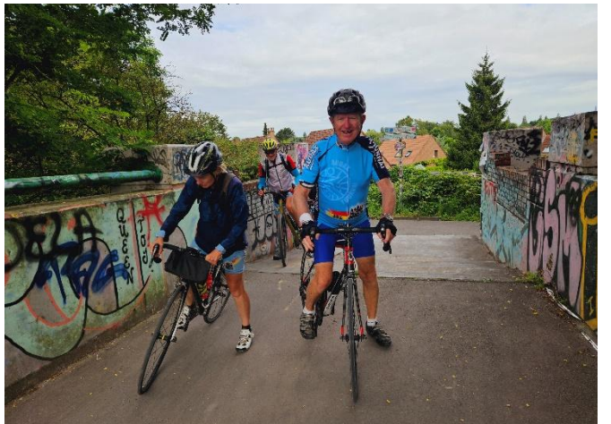
8 Cela se passe et se fait dans la bonne humeur