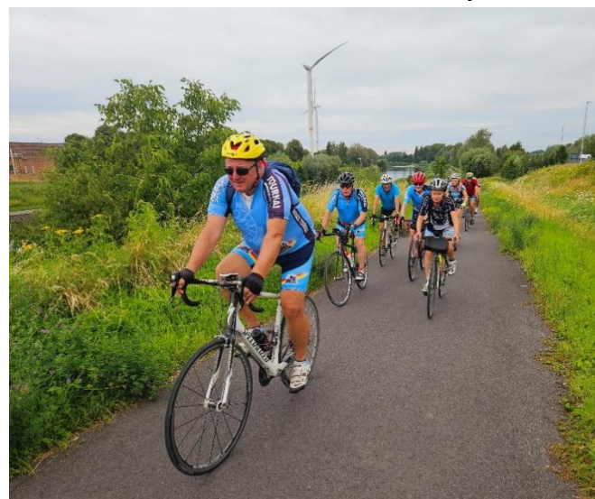
28 Dernier tronçon de halage vers Warcoing