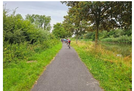
15 Où encore ce chemin de halage