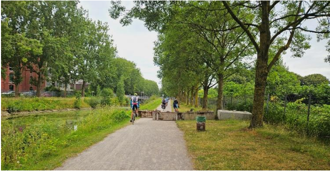
3 Passage bucolique en longeant le canal, tantôt à gauche tantôt la rive droite.