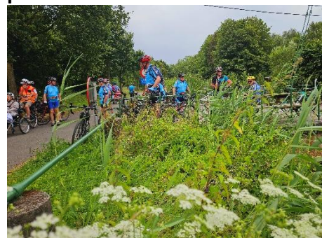
36 Tout le groupe ne manquera pas de féliciter les guides pour cette belle initiative