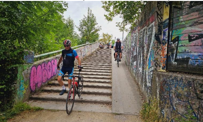
9 Comme dans les grimpettes, il y a les descentes soit vélo à la main ou pour les plus fringants la passerelle