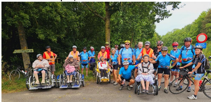
34 Conduites par leur guide profitant ainsi des bienfaits de la campagne