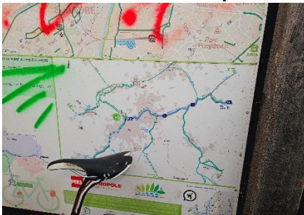
13 Passage du canal de Roubaix à la Deûle puis la Lys.