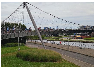
19 Arrive Courtrai et sa magnifique passerelle