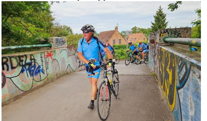
6 Parfois il faut mettre pied à terre