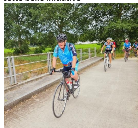
Ce n'est pas Arthur qui nous dira le contraire et même, il ajoutera: " A refaire "