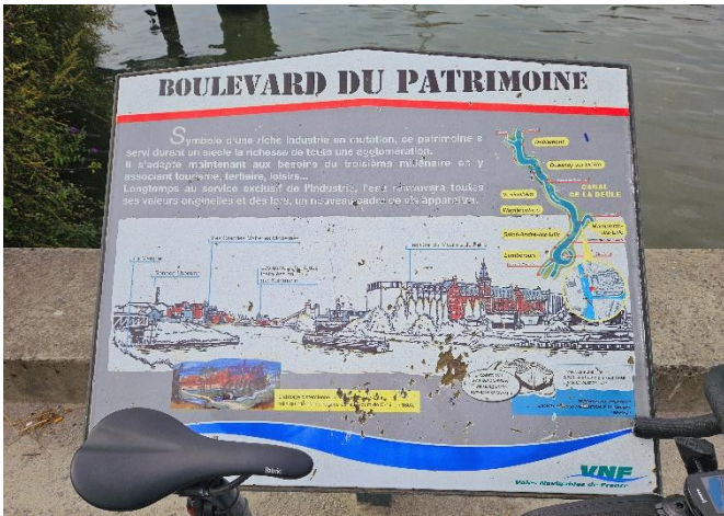
11 Arrive l'endroit à ne pas manquer