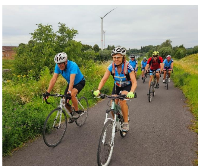
29 Chacun roulant à sa main profitant des derniers rayons du soleil