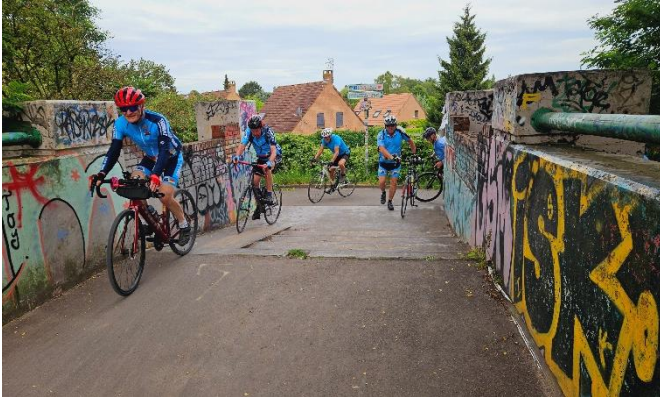
5 Passage d'une rive à l'autre par des ponts caricaturés